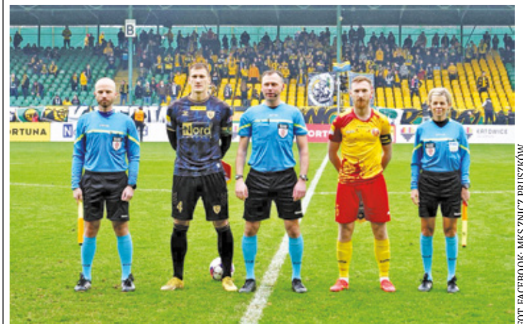
Rywalizacja z GKS-em w Katowicach

– Determinacji, zaangażowania, woli walki na pewno nam dzisiaj nie zabrakło. Uważam, że zabrakło nam w pierwszej połowie głównie trochę rozsądnych decyzji pod swoim polem karnym, żeby delikatnie zmienić swoją pozycję i nie pozwolić tak łatwo zdobyć bramki ze stałego fragmentu gry – powiedział na pomeczowej konferencji