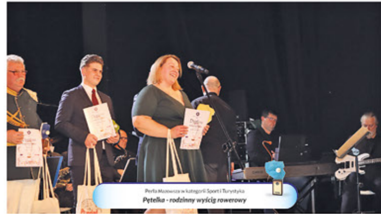
Perła Mazowsza w kategoriach: Sport i Turystyka Pętella - rodzinny wyścig rowerowy