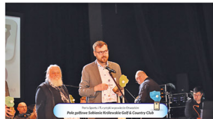
Perła Sportu i Turystyki w powiecie Otwockim Pole Golfowe Sobienie Królewskie Golf & Country Club