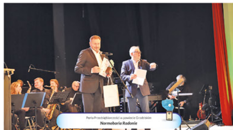
Perła Przedsiębiorczości w powiecie Grodzkim Normbaria Radonie