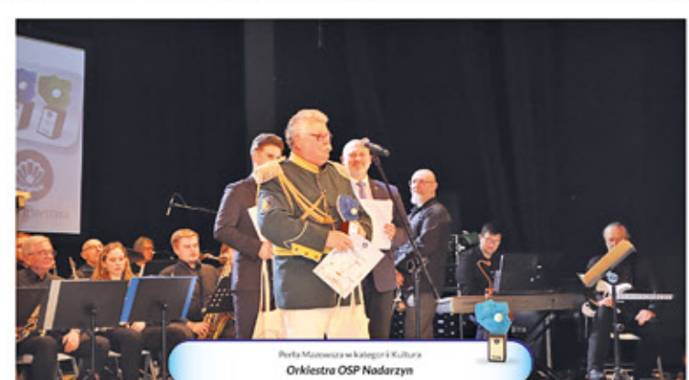
Perła Mazowsza w kategorii: Kultura Orkiestra OSP Nadarzyn