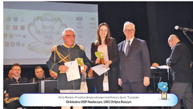
Perła Powiatu Pruszkowskiego w kategoriach: Kultura, Sport i Turystyka Orkiestra OSP Nadarzyn, UKS Orleto Raszyn

Kolejne wyróżnienia powędrowały do zwycięzców w powiecie pruszkowskim,