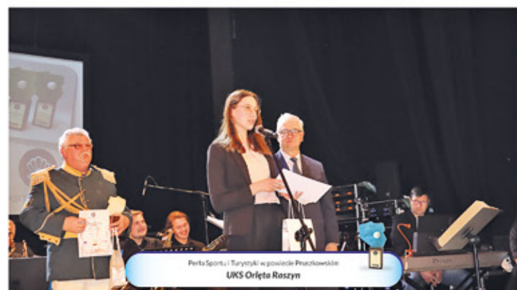
Perła Sportu i Turystyki w powiecie Pruszkowskim UKS Orleto Raszyn