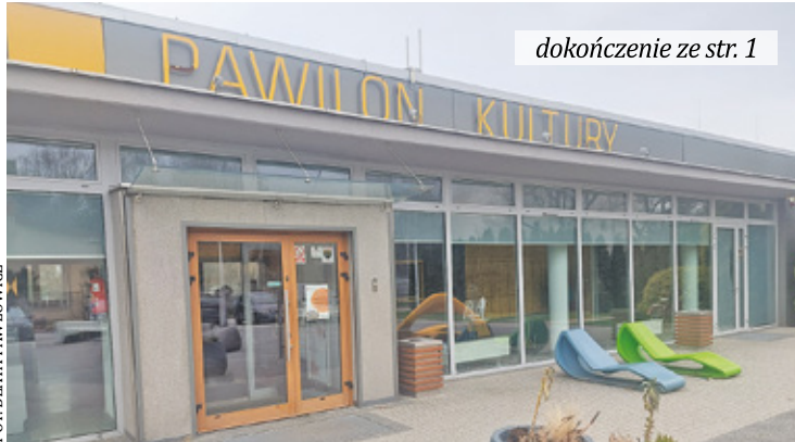
dokończenie ze str. 1

Wizualizacja projektu modernizacji Pawilonu Kultury i jego najbliższego otoczenia pokazuje, jak zmieni się wygląd samego budynku, ale także jego otoczenia m.in. dzięki powstaniu zielonego patio. Dodajmy, że warunki panujące dziś w Pawilonie Kultury, na pierwszy rzut oka nie odbiegają od standardów, jakie Grodzisk Mazowiecki oferuje w tego typu placówkach swoim mieszkańcom i do jakiego standardu mieszkańcy się już przyzwyczaili. Jednak czas zrobił swoje i pawilon wymaga, co najmniej remontu m.in. dachu.