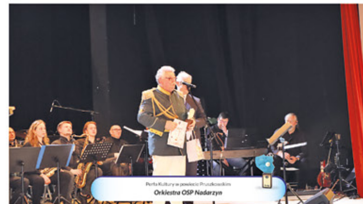
Perła Kultury w powiecie Pruszkowskim Orkiestra OSP Nadarzyn