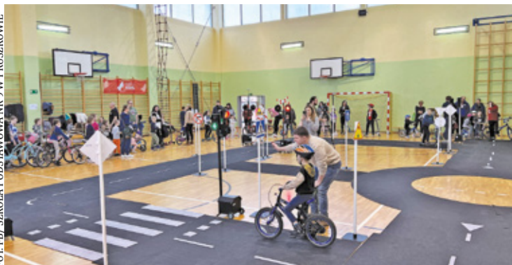
Dzieci jeździły po miasteczku za pomocą roweru i hulajnog

Urząd miasta we współpracy z dyrekcją Szkoły Podstawowej nr 9 w Pruszkowie zorganizował dla wszystkich mieszkańców spotkanie pod nazwą „Bądź bezpieczny na drodze”. Oczywiście przede wszystkim zaproszeni na wydarzenie byli najmłodszy. Dzieci miały okazję wypróbować swoją wiedzę i umiejętności poruszania się po mieście dzięki mobilnemu miasteczku ruchu drogowego oraz symulatorowi przejścia dla pieszych. Młodzież mogła się sprawdzić nie tylko w roli pieszego, ale też jako kierowca hulajnogę czy rowerem.