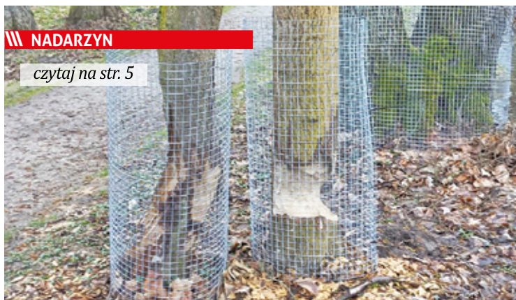
Zniszczenia dokonane przez bobry