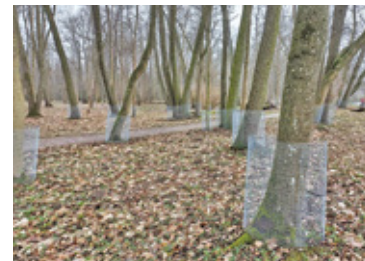
Drzewa zostały zabezpieczone

W przeciągu ostatnich miesięcy bobry żyjące w Parku w Młochowie im. Janusza Grzyba zaczęły niszczyć rosnące tu drzewa. Czy gminie uda się uratować roślinność na tym zabytkowym terenie?