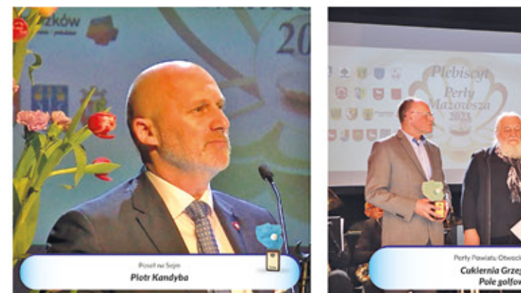
Prez na Sejm Piotr Kandyba