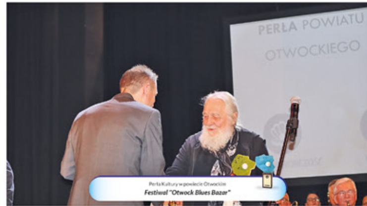
Perła Kultury w powiecie Otwockim Festival "Otwock Blues Bazar"