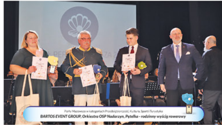
Perła Mazowsza w kategoriach: Przedsiębiorczość, Kultura, Sport i Turystyka BARTOS EVENT GROUP, Orkiestra OSP Nadarzyn, Pętella - rodzinny wyścig rowerowy