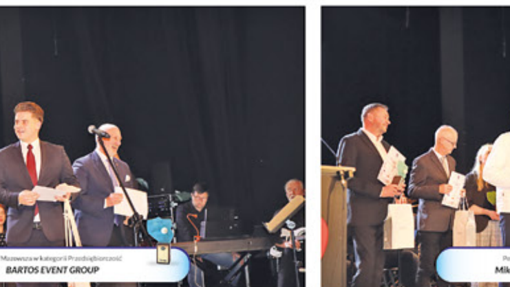
Perła Mazowsza w kategorii: Przedsiębiorczość BARTOS EVENT GROUP