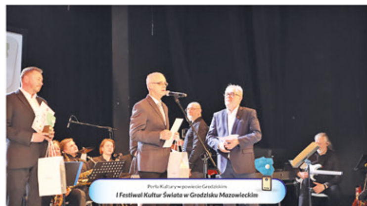
Perła Kultury w powiecie Grodzkim I Festiwal Kultur Świata w Grodzisku Mazowieckim