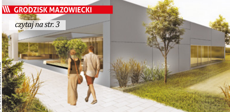
Tak po modernizacji ma wyglądać grodziski Pawilon Kultury