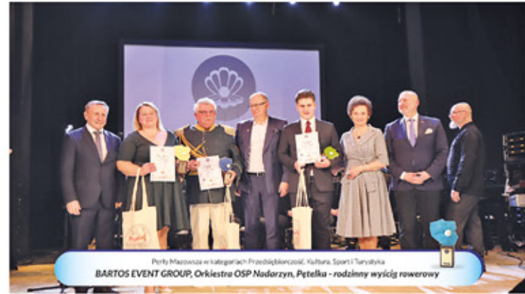
Perła Mazowsza w kategoriach: Przedsiębiorczość, Kultura, Sport i Turystyka BARTOS EVENT GROUP, Orkiestra OSP Nadarzyn, Pętella - rodzinny wyścig rowerowy

Organizatorzy konkursu przygotowali nagrody dla zwycięzców, dla osób zgłaszających swoje „perły” oraz biorących udział w głosowaniu.