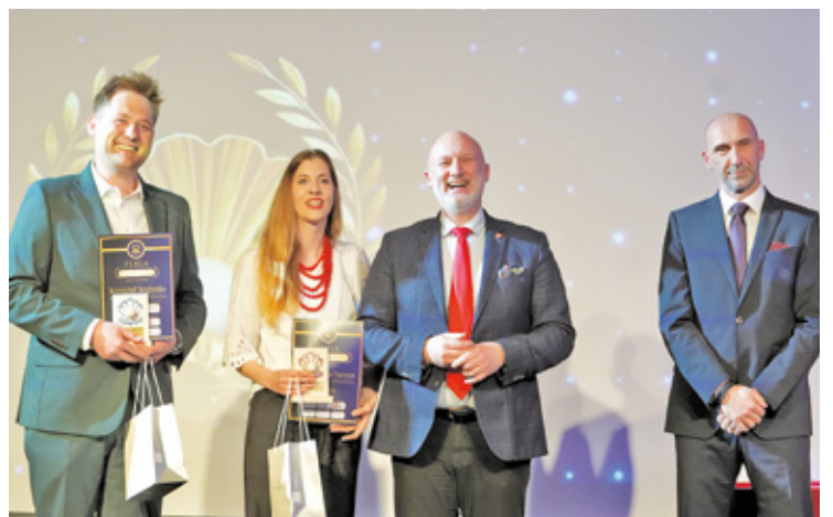
Gala finałowa odbędzie się 29 kwietnia w Gminnym Ośrodku Kultury i Sportu w Tarczynie

W śród (8 kwietnia) w Mediatece w Grodzisku Mazowieckim odbyła się uroczysta gala finałowa X edycji plebiscytu „Perły Mazowsza”. Inicjatywa ta na stałe wpisała się już w kalendarz wydarzeń Mazowsza.