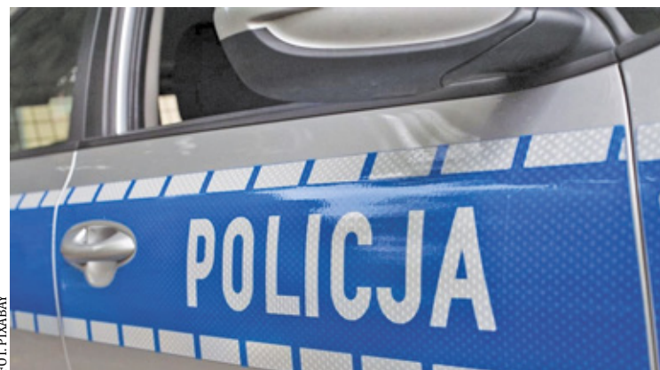
Nie zawsze chodzi o patrolowanie ulic i reagowanie na wykroczenia. Często funkcjonariusze stają się pierwszym ogniwem ratunkowym

- Policjanci bez wahania przystąpili do resuscytacji krążeniowo-oddechowej i prowadzili ją aż do czasu przybycia ratowników medycznych.