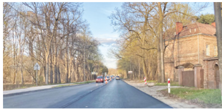
Układanie warstwy ścieralnej na ul. Królewskiej w Milanówku to kluczowy etap remontu drogi 719

Wznowienie prac było możliwe dopiero na początku marca, gdy – jak