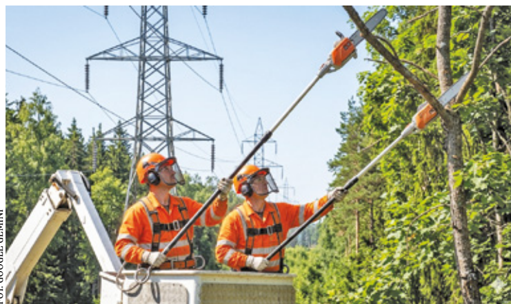
Wycinka drzew i pielęgnacja gałęzi przy liniach wysokiego napięcia prowadzona przez PGE Dystrybucja w celu zapobiegania awariom prądu

- Jeśli taka sytuacja dotyczy Twojej nieruchomości, warto wyrazić zgodę. Dzięki temu zmniejszamy ryzyko awarii, unikamy przerw w dostawie prądu oraz dbamy o bezpieczeństwo swoje i sąsiadów – apelują przedstawiciele Gminy Michałowice. Zrozumienie wagi tych działań jest kluczowe, ponieważ brak zgody jednego mieszkańca może