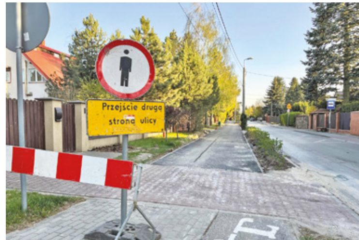
Ulice Podhalańska i Irena są całkowicie zamknięte dla ruchu

Zgodnie z oficjalnymi komunikatami, nowy objazd dla transportu publicznego został wyznaczony ulicą Pęcicka oraz Aleją Kasztanową. Wybór ten nie był przypadkowy – zanim ustalono ostateczny wariant, służby odpowiedzialne za transport przeprowadziły dokładne analizy w terenie.