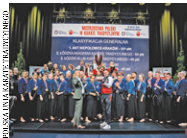
POLSKA UNIA KARATE TRADYCYJNEGO

Ponad 700 zawodników i dwa dni intensywnej rywalizacji – tak wyglądały Mistrzostwa Polski w Karate Tradycyjnym 2026. Grodzisk Mazowiecki na chwilę stał się prawdziwym centrum tej dyscypliny sportu.