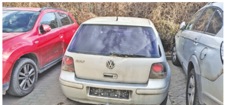
Zniszczony samochód, pozbawiony tablic rejestracyjnych, zajmuje miejsce parkingowe przy ul. Żyrardowskiej

Z prośbą o interwencję w tej sprawie zwrócił się do naszej redakcji jeden z Czytelników.