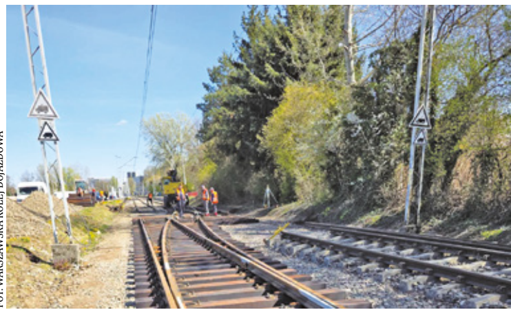
Zakończył się ważny etap prac na odcinku Warszawa Aleje Jerolimskie – Warszawa Śródmieście WKD

W razie ograniczeń ruchu możliwe będą kursy wahadłowe do Warszawy