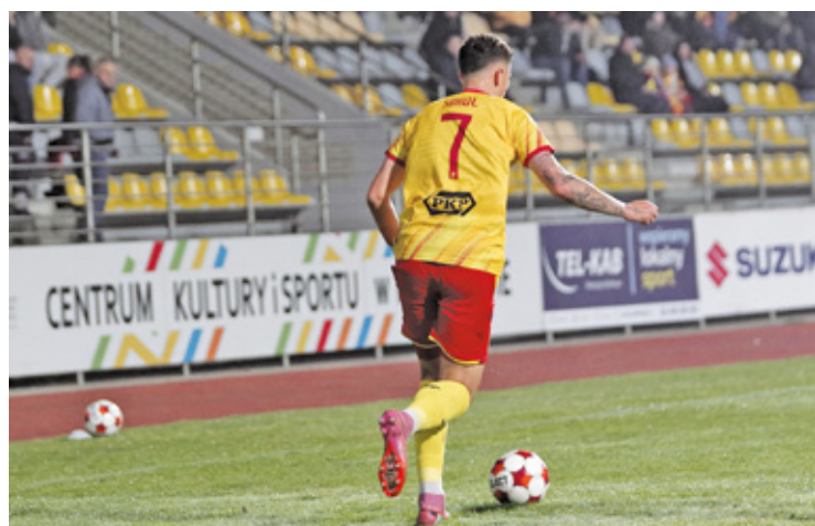
Fatalna sytuacja Znicza Pruszków w ligowej tabeli