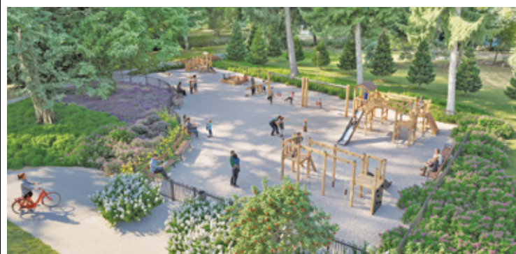
Wizualizacja nowoczesnego placu zabaw i pomostu nad stawem

Projekt zagospodarowania terenu stawia na różnorodność nawierzchni, które mają wprowadzić ład i harmonię przestrzenną. Oprócz ścieżek mineralnych z obrzeżem z kostki granitowej, pojawiają się utwardzenia drewniane wykonane z termojesionu. „Utwardzenia zaplanowane w parku wiejskim zakładają spójny charakter i mają za zadanie wprowadzić ład i harmonię