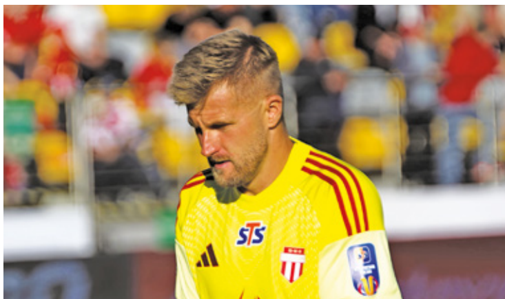
Pogoń w przyszłym sezonie dalej będzie grała w Betclie 1. Lidze

Pogoń wypuściła punkt w doliczonym czasie meczu. W odstępie dwóch minut Odra strzeliła dwa gole. Najpierw