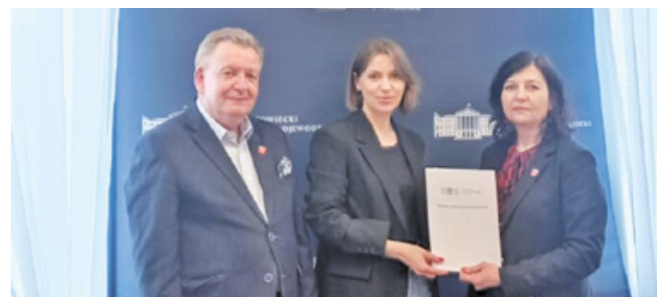
Podpisanie umowy na dofinansowanie przebudowy drogi gminnej w miejscowości Żaby