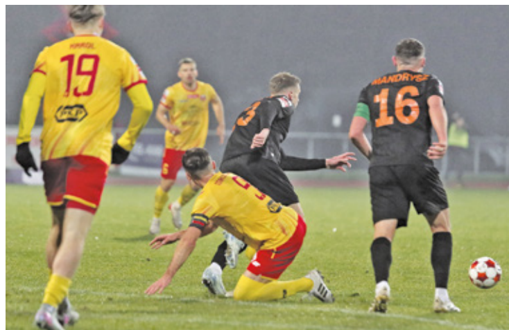
To był emocjonujący mecz, ale miał dla pruszkowian przykry koniec

– Z pewnością bardzo emocjonujące, wyrównane spotkanie, w którym strzeliliśmy dwie bramki. Myślę, że