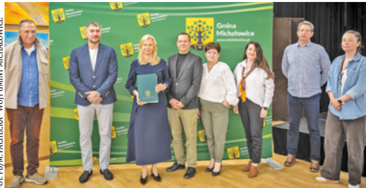
Zabytkowa Zielona Willa Grabowskich w Komorowie przejdzie gruntowny remont konserwatorski

Całkowity koszt zakupu budynku wraz z przylegającą działką wyniósł 2 miliony złotych. Co kluczowe dla budżetu samorządu, wydatek ten nie ob-