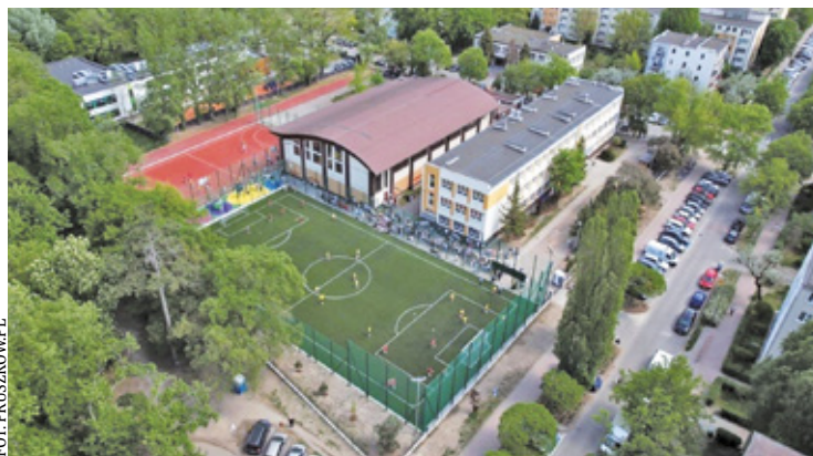
Teraz kompleks sportowy przy Szkole Podstawowej nr 4 prezentuje się bardzo okazale

Uczniowie Szkoły Podstawowej nr 4 im. Jana Pawła II w Pruszkowie mają powody do dumy, a mieszkańcy zyskali nowoczesną przestrzeń do rekreacji. Zakończona właśnie przebudowa obiektów sportowych przy ulicy Hubala to jedna z najważniejszych inwestycji edukacyjno-sportowych w tej części miasta.