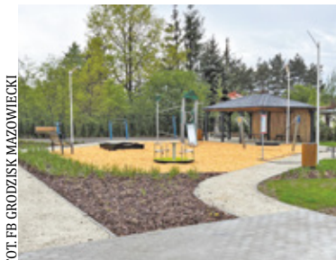
Plac zabaw w Chrzanowie Dużym

W obu miejscowościach powstały place zabaw połączone ze strefami rekreacji, których oficjalne otwarcie zaplanowano na 31 maja.