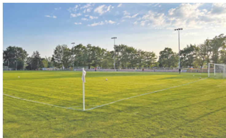
Gmina Raszyn zyska nowoczesne boisko piłkarskie przy ul. Sportowej. Wójt odebrała ponad 4,4 mln zł dofinansowania z Ministerstwa Sportu i Turystyki

W ramach prac powstanie również profesjonalne oświetlenie boiska oraz nowe trybuny dla kibiców. Dzięki temu stadion ma stać się bardziej funkcjonalnym miejscem zarówno dla zawodników, jak i mieszkańców oglądających lokalne rozgrywki.