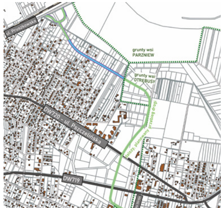
Budowa nowej drogi gminnej w Brwinowie połączy ulicę Pruszkowską z ulicą Pszczelińską i ułatwi wyjazd z bocznych uliczek - zaznaczony na niebiesko odcinek jest pierwszym etapem i powstanie jeszcze w tym roku

W odpowiedzi na te zarzuty przedstawiciele Brwinowa tłumaczą, że budowa drogi gminnej leży w zasięgu możliwości prawnych i finansowych samorządu, natomiast nowy tunel samochodowy to inwestycja o zupełnie innej skali kosztów, zależna od terenów kolejowych i decyzji leżą-