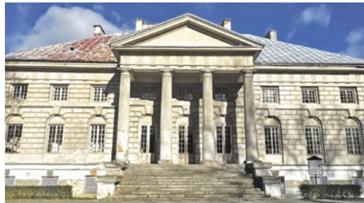
Pałac w Młochowie

Pałac w Młochowie należy do rozpoznawalnych zabytków tej części Mazowsza. Prace przy takim obiekcie mają znaczenie nie tylko dla zachowania samego budynku, ale też dla całego historycznego założenia, które jest ważnym elementem lokalnego krajobrazu.