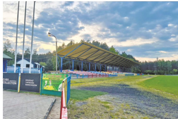
Nowoczesne, pełnowymiarowe boisko piłkarskie ze sztuczną murawą i oświetleniem powstanie na terenie stadionu GOS w Nadarzynie dzięki dotacji celowej

W Nadarzynie zaplanowano pierwszy etap kompleksowej modernizacji stadionu Gminnego Ośrodka Sportu. Najważniejszym elementem inwestycji będzie budowa pełnowymiarowego boiska piłkarskiego o wymiarach 100 na 65 metrów. Obiekt otrzyma nowoczesną sztuczną nawierzchnię, która ma umożliwić treningi przez większą część roku, także w trudniejszych warunkach pogodowych.