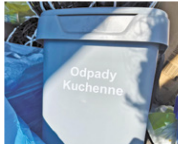
Już w pierwsze wyznaczone dni odbioru wzdłuż ulic pojawiły się rzędy wystawionych pojemników

„Gmina Brwinów podjęła to działanie nie tylko ze względu na starania o uniknięcie kar za zbyt mały odsetek segregacji. Choć argument finansowy też jest bardzo ważny, to jednak w szerszej perspektywie musimy myśleć o ochronie przyrody i świecie, jaki po sobie pozostawimy” – podkreśla zastępca bur-