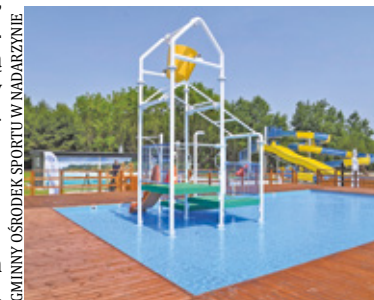
GMINNY OŚRODEK SPORTU W NADARZYNIE

Z preferencyjnych stawek skorzystają także rodziny. Bilet rodzinny w modelu 2+3 z Ogólnopolską Kartą Dużej Rodziny kosztuje 80 zł, natomiast w połączeniu z Kartą Nadarzyniaka - 50 zł.