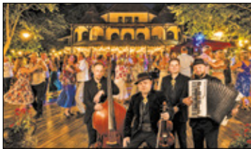
||| Podkowa Leśna - Potańcówka na dechach s. 2