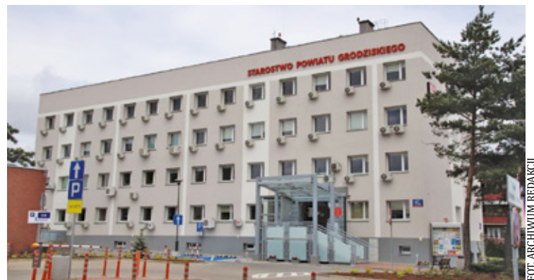
Interesanci nie kryją frustracji. Pan Wojciech, który zjawił się w urzędzie w poniedziałek przed południem, o 13:30 wciąż stał w kolejce bez pewności, czy w ogóle zostanie obsłużony