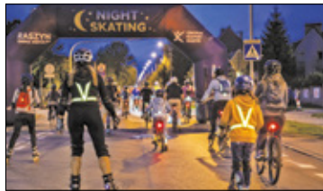
||| Raszyn - Miłośnicy rolek opanują miasto s. 7