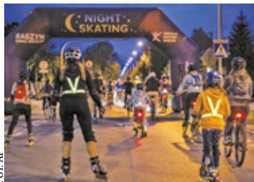
Trasa ma liczyć około 10 kilometrów

Uczestnicy spotkają się o godz. 19.40. Wtedy odbędzie się rozgrzewka i instruktaż. Wspólny przejazd ulicami gminy Raszyn rozpocznie się o godz. 20.00.