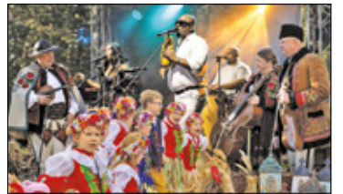
||| Grodzisk Mazowiecki - W kubańskich rytmach s. 7