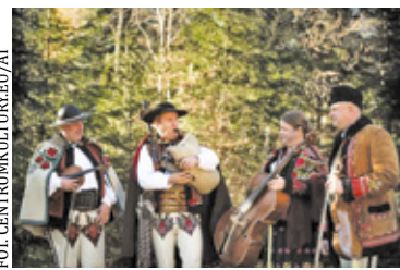
Jednym z głównych punktów programu będzie koncert zespołu Trebunie-Tutki