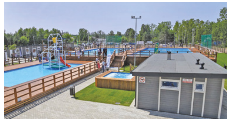
GMINNY OŚRODEK SPORTU W NADARZYNIE