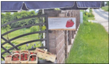
||| Nadarzyn - Nietypowe stoisko z truskawkami s. 2