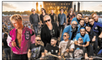
||| Nadarzyn - Skolim rozgrzeje stadion GOS s. 7