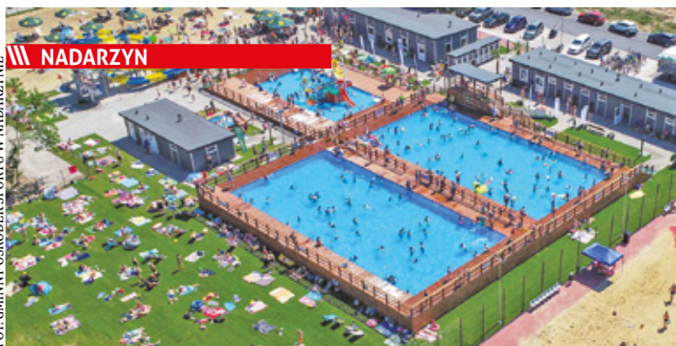
NADARZYN Za całonocny bilet normalny trzeba zapłacić 50 zł. Posiadacze Karty Nadarzyniaka mogą liczyć na niższe stawki

Startują baseny w Strzeniówce. Ile zapłacimy za bilety?