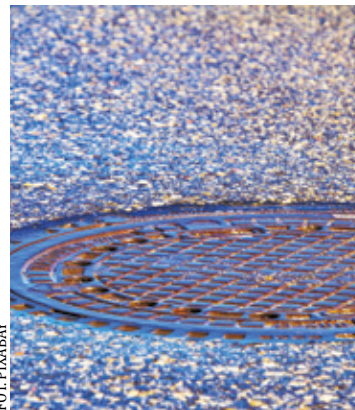
Budowa kanalizacji sanitarnej w ulicy Stanisława Moniuszki w Milanówku zakończy się najpóźniej w grudniu tego roku

Rejon planowanych robót znajduje się w strefie zespołu urbanistyczno-krajobrazowego, wpisanego do rejestru zabytków. Mazowiecki Wojewódzki Konserwator Zabytków wydał pozytywną opinię dla planowanych działań. Zgodnie z założeniami inwestycji, realizacja nie spowoduje wycinki drzew. Wykonawca został zobowiąza-