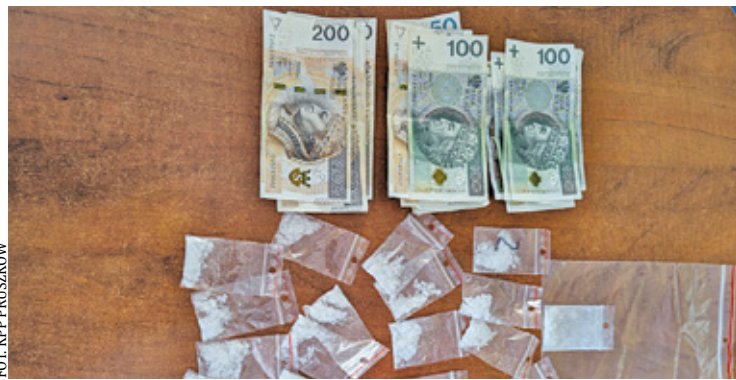
Mężczyzna przyznał się do popełnienia zarzucanego mu czynu

Jak informuje podkom. Monika Orlik, wśród zabezpieczonych substancji znalazły się amfetamina, mefedron oraz marihuana. Policjanci zabezpieczyli także gotówkę na poczet przyszłych kar i środków o charakterze majątkowym.