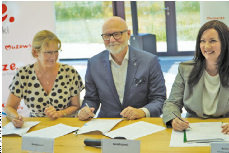
Modernizacja usprawni komunikację pomiędzy sołectwami Krosna i Moszna

Zakres zadania obejmuje rozbudowę ul. Gwiaździstej na całej jej długości,