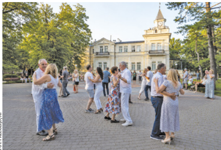
To świetna okazja, by spotkać się ze znajomymi i dobrze się bawić

Tegoroczny cykl rozpocznie się o godz. 19:00 i potrwa do 21:00. Park wy-