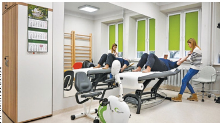
Seniorzy mogą zadbać o zdrowie

Dzienny Dom Senior+ stworzony został z myślą o osobach 60+, które są nieaktywne zawodowo i mieszkają na terenie powiatu pruszkowskiego. Placówka funkcjonuje przez pięć dni w tygodniu od 8.00 do 16.00. – Dzienny Dom „Senior+” w Pruszkowie to miejsce, gdzie wszyscy czują się jak u siebie. Dokładamy wszelkich starań, aby w naszej placówce stworzyć przyjazną atmosferę opartą na wzajemnej życzliwości, wsparciu oraz zaufaniu. Nasz dom jest miejscem, w którym dbamy o to, by osoby starsze spędzały miło