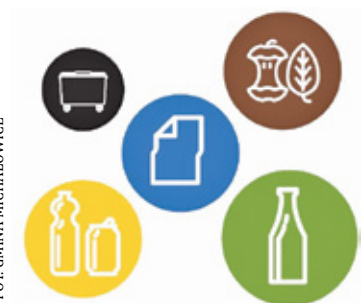
Czerwony kolor? Pojemnik do wymiany

M ieszkańcy zerkają w harmonogram, przygotowują kosze, wystawiają, a firma je odbiera. Wszystko odbywa się zgodnie z zasadami segregacji. Wiadomo, że śmietniki mają swoją trwałość. W ostatnim czasie MZO Pruszków przeprowadziło inwentaryzację pojemników na odpady zmieszane na terenie gminy Michałowice. Na czerwono oznaczono te, których stan jest zły i trzeba dokonać wymiany.