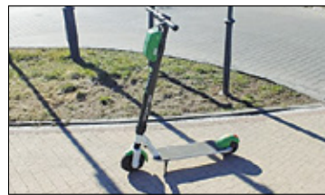
||| Pruszków - Hulajnogi w Pruszkowie s. 5