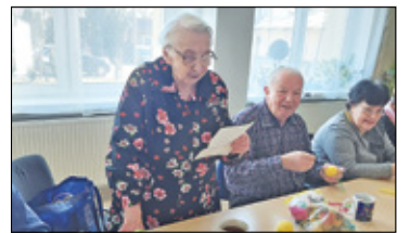
||| Grodzisk Mazowiecki - Zabłotnia - wieś seniorów s. 6