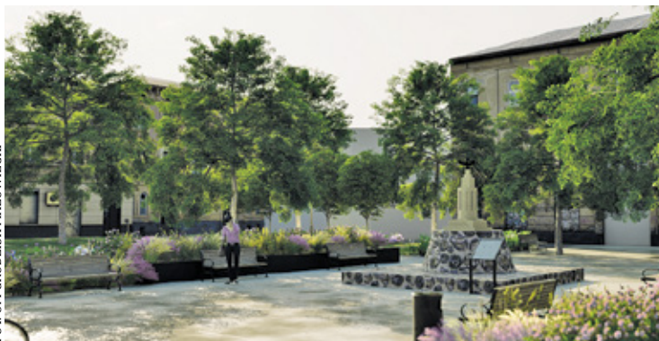
Wizualizacja rewitalizowanego Placu Wolności

W parku powstającym na placu Wolności dosadzonych zostanie pięć drzew, dziewięć tysięcy roślin cebulowych, półtora tysiąca krzewów oraz siedem tysięcy bylin. Rewitalizacja tego historycznie najstarszego placu w mieście, polega przede wszystkim na jego zazielenieniu. Mieszkańcy, którzy obawiali się zniszczenia podczas tej inwestycji rosnących tam drzew, mogą odetchnąć z ulgą. Drzewa, które rosły w miejscu, gdzie zaczęto budować fontannę czy nowe ścieżki, zostały już przesadzone. Podczas rewitalizacji tej przestrzeni dosadzone zostaną nowe