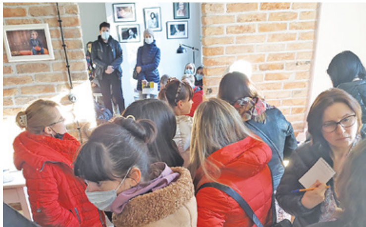
W domu przy Zaciszej 10, co czwartek mają odbywać się spotkania integracyjne dla Ukraińców, którzy znaleźli azyl w Milanówku