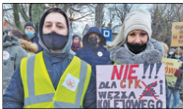
||| Jaktorów/Baranów - CPK potrzebuje rzeczoznawców s. 2