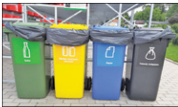
||| Michałowice - Pojemnik na odpady do wymiany s. 2