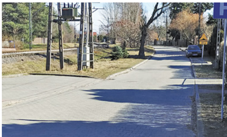
Fragment utworzony przy stacji WKD Malichy

Do petycji odniósł się prezydent Pruszkowa Paweł Makuch. Błękitna na odcinku od ul. Dolnej do wyznaczonych działek ma przebiegać w korytarzu wyznaczonym w obowiązujących miejscowym planie zagospodarowania przestrzennego. Ingerencja w działki