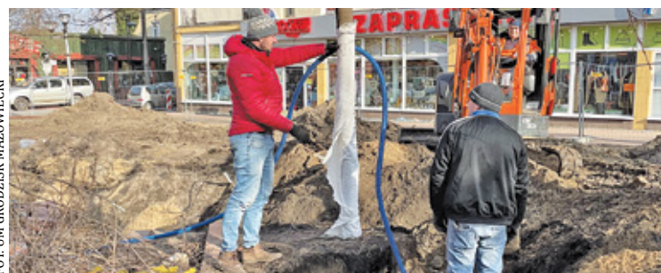
Trwają prace na Placu Wolności. Będzie zielono i atrakcyjnie