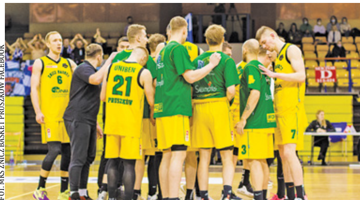
Znicz Basket – PGE Turów 94:95