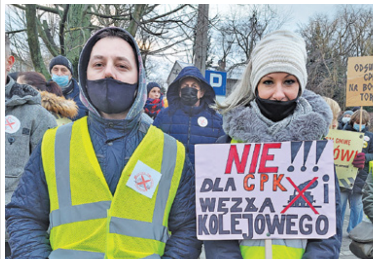
Mieszkańcy Jaktorowa protestują od początku lutego przeciw budowie w gminie potężnego węzła kolejowego

– Celem przetargu jest wyłonienie podmiotów, których zadaniem będzie kompleksowa obsługa obszaru Progra-