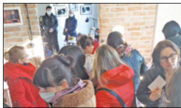
||| Milanówek - Spotkanie integracyjne dla uchodźców s. 4