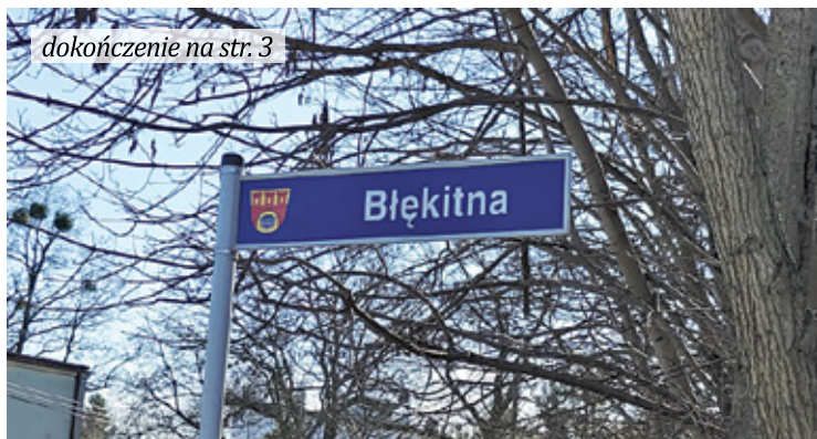
dokończenie na str. 3