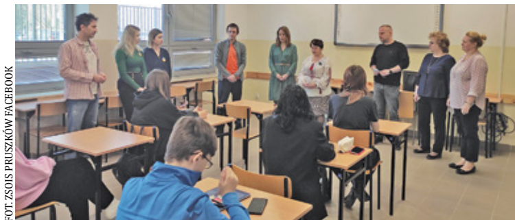
Młodzież z Ukrainy w ZSOiS w Pruszkowie

Powiat pruszkowski uruchomił klasy przygotowawcze dla młodzieży z Ukrainy. Nastolatki uczą się m.in. w pruszkowskim liceum im. T. Zana i piastowskim Technikum w Zespole Szkół im. F. Nansena.