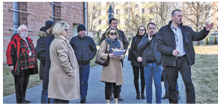
Wprowadzenie na plac budowy

O tym, że sprawa budowy basenu ma swoją historię najlepiej świadczy fakt, że ponad rok temu ogłoszono dofinansowanie na ten cel. Z Ministerstwa Sportu samorząd otrzymał wsparcie w wysokości ponad 10,6 miliona złotych. – Doskonale wiemy, że nie ma zdrowego i aktywnego społeczeństwa bez nowoczesnej i bezpiecznej infrastruktury sportowej, dlatego chciałabym serdecznie podziękować wszystkim osobom zaangażowanym w budowę pruszkowskiej pływalni. Cieszę się, że