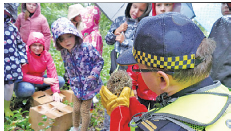
Dzieci z grodziska podczas akcji wypuszczania uratowanych jeży do naturalnego ich środowiska