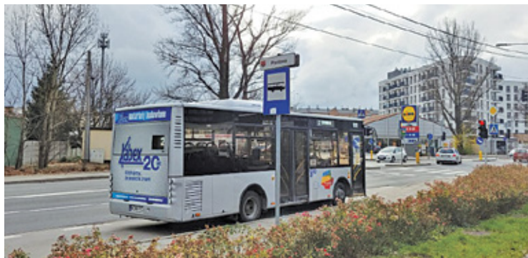
W zatoce pojawią się liczne udogodnienia

Zadanie dotyczy przebudowy drogi wojewódzkiej nr 719 w zakresie rozbudowy al. Wojska Polskiego oraz przebudowę nawierzchni drogi wewnętrznej znajdującej się przy al. Wojska Polskiego i ul. Plantowej. In-