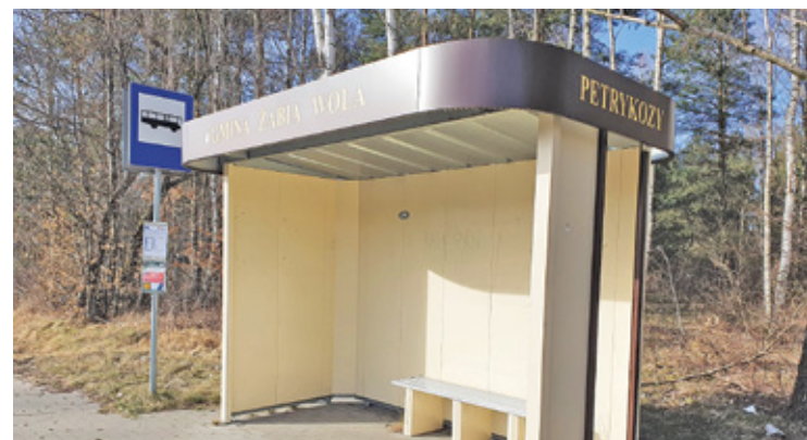
Harmonogram kursów znacznie odbiegał od rzeczywistości

– Prawda jest taka, że nie ja jestem adresatem tych skarg, tylko osoba odpowiedzialna ze strony Grodzkich Przewozów Autobusowych. Skarga jest wynikiem opozycyjnego wobec mnie