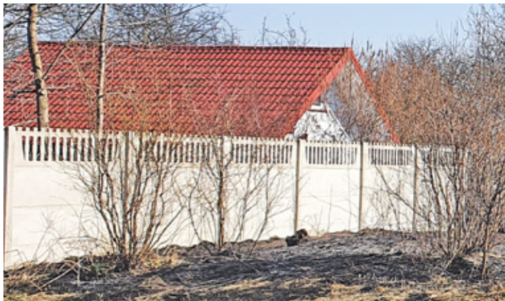
W Grzegorzewicach ogień dotarł do ogrodzenia posesji

Kampania społeczna Państwowej Straży Pożarnej „Stop Pożarom