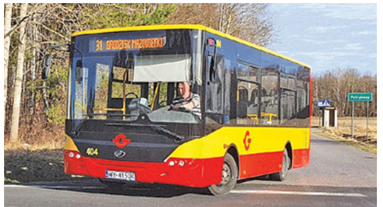
Autobus linii 31 łączący Petrykozy z Grodziskiem Mazowieckim