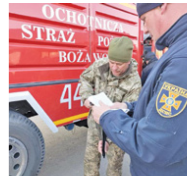
Na granicy Jelcz z OSP Boża Wola, został przekazany stronie ukraińskiej

Do strażaków wpłynęło takie podziękowanie z Ukrainy – 19 marca Rada