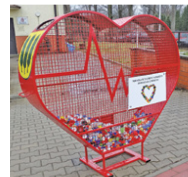
Serce stanęło przy OSP Młochów

Ostatnio na terenie gminy pojawiło się czwarte miejsce, gdzie można oddać nakrętke. Serce stanęło tym razem przy