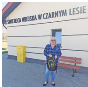
Sołtys jest dumna z wiejskiej świetlicy i tego co to miejsce daje mieszkańcom

Czynnikiem rozwojowym dla wsi było utworzenie Funduszu Sołeckiego przeznaczonego na rozwój wsi, z którego Czarny Las skorzystał jako jeden z pierwszych. Za pieniądze z tego funduszu mieszkańcy m.in. poznali tradycyjne techniki wypieku pierników sto-