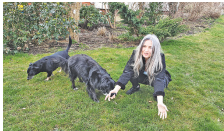
Adoptowane psy odwdzięczą się miłością

– W Musułach zmarł samotny starszy człowiek, a na jego podwórku było