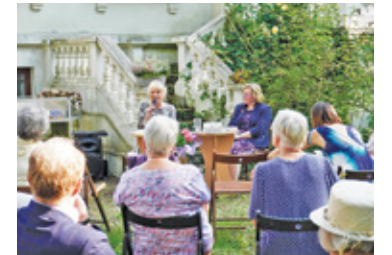
Podczas ubiegłorocznego FOO w jednym z ogrodów usłyszeliśmy o historii milanowskiego jedwabiu

Zgłoszenia do udziału w XVII Festiwalu Otwarte Ogrody organizator, czyli Milanowskie Centrum Kultury przyjmuje do 16 maja. Festiwal w Milanówku odbędzie się od 3 do 5 czerwca.