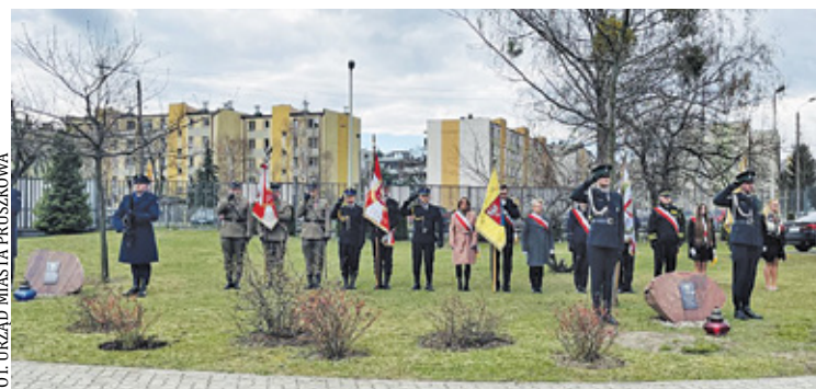
Uroczystości odbyły się przy ul. Gomulińskiego

W pruszkowskich uroczystościach wzięli udział przedstawiciele miasta, z prezydentem Pawłem Makuchem na czele oraz starosta pruszkowski Krzysztof Rymuza, radni powiatowi, a także poseł Zdzisław Szipera, przedstawiciele Światowego Związku Żołnierzy Armii Krajowej koło nr 6 w Pruszkowie, Stowarzyszenie Polskich Kombatantów