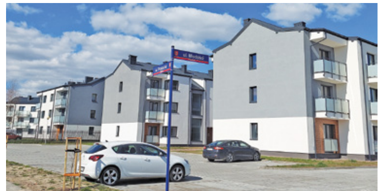
Książenice to do niedawna niewielka wioska, ale dziś rozwijająca się miejscowość. Tymczasem nie ma tu, gdzie nadać poleconego czy odebrać paczki

W odpowiedzi Poczty Polskiej na petycję mieszkańców czytamy: „Region Sieci Warszawa – Województwo podejmował szereg różnorodnych działań mających na celu wznowienie działalności Agencji Pocztovej Książenice, której działalność zawieszono w styczniu 2021 r. Skierowaliśmy między innymi w tej sprawie pismo do Urzędu Miasta w Grodzisku Mazowieckim z prośbą o umożliwienie umieszczenia nieodpłatnego ogłoszenia na stronie internetowej urzędu. Poszukujemy chętnych do poprowadzenia agencji za pośrednictwem lokalnego urzędu pocztowego oraz listonoszy. Niestety, działania te są bezskuteczne”.