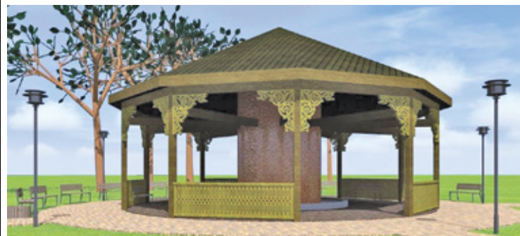
Tak wyglądać będzie tężnia w Parku Skarbków, otwarcie już w czerwcu

Co to jest tężnia solankowa? Drewniana budowla pokryta gałązkami tar-niny, pośrodku której znajduje się urządzenie do pompowania wody. Rozprowadza ono solankę po gałązkach roślin, w rezultacie czego powstaje aerozol