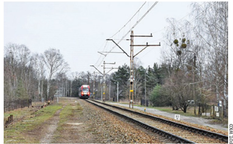
Druga linia WKD jest oczekiwana przez mieszkańców regionu, bo popularna „WuKaDka” jest lubiana z powodu punktualności i komfortu podróży

przygotowania do zawarcia umowy z wykonawcą – firmą INTOP Warszawa. Zakładając tym samym, że i ta kontrola potwierdzi wynik przetargu. Zawarcie umowy jest więc planowane jeszcze w kwietniu. Wykonawca będzie mieć