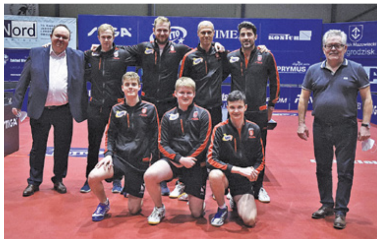
FOT. BOGORIA GRODZISK MAZOWIECKI

W ćwierćfinale Bogoria okazała się lepsza niż Sokołów S.A. Jarosław, z kolei ekipa z Gdańska zwyciężyła Energe-Manekin Toruń. Teraz obie drużyny spotkają się w walce o finał. Z pewnością emocji nie zabraknie.