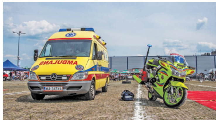
Dwa oblicza karetek