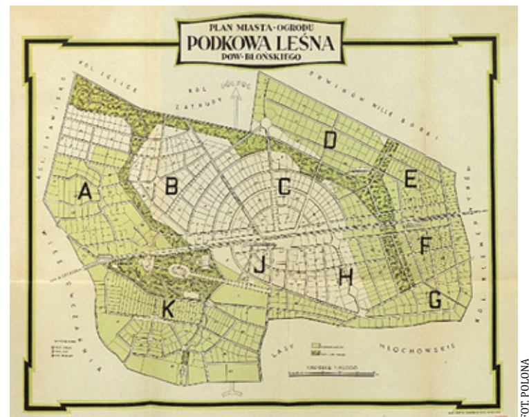
Plan Miasta Ogródu Podkowa Leśna powiatu Błońskiego

Kolejka, której punkt wyjściowy w Warszawie mieścił się w samym centrum (Nowogrodzka, róg Marszał-