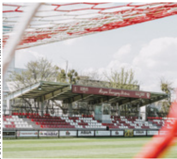
Pogoń – Olimpia 1:0

1 maja Pogoń rywalizowała na własnym terenie z Olimpią Elbląg. W