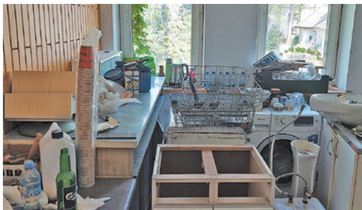
Dom stał dłuższy czas nieużywany i wymagał remontu, aby mógł stać się domem dla uchodźców

Na swojej stronie na Facebooku strażacy z OSP zapewniają mieszkań-