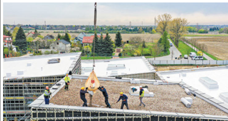
Prace na terenie budowy przedszkola

Na tym nie koniec. Przedszkole będzie miało wyjątkowy dach. – Na budowie przedszkola w Regułach rozpoczęło się wysypywanie 50 ton tłucznia, który na zielonym dachu odwróconym stanowi warstwę chroniącą hydroizolację przed uszkodzeniami mechanicz-