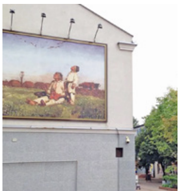
Obrazy Chełmońskiego będą wystawiane w tych samych miejscach, ale w nowoczesny sposób

Deptak, to ściśle centrum miasta. Zbudowany prawie 30 lat temu, domaga się już odnowienia. Władze miasta od dłuższego czasu planują jego rewitalizację. Plany ogłoszone w zeszłym roku były ambitne. Ale z ich realizacją miasto będzie jeszcze musiało poczekać. W związku z 500-leciem Grodziska deptak będzie odświeżony.