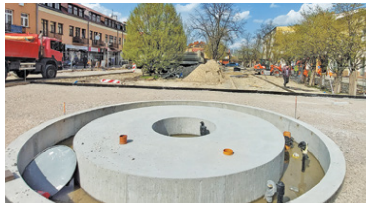
Na placu Wolności powstaje właśnie fontanna

Już za miesiąc mieszkańcy będą mogli podziwiać nową Grodziską Galerię Uliczną. Będzie można w niej zobaczyć, znane dobrze mieszkańcom z dotychczasowej ekspozycji na elewacjach kamienic, obrazy mistrza z Adamowizny. Teraz jednak będą prezentowane w nowych i podświetlanych kasetonach. Zobaczymy znane i kochane przez mieszkańców „Bociany” (1900 r.) czy „Babie lato” (1875 r.), w nowej odsłonie, choć w tych samych co do tej pory miejscach.