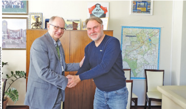
Podpisanie umowy na przeprowadzenie badań

Gmina Nadarzyn podpisała umowę na przeprowadzenie badań profilaktycznych w celu identyfikacji dzieci narażonych na występowanie wad postawy. Za zgodą rodziców, z tej możliwości będą mogli skorzystać uczniowie klas I-VIII. – Rodzice ucznia otrzymają wydruk badania opisany przez specjalistę wraz z ewentualnymi zaleceniami. Diagnostyka zostanie zrealizowana wg ustalonego z dyrekcjami szkół harmonogramu – do końca bieżącego roku szkolnego, a wyniki i zalecenia będą do odbioru w placówkach we wrześniu. W programie weźmie udział ponad 1000