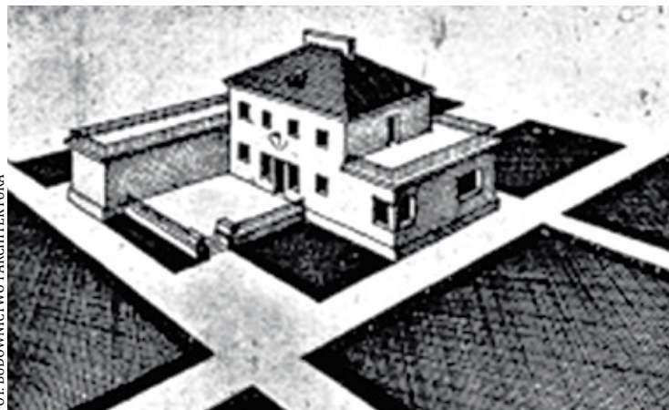
Druaga część projektu domu arch. J. Dąbrowskiego dla Podkowy Leśnej

wszystko to ustawione w odpowiednim porządku urbanistycznym. Tak