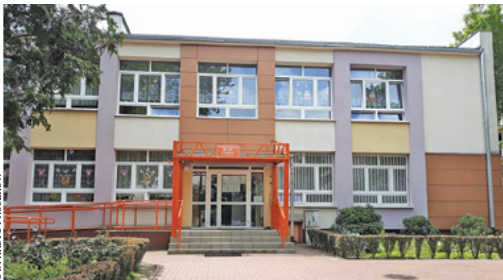
Przedszkole nr 12

W ramach modernizacji placówki zmiany przejdą dwie sale dydaktyczne, które służą grupom Myszki i Motylki. Planowany jest remont jednej z łazienek oraz holu na piętrze. Z kolei w całym budynku zostanie wymieniona instalacja centralnego ogrzewania. Prace obejmą również malowanie klatki schodowej, remont szatni na parterze, naprawę schodów zewnętrznych oraz ogrodzenia.