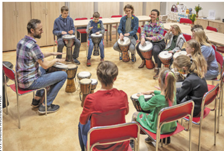
Warsztaty gry na djembe – jeden ze zwycięskich projektów I edycji BO

4 maja rozpoczęła się procedura zgłaszania projektów. Każdy mieszkaniec może przesłać swój pomysł i współdecydować o kształcie oraz zmianach na obszarze gminy. Co istotne, jedna osoba może zgłosić bądź poprzeć dowolną liczbę projektów. Warto zaznaczyć, że przedsięwzięcie nie musi posiadać jednego autora, lecz być koncepcją większej liczby osób. W BO aktywność mogą wykazać również małośni. Należy jednak pamiętać, że w imieniu takiej osoby, zgłoszenia dokonuje rodzic lub opiekun prawny.