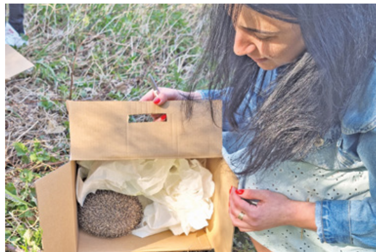
Dwanaście jeży uratowanych przez Fundację Primum/Jeżurkowo trafiło do swojego nowego domu w starym sadzie

W Grodzisku występują jeże wschodnie i zachodnie – tych drugich jest więcej, a można je rozpoznać m.in. po ciemniejszym zabarwieniu i gęstszej