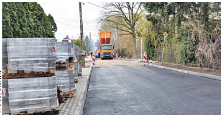
Kępińska stanowi ważną rolę komunikacyjną, ponieważ łączy ul. Wilsona oraz drogę wojewódzką 719

Inwestycje w infrastrukturę drogową mają istotne znaczenie dla mieszkańców, kierowców, a także pieszych i rowerzystów. Komfort przejeżdżania się po nowej nawierzchni jest zupełnie inny niż po ulicy pełnej ubytków i dziur. Zmiany szykują się na ul. Grudowskiej w Brwinowie. Dro-