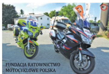
FUNDACJA RATOWNICTWO MOTOCYKLOWE POLSKA

Dlaczego obecność motoambulansów jest taka ważna? Odpowiedź jest prosta, to najszybszy sposób dotarcia