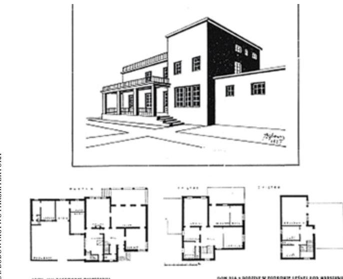
Projekt domu dla Podkowy Leśnej arch. J. Dąbrowskiego