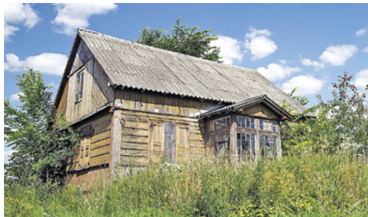
Eternit stanowi zagrożenie dla ludzi

Wystarczy złożyć wniosek do gminy. Właściciele prywatnych nieruchomości z terenu Podkowie Leśnej mogą ubiegać się o bezgotówkowe sfinansowanie tych działań. W ramach akcji, ratusz zapewnia bezpłatny odbiór i utylizację odpowiednio zabezpieczonych