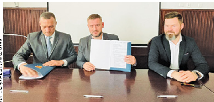
Termin realizacji inwestycji to 18 miesięcy od podpisania umowy

ul. 3 Maja do ul. Mostowej. Drugi element to ul. Elektryczna, która zostanie wykonana od ul. Nowożytnierskiej do ul. Batalionów Chłopskich. Inwestycja obejmuje budowę jezdni, chodników, ścieżek rowerowych i kanalizacji deszczowej.