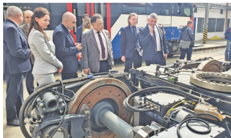
Z ciekawością oglądano prace w hali remontowo-naprawczej