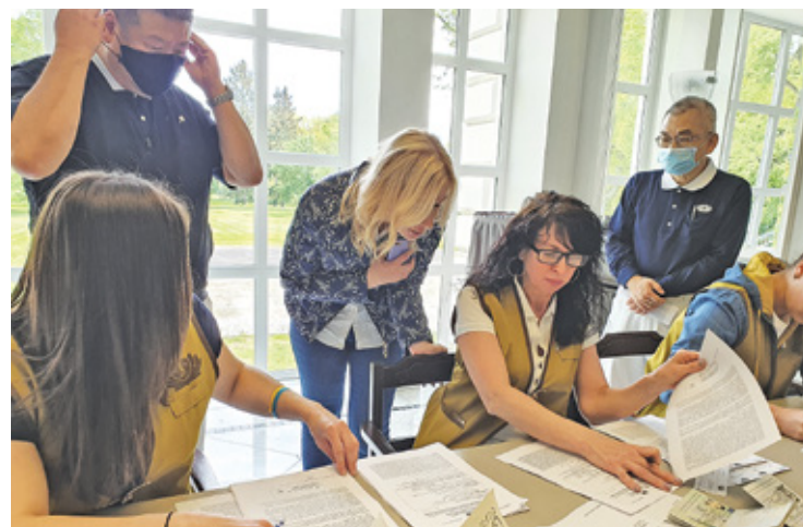
Wolontariuszki z Frontu Pomocy Ukrainie podczas rejestrowania zgłoszeń