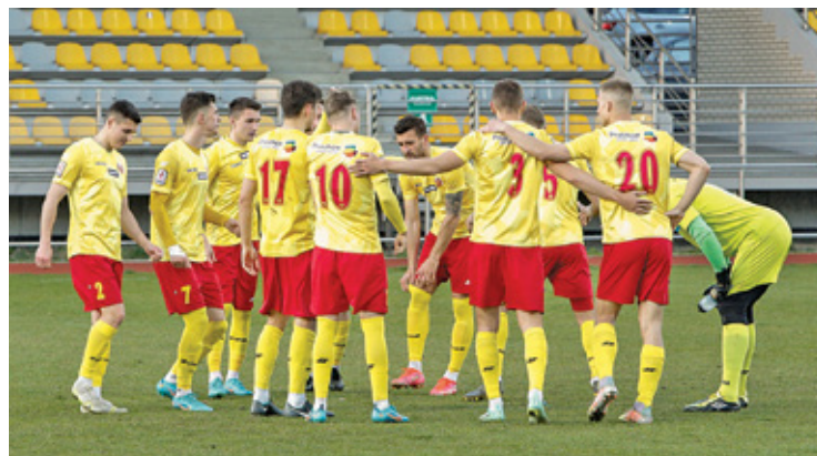
Znicz zajął 14. miejsce w lidze

Już wcześniej wiadomo było, że Pogoń Grodzisk Mazowiecki żegna się