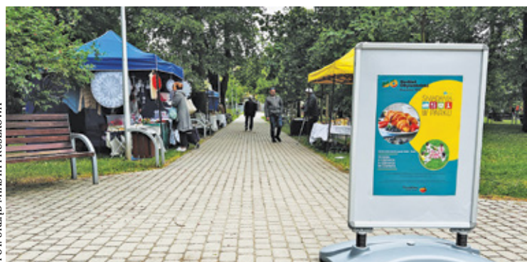
Kolejne śniadanie 4 czerwca

Projekt „Śniadania w Parku” ma charakter integracyjny. Jest realizowany w ramach budżetu obywatelskiego. W spotkaniach uczestniczą mieszkańcy Pruszkowa. Oferta śniadań jest ciekawa