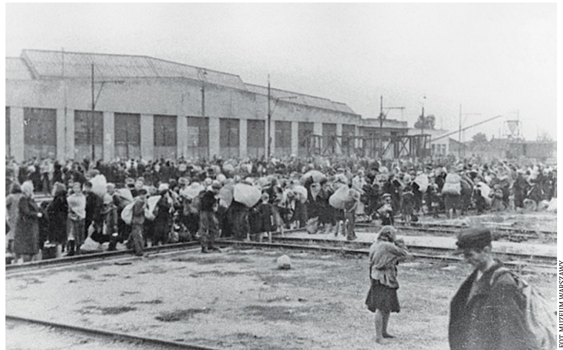
Kolumna wypędzonych Warszawiaków po przybyciu na teren obozu Dulag 121. W tle największa z obozowych hal

ne z blachy. Wiem, że mnie jako dziecku przypadało w udziale, że dziecku trzeba dać, dziecko chore. Spotkałyśmy znów doktora Konarskiego i jeszcze dwóch lekarzy znajomych, którzy zasiadali