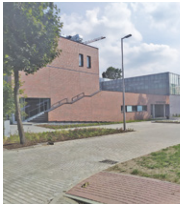
Ciekawa inicjatywa w piastowskim liceum. Start ma nastąpić 1 września

Podczas ostatniej sesji, radni Piastowa zajęli się sprawą utworzenia oddziału międzynarodowego w Liceum Ogólnokształcącym z Oddziałami Dwujęzycznymi im. Adama Mickiewicza. Miałyby on rozpocząć funkcjonowanie od 1 września 2022 roku.