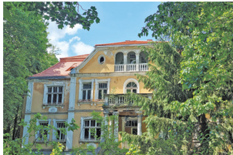
Miasto kupiło willę od spadkobierców, wraz z kolekcją rzeźb w 2006 roku

Konserwator po zapoznaniu się ze stanem budynku, początkowo postulował wykonanie równoległej do istniejącej więźby konstrukcji podtrzymującej dach. Okazało się to jednak być niewykonalne, ponieważ prowadziło do istotnych zmian kształtu dachu, a w szczególności kątów załamania mansard. Ostatecznie podjęto decyzję o wykonaniu nowej więźby dachowej, wspartej na specjalnie w tym celu roz-