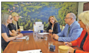
||| Nadarzyn - Rusza budowa Główniej s. 2