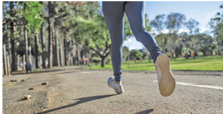
Uczestnictwo w biegu jest bezpłatne

19 czerwca w Pruszkowie odbędzie się bieg w ramach VI BO. Terenem rywalizacji będzie stadion Znicza.