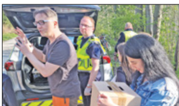
||| Grodzisk Mazowiecki - Więcej zieleni i zdrowia s. 10