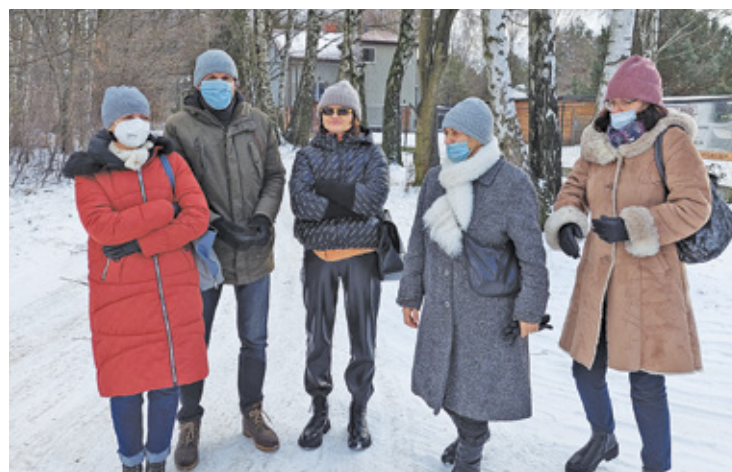
Współwłaściciele drogi oczekujący na podpisanie pierwszych porozumień z miastem w styczniu tego roku