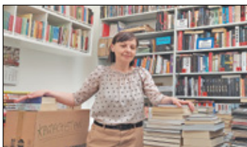
||| Milanówek - Powstanie nowa biblioteka s. 4