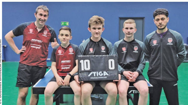
Bogoria pokonała Return 10:0