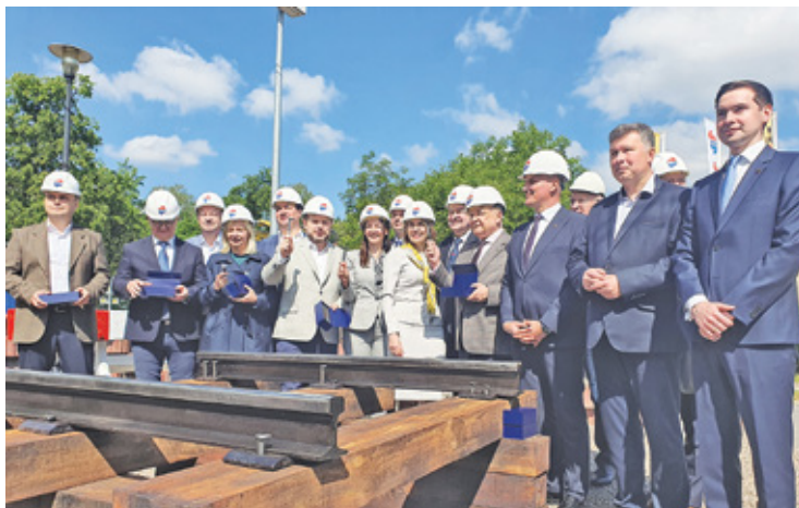
Na uroczystości byli przedstawiciele władz samorządowych i wszystkich podmiotów związanych z inwestycją