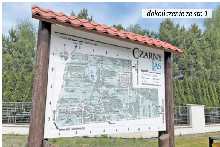
dokończenie ze str. 1

Udało się nam też ustalić, że w powiecie jest więcej niż dwadzieścia masztów. Dokładnie ile, to trudno powiedzieć, bo maszty buduje się od lat 90. XX wieku i urząd nie ma ich na jed-