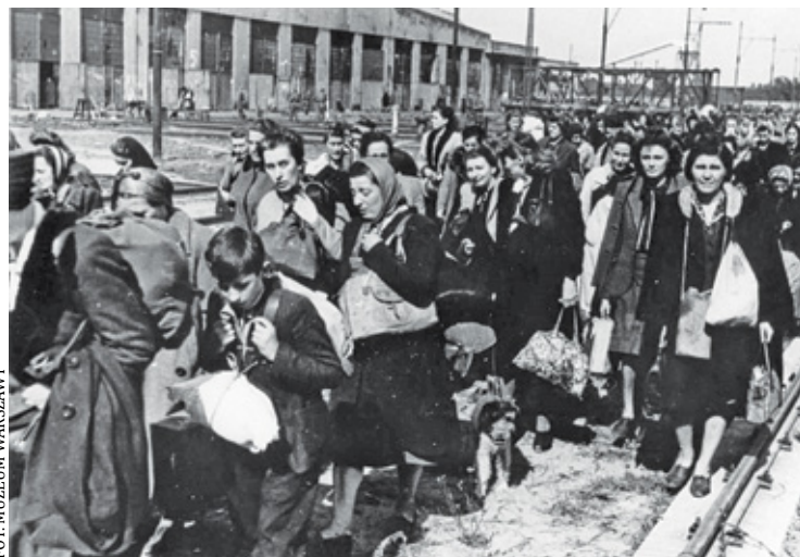
Nieraz w obozie jednocześnie było 15 tysięcy ludzi, w tym ludzie chorzy, starzy, dzieci, niemowlęta, kobiety w ciąży

Potem Dulag 121, Pruszków, rampy kolejowe. Tłum ludzi: chorzy, ranni, dzieci, właściwie wszyscy. Pomoc – nie wiem – organizacja RGO, bo wiem, że kocioł był, gorąca kawa czy gorący ukrop, czy gorąca zupa, menażki robio-