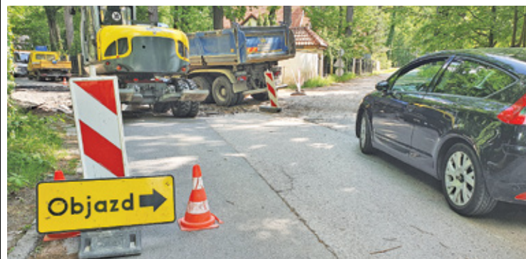
Czasowa zmiana organizacji ruchu na ul. Kwiatowej

– W tym miejscu zaprojektowane zostało wyniesione mini rondo o