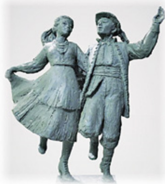
Projekt rzeźby Tańczących Mazowszaków

ustawienie na niewielkim placu obok ronda, w sąsiedztwie szkoły, naturalnej wielkości rzeźby plenerowej z brązu, przedstawiającej parę tancerzy w strojach ludowych. – mówi autor projektu.