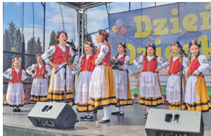
Dzieci Zespół Pieśni i Tańca działający przy CKR