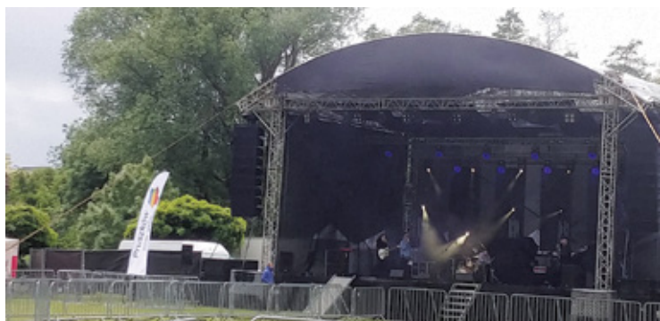
Przygotowania do koncertu

Lady Pank. Z kolei w niedzielę na scenie pojawiła się Orkiestra Dęta Pruszkowianka, ZTL Pruszkowiaczy oraz Waldemar Malicki i Soliści Filharmonii Dowcipu. Finał Dni Pruszkowa to występ znakomitego Raya Wilsona, który zaprezentował wiązankę klasyków