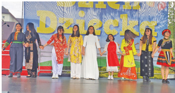
Impreza miała międzynarodowy i wielokulturowy charakter

– Dzieli nas odległość, system polityczny i gospodarczy, jednak łączy nas troska o dzieci – mogliśmy usłyszeć podczas prezentacji gości. Tym zdaniem wójt Raszyna w piękny sposób podsumował znaczenie tej imprezy.