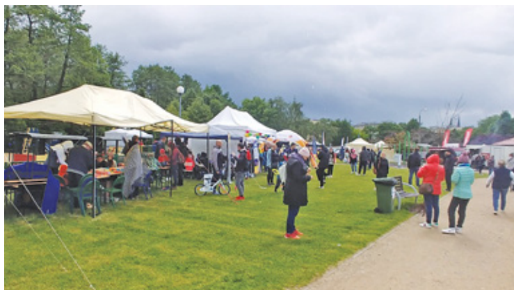
Mieszkańcy odwiedzający stoiska