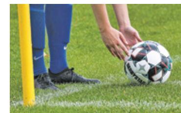
Chlebnia pokonała Podolszyn 5:0

W 27. kolejce Chlebnia rozbiła GLKS Podolszyn 5:0. LKS ma najlepszą ofensywę w lidze. Dotychczas Chlebnia zdobyła 105 bramek. Druga pod tym względem jest Laura Chylice – 96. Warto dodać, że LKS ma również najlepszą defensywę w lidze. Zespół stracił tylko 22 gole.