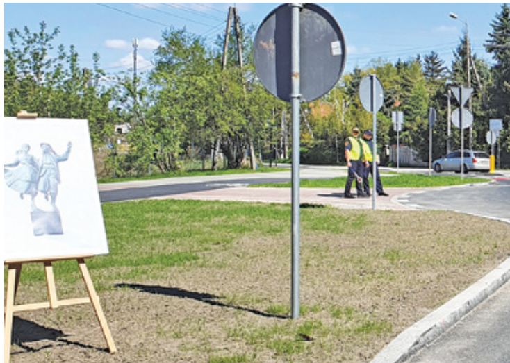
Ten fragment ulicy może zyskać nowe oblicze

– Złożyłem wniosek do Budżetu Obywatelskiego Mazowsza na 2023 rok, proponując realizację projektu „Roztańczone rondo”, polegającego na zagospodarowaniu zieleni w sąsiedztwie Ronda Zespołu Mazowsze. W projekcie uwzględniłem nasadzenie drzew, krzewów, bylin, traw oraz