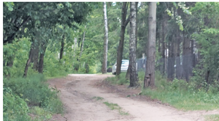
Czy z powodu oporu jednego z 50 współwłaścicieli może tu nie powstać droga z prawdziwego zdarzenia?

24 i 26 maja w UM miała stawić się i złożyć swoje podpisy w obecności notariusza, ponad połowa z 50 współwłaścicieli drogi łączącej ulice Łąkową i Średnią. Niestety jeden z właścicieli, który tak jak i inni, początkowo wyraził zgodę na przekazanie swojego udziału