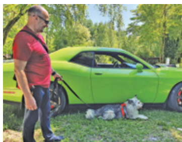
Flora, czyli pies, któremu mało kto dawał szansę, błyszczała na tle sportowego Dodge'a

Położona pośród lasów, między Grodziskiem Mazowieckim a Żabią Wolą, malownicza Osada Firleje w niedzielne popołudnie wypełniła się ludźmi, którym bliski jest los porzuconych zwierząt. Wszystko to za sprawą niedużego, ale za to prężnie działającego Stowarzyszenia Bezdomniaki Żabiowskie.