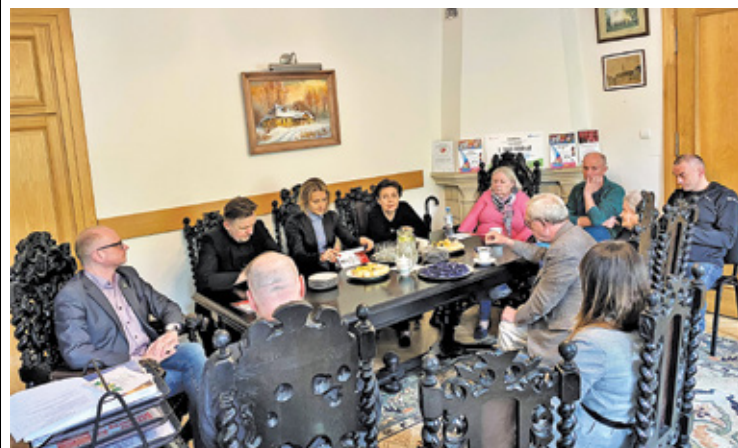
Robocze spotkanie, podczas którego podjęto decyzję o stworzeniu w Milanówku Izby Pamięci Żołnierzy Armii Krajowej

Na pewno znajdą się w niej dokumenty: kenkarty, opaski, rozkazy, mapy, części mundurów. Co jeszcze? Zobaczymy co ofiarują mieszkańcy, a do nich