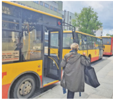
GPA zyska 10 nowych autobusów

GPA to pierwsza organizacja w województwie mazowieckim, która