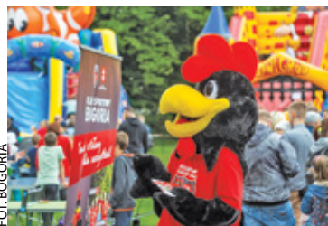
Kurczak, maskotka KS Bogoria Grodzisk Mazowiecki, będzie szedł na czele sportowców