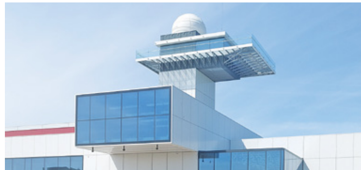
I i II piętro nowej grodziskiej hali sportowej zostaną wykończone dzięki środkom z Polskiego Ładu

Gmina Grodzisk Mazowiecki uzyskała 9,7 mln zł na wykończenie Hali