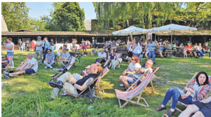
Relaks przy dźwiękach dobrej muzyki

Można było również wesprzeć Bezdomniaki, zostawiając pieniądze na pozostałych stoiskach, gdzie było dosłownie wszystko: biżuteria, książki, ubrania, sadzonki i wszystko to, czym obdarowali stowarzyszenie ludzie dobrej woli.