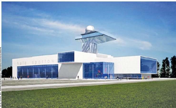
Wizualizacja nowej hali sportowej w Grodzisku Mazowieckim

Polse powstają nowe kluby MMA, w Grodzisku także.