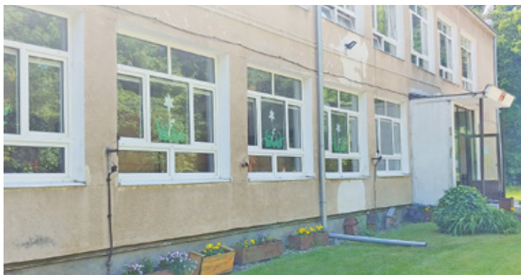
Tak obecnie prezentuje się przedszkole nr 11

Plany dotyczące przedszkola nr 11 są bogate. Przyjrzyjmy im się. Przedszkole zostanie powiększone o dobudowaną część, w postaci nowego zaplecza kuchennego. Obecny obiekt zostanie całkowicie przebudowany. Szykuje