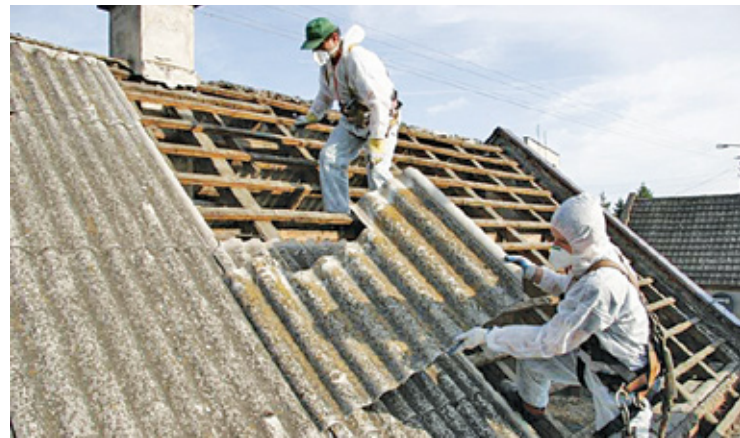
Azbest jest szkodliwy dla zdrowia

Złożenie wniosku i otrzymanie dofinansowania jest bardzo proste. Do dokumentów należy dołączyć ocenę stanu możliwości bezpiecznego użytkowania wyrobów zawierających azbest oraz kopię dokumentu potwierdzającego, że jesteście właścicielem nieruchomości. Następnie zostanie podpisana umowa o udzielenie dotacji, a właściciel nieruchomości otrzyma dotację jeszcze przed startem prac. Zanim rozpoczniemy realizację zadania, trzeba złożyć