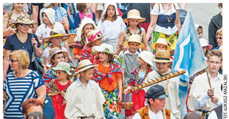
W poprzedniej paradzie w Grodzisku także udział wzięły dzieci w strojach ludowych