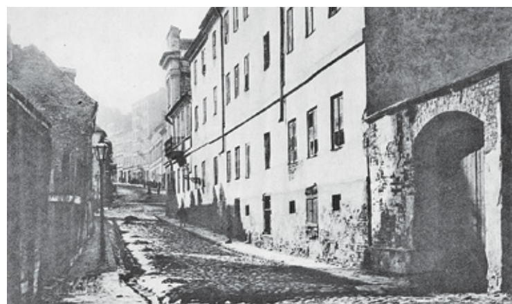
Ulica Mostowa w Warszawie, okres międzywojenny