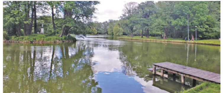
Miasto zapewnia, że dba o porządek

W ostatnich tygodniach uwagę mieszkańców przyciągały martwe ryby w stawie, w Parku Potulickich. Pojawiły się obawy co do stanu parkowego ekosystemu. Mieszkańcy zastanawiali się, kiedy właściwe organy zajmą się sprawą. Udało nam się ustalić, że pod koniec maja podjęto kroki w tej kwestii. – Martwe ryby zostały usunięte w zeszłym tygodniu (ostatni tydzień maja – red.) przez Koło PZW nr 18 w