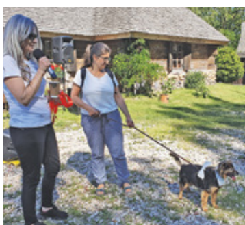
Organizatorki i jeden z psów czekających na adopcję

Nad okolicą górowała słynna drabina z OSP Żelechów, na której szczyt można było wjechać i podziwiać widoki. Tradycyjnie już, kolejka do tej ekscytującej przygody była od początku do samego końca imprezy. Druhny i druhowie cały czas prowadzili aktywności dla najmłodszych. Dużym zainteresowaniem cieszył się policyjny radiowóz i ekwipunek policjanta, który udostępnił dzielnicowy Józefiny.