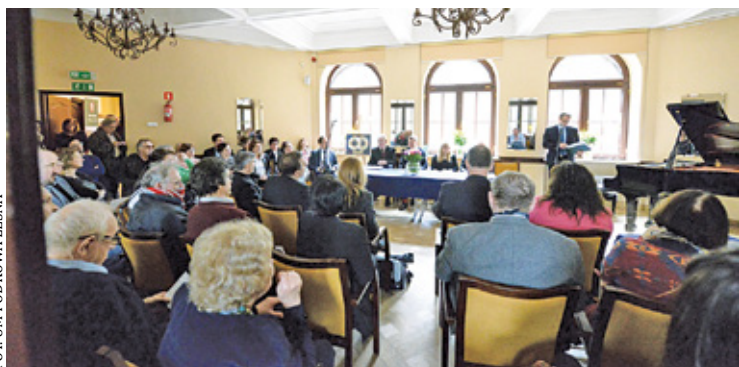
Raport o stanie Miasta Ogródu za rok 2021

Debata nad raportem przewidziana jest na 30 czerwca i będą mogli wziąć w niej udział mieszkańcy. Jednak każdy, kto chciałby zabrać głos, powinien złożyć do przewodniczącego rady miasta pisemne zgłoszenie, pod którym powinny się znaleźć podpisy 20 osób. Takie zgłoszenie powinno trafić do urzędu najpóźniej do 29 czerwca br.