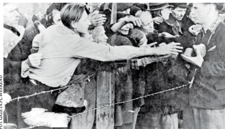
Rozdawanie chleba w obozie w Pruszkowie

Kobiety i dzieci załadowano do wagonów bydłych 4 września. Pociąg, bez przystanków na stacjach, dotarł do obozu w Oświęcimiu. Tu była następna selekcja i koszmarnie sceny rozdzielania matek i dzieci. Kobiety umieszczono w barakach z piętrowymi pryczami. Była świadkiem mordowania noworodka. Niemki topiły nowo narodzone dzieci