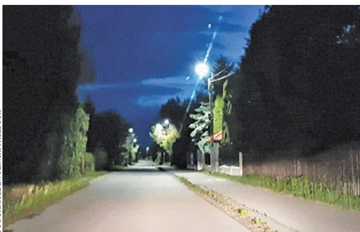
Na ulicach zrobiło się jaśniej

Koszt realizacji zadania to 80 000 złotych. – Firma PLJ, za zgodą urzędu gminy wybudowała napowietrzną sieć szerokopasmowego internetu na tych