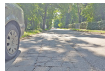
Ulica Podgórna w Milanówku ma być jedną z sześciu, które miasto chce wyremontować za pieniądze z Polskiego Ładu

Miasto Podkowa Leśna za otrzymane ponad 4,6 mln zł chce przeprowa-