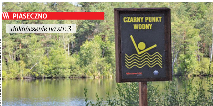
||| PIASECZNO dokończenie na str. 3

To kolejne utonięcie na terenie powiatu pruszkowskiego od początku wakacji