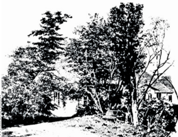
Dwór w Żelazowej Woli, rysunek od strony ogrodu

Rodzice i nauczyciele nagili Chopina do wyjazdu, zdawali sobie sprawę, że geniusz powinien być szlifowany jak diament, że tylko w Paryżu znajdzie takich nauczycieli, by mógł robić dalsze postępy. Chopinowi do wyjazdu się nie spieszyło, choć jak pisał: „kufer był już zakupiony, wyprawa gotowa, partytura poprawiona, chustki do nosa obrobione, nowe pantalone i frak nowy wypróbowane. Pozostała tylko – pisał do Wojciechowskiego – rzecz najokropniejsza „pożegnanie”. I dzień pożegnania nastąpił, trudne rozstanie z panną Konstancją Gładkowską artystką operową, pierwszą wielką miłością kompozytora i jego muzą. Tak o wyjeździe Fryderyka pisała Biesiada Literacka: „Grono przyjaciół z Elsnerem na czele odprowadziło go aż do Woli, gdzie zastali uczniów konserwatorium, pragnących również pożegnać go szczerze