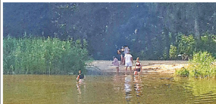
Służby apelują o niekorzystanie z dzikich kąpielisk

Służby apelują o niekorzystanie z dzikich kąpielisk oraz szybkie informowanie o możliwym zatonięciu, nawet, jeśli nie mamy pewności, że osoba