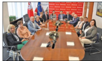
||| Region - Umowa na Paszkowiankę s. 6