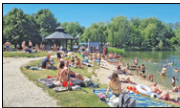
||| Pruszków - Kąpielisko otwarte s. 2