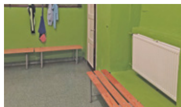
Szkolne szatnie są tak samo ciasne jak korytarze i sale dydaktyczne

W zeszłym tygodniu, po kilkunastu latach starań wreszcie udało się postawić pierwszy realny krok do poprawy tej sytuacji. Rada miejska przyjęła uchwałę o zmianie miejscowego planu zagospodarowania przestrzennego. Bez tego nie można było nawet wykonać projektu rozbudowy szkoły czy wybudowania nowego obiektu, bo taki plan miał burmistrz Piotr Remiszewski. Nie można było nic zaplanować, bo stary plan zawierał błąd.