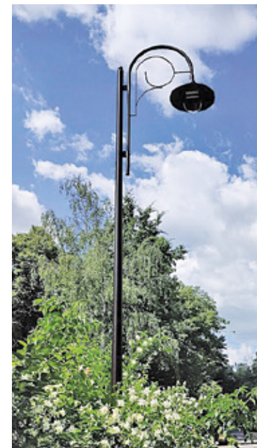
Samorządy podpisały umowę o zasadach współpracy

Nie ma możliwości umieszczenia słupów oświetleniowych miasta pod linią napowietrzna PGE, dlatego w górnej części ulicy Topolowej pastorały stoją po drugiej stronie jezdni. Niemniej rozstaw lamp, moce źródeł światła i wysokość zamieszczenia opraw odpowiadają dzisiejszym wymogom. Dlatego na całej długości ulicy mamy aż o 3 oprawy świetlne więcej – Napisał