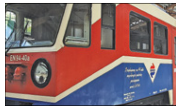
||| Region - Zmiana organizacji ruchu WKD s. 8