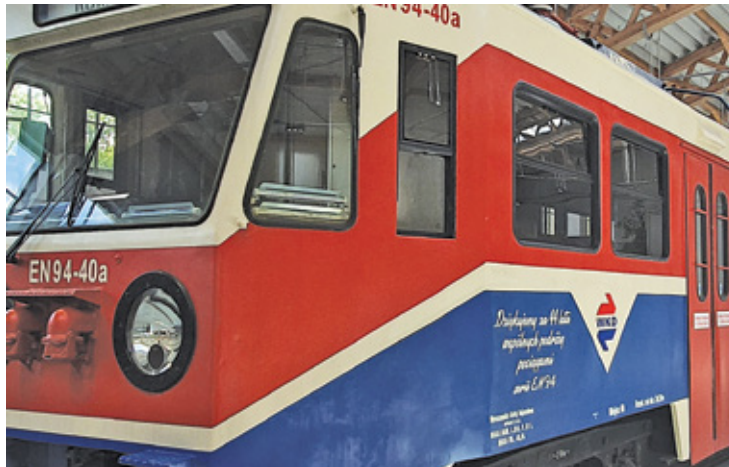
Zmiany i ograniczenia w kursowaniu WKD potrwać do 3 lipca

UWAGA: w dniach 02-03.07.2022 (sobota-niedziela), w związku z odwołaniem przez inwestora przebudowy stacji Warszawa Zachodnia, ruch pociągów WKD będzie odbywać się bez ograniczeń do stacji Warszawa Śródmieście WKD, według rocznego rozkładu jazdy pociągów. Zastępcza komunikacja