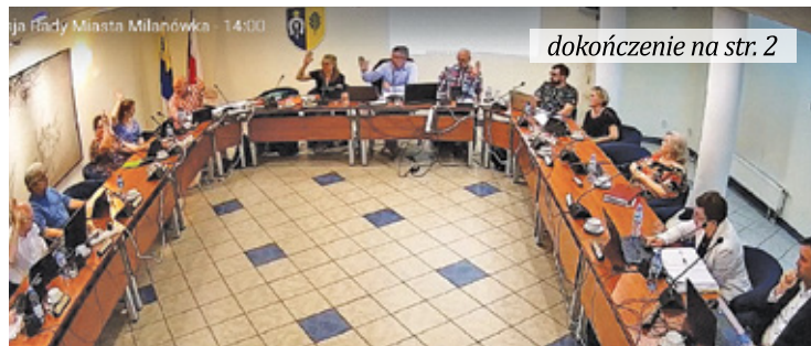
Za przyznaniem absolutorium i wotum zaufania zagłosowało tylko trzech radnych, przeciw było dziewięciu