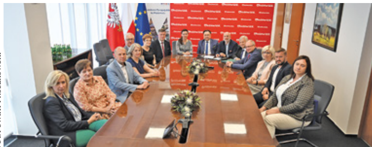
Samorządy podpisały umowę o zasadach współpracy

Mowa o jednej z najbardziej wyczekiwanych inwestycji w regionie. Trasa ma znacznie usprawnić ruch. Projekt zakłada budowę drogi wojewódzkiej (tzw. Paszkowianki) od skrzyżowania z DW 719 do węzła S8 Paszków. Odcinek ten zostanie włączony do węzłów: projektowanego z drogą nr 719 i istniejącego z drogą S8. Powstanie wiadukt nad linią WKD i rzekami Utratą i Zimną Wodą.