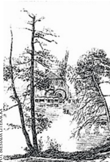
Młyn w Żelazowej Woli

wszystkich zrozumiałe) oklaskiwano, ale zdaje mi się, że stało się to dlatego, że publiczność chciała okazać, iż rozumie i potrafi ocenić muzykę poważną. Za to Adagio i Rondo wywarły większe wrażenie i wywołały oklaski „od serca”. Potpourri na tle motywów ludowych chybiło celu. Klaskano, ale aby pokazać artyście, iż się nie nudzono.” Chopin niezadowolony, a recenzje znakomite. Kurpiński uważał, że za każdym razem przesłuchania F. moll dostrzega ciągle nowe piękno. Elsner krytycznie, ale nie do Chopina tylko do fortepianu, że za słaby. Mochnacki rozważał, że Chopin używa za mało siły, za mało energii i gra jego traci na wyrazistości. Gdy w końcu na pewien koncert, też w teatrze, dano Chopinowi możliwość zagrania na instrumencie wiedeńskim, na którym to