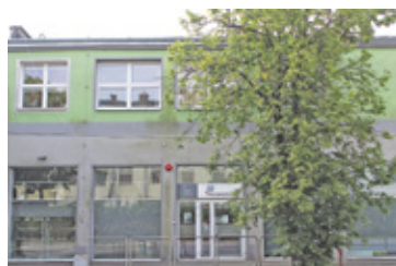
Budynek Publicznego Ogniska Plastycznego

Na zajęcia w Publicznym Ognisku Plastycznym w Grodzisku Mazowieckim zapisali się może każdy chętny – nie tylko osoby przygotowujące się do egzaminów do uczelni artystycznych, ale także dzieci, młodzież i dorośli, chcący rozwijać swoje pasje plastyczne. Celem placówki jest bowiem nie tyle kształcenie artystów plastyków, co twórczy rozwój, rozbudzanie zdolności artystycznych oraz wykształcenie wszystkich słuchaczy na wrażliwych i świadomych odbiorców sztuki. W minionym roku szkolnym w grodziskim Ognisku Plastycznym działało 12 pracowni, w których prowadzono zajęcia z malarstwa, rysunku, ceramiki, fotografii, grafiki, a także przygotowanie do egzaminów na studia na