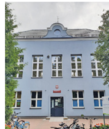
Budynek Szkoły Podstawowej nr 3 w Piastowie

Chcemy by sala sportowa korespondowała z nowoczesnymi rozwiązaniami, które ma już cały główny budynek szkoły, czyli min. odnawialne