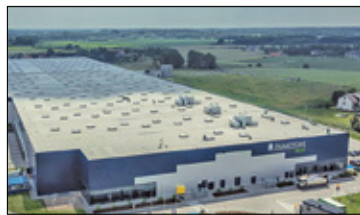
||| Nadarzyn - Chiński gigant s. 2