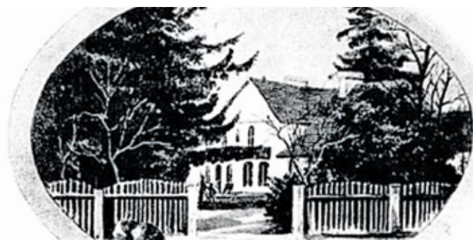
Dwór w Żelazowej Woli rycina z 1898 r.

odśpiewaniem kantaty, umyślnie na ten cel przez Elsnera skomponowanej. W Woli też wyprawiono na cześć Fryderyka ucztę, w czasie której wesole