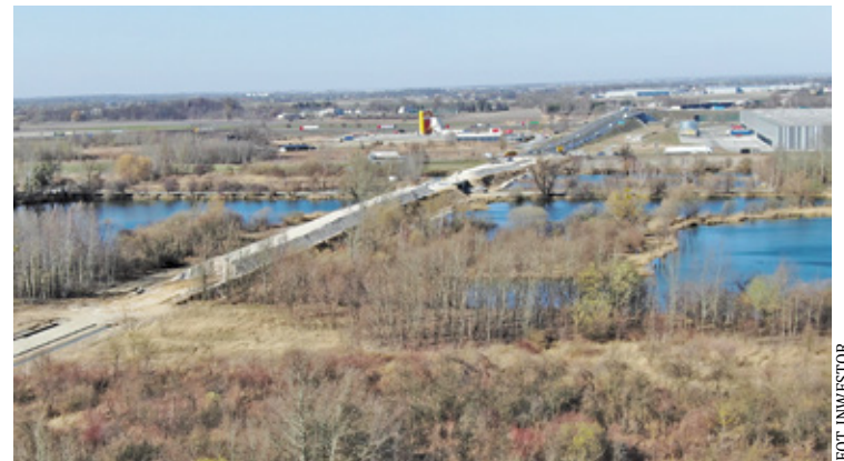
Obwodnica to także mosty, skrzyżowania, ronda itp.

Obwodnica zaczyna się przy zjeździe z A2 w kierunku Grodziska Mazowieckiego i kończy na rondzie w Kałęczynie. Obwodnica to także in-