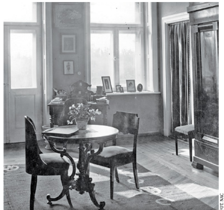
Dom pisarza w Podkowie Leśnej – sypialnia

Po wojnie dom nie stracił swej sławy. Nadal był mekką dla artystów, odbywały się tu koncerty, sesje literackie, wyprawiano przyjęcia, na których ciągle, tak jak w czasie powstania warszawskiego na stole nie brakowało przedniego wina. Największe przyjęcie,