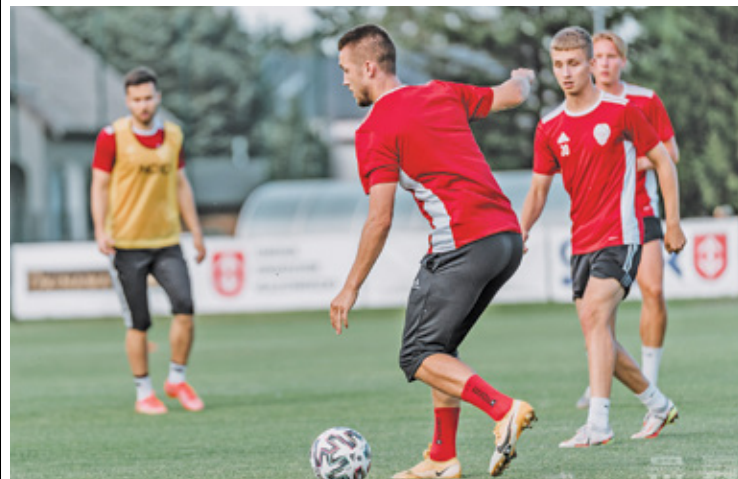
Pierwszy mecz sezonu 6 sierpnia

Za Pogonią rywalizacja w fazie wstępnej Pucharu Polski. Zespół z Grodziska spotkał się ze Stalą Rzeszów. W