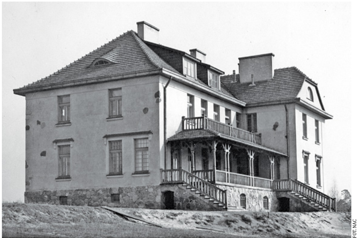
Dom Iwaszkiewiczów w Podkowie Leśnej

Iwaszkiewiczowie przygarniali wszystkich, którym potrzebna była pomoc. Stawisko stało się też salonem