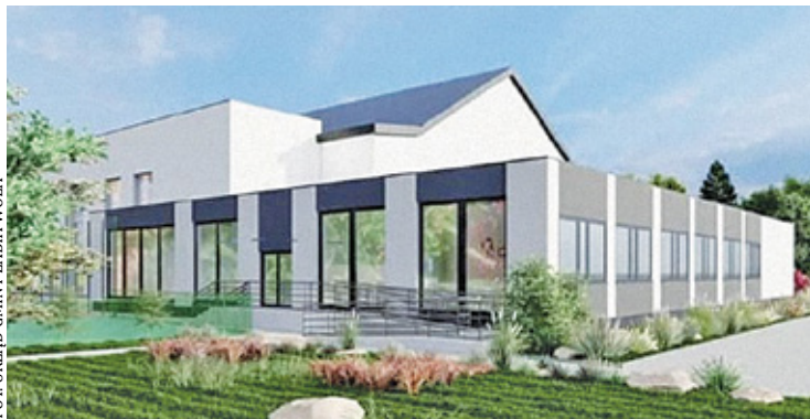
Dzięki dotacji szkoła w Ojrzanowie zostanie rozbudowana

Gmina otrzymała dotację w wysokości 2,6 mln złotych na budowę modułowej szkoły podstawowej w Ojrzanowie. Inwestycja ta umożliwi dzieciom z Siostrzeni, czyli z terenu, gdzie niegdyś znajdował się PGR, na łatwiejszy dostęp do szkolnictwa. Dofinansowanie stanowi 98 proc. kosztów całkowitych inwestycji. Szkoła modułowa to konstrukcja składająca się z gotowych elementów. Jest doskonałym i stosunkowo