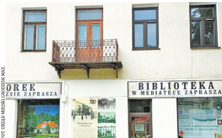
Fasady nawet przeładowane szyldami mogą być estetyczne, ale przede wszystkim muszą być zgodne z Ustawą Krajobrazową

Uchwała Krajobrazowa wyznacza trzy terminy dostosowania istniejących już w mieście reklam do nowych norm. 12 miesięcy mają właściciele tablic reklamowych i urządzeń reklamowych, sytuowanych na ogrodzeniach (banery) oraz na nieruchomościach ujętych w Gminnej Ewidencji Zabytków. 24 miesiące wyznaczono na dostosowanie do przepisów wszystkich pozostałych tablic reklamowych i urządzeń, w tym banerów usytuowanych na budynkach i balkonach. Wyjątkiem są tablice reklamowe i urządzenia reklamowe, sytuowane na podstawie decyzji administracyjnej o pozwoleniu na budowę.