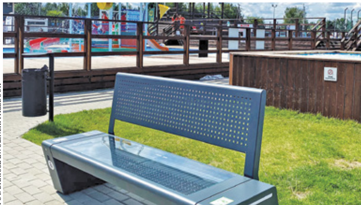
Ławka na terenie basenów letnich

przy placu Poniatowskiego oraz na Pastewniku w Nadarzynie. Można usiąść, zregenerować się, naładować telefon i skorzystać z wi-fi.