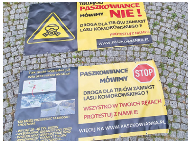
Takich banerów w regionie jest sporo

Grono tych, którzy jasno wyrażają swoje zdanie stale się powiększa. – Domagamy się wstrzymania prac projektowych do czasu przedstawienia wyniku analiz ruchu i przeprowadzenia otwartej dyskusji społecznej nad zasadnością realizacji przedmiotowej inwestycji, zarówno w kontekście prognozowanego ujemnego jej wpływu na istniejącą przyrodę i tereny biologiczne czynne na terenie gminy Brwinów, jak też w odniesieniu do możliwej likwidacji Rodzinnego Ogródka Działkowego.