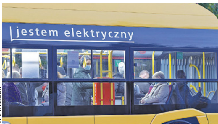
Dwa elektryczne autobusy komunikacji miejskiej pojawią się w Pruszkowie

Dwa tego typu pojazdy są już własnością Pruszkowa. Zostały zakupione w ramach projektu Zielone Płuca Mazowsza, wspierającego rozwój komunikacji miejskiej w gminach południowo-zachodniej części województwa. To partnerski projekt gmin Pruszków, Gro-