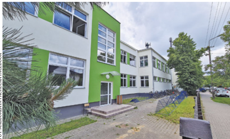
Inwestycja obejmuje przebudowę, rozbudowę, remont i termomodernizację placówki

są znane, bo wiele razy je słyszymy. Bezprecedensowe problemy z dostępnością materiałów budowlanych i trudności z uzyskaniem odpowiedniej liczby pracowników wskutek wojny w Ukrainie, niestety dotyczą także i nas