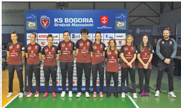
W poprzednim sezonie Bogoria utrzymała się w Ekstraklasie