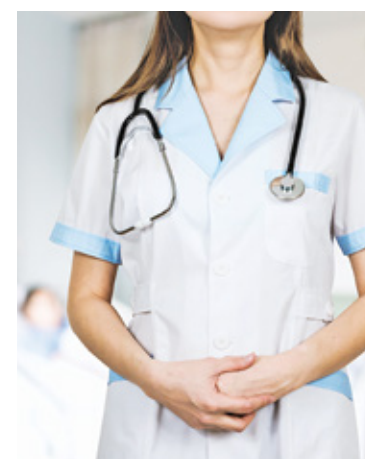
W obu powiatach deficytowe są zawody związane z opieką zdrowotną i usługami medycznymi

Jeśli mamy możliwość przekwalifikowania się, to praca czeka na kierowców autobusów a także kierowców samochodów ciężarowych i ciągników siodłowych. Na rynku zawodów deficytowych znajdują