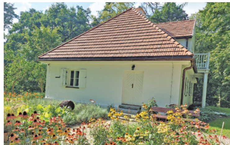
Ziemiański dworek Chełmońskiego