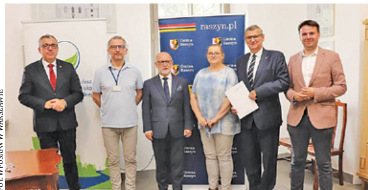
Samorząd podpisał umowę. Teraz mieszkańcy mogą składać wnioski

Warto więc skorzystać z możliwości pozyskania dofinansowania i usunąć azbest. Wystarczy złożyć dokumenty. – Zachęcamy mieszkańców