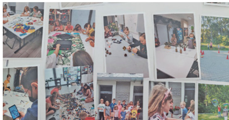
W kapsule czasu znajdują się rysunki dzieci, korzystających z świetlicy wiejskiej