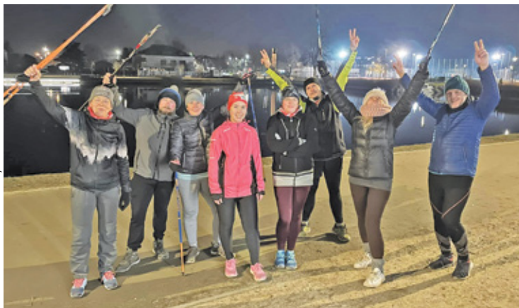
Inicjatywa spotkała się ze sporym zainteresowaniem

G rodzisk Mazowiecki świętuje wyjątkowy jubileusz. Miasto obchodzi 500-lecie nadania praw miejskich i z tej okazji samorząd przygotował bogatą ofertę imprez. Mieszkańcy również nie próżniają i włączają się w świętowanie.