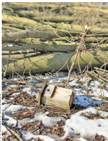
Nie oszczędzono nawet drzew z budkami dla ptaków