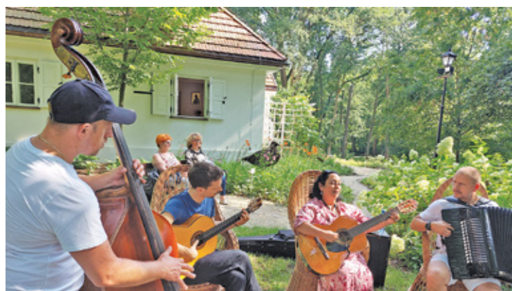
W Dworku Chełmońskiego można spędzić niezwykle chwile, dzięki zaproszonym tam artystom