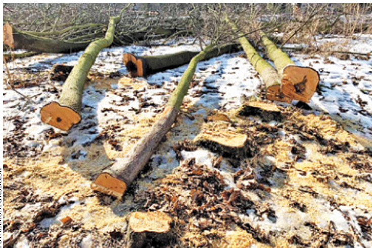
Wycięto drzewa, które stanowiły zieloną wyspę pośrodku miasta