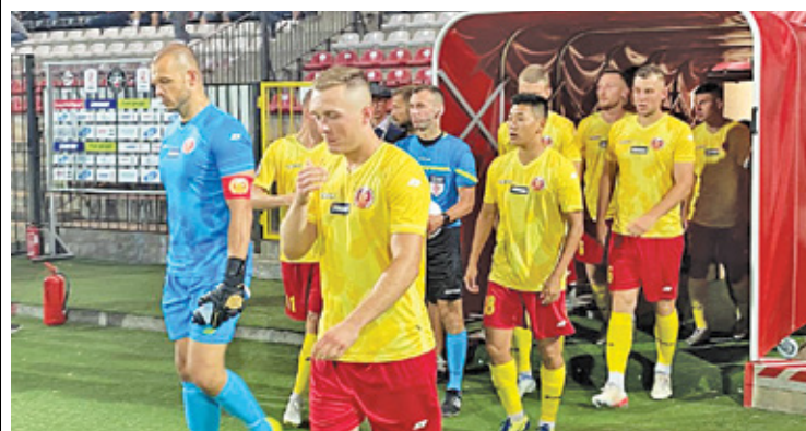
W tym sezonie Znicz ma na koncie trzy wygrane

Po sześciu meczach Znicz ma na swoim koncie 10 oczek. Żółto-czerwoni wygrali trzy mecze, zanotowali jeden