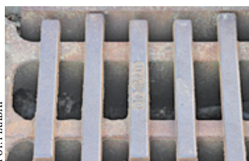
Powiat szuka wykonawców zadań

Starostwo ogłosiło zapytania ofertowe i czeka na propozycje potencjalnych wykonawców. Planowane jest przygotowanie projektu wraz z