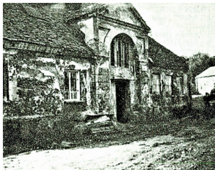
Zajazd w Nadarzynie w 1988 r.

znajdowały się: szynk, komora i dwa pomieszczenia służące gospodarzowi. Od strony kościoła ulokowane były pokoje gościnne. W XIX w. zajazd w Nadarzynie stał się znanym punktem na kupieckim szlaku. Ale szczególnie rozślawił to miejsce książę Józef Poniatowski, który zatrzymał się tu przed bitwą pod Raszynem w 1809 r. Od tej pory zajazd nazywano często „Poniatówką”, a sam książę stał się patro-