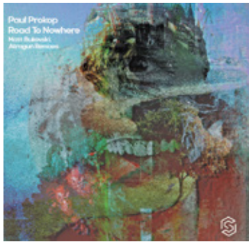
FOT. PAUL PROKOP

Co oferuje artysta swoim fanom? W skład nowego wydawnictwa wchodzi trzy remixe, które oddają każde spektrum muzyczne. Wyteżona praca ma wprowadzić słuchaczy w wyjątkowy klimat. Pierwszy to głęboki miks Paula. Zachowuje całą mistykę oryginału i prowadzi słuchacza do króliczej