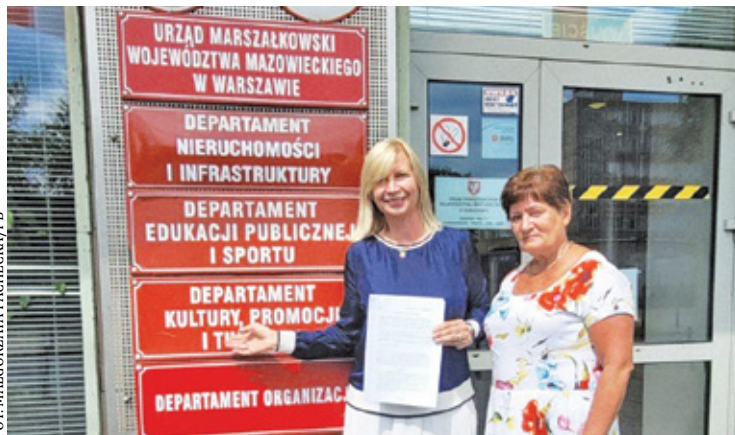
Dofinansowanie wynosi 70 tysięcy złotych

Gmina Michałowice zajmie się remontem cmentarza. Możliwe będzie to dzięki dofinansowaniu z programu „Mazowsze dla zabytków”, w ramach którego samorząd pozyskał 70 tysięcy złotych. O pozyskaniu środków przez