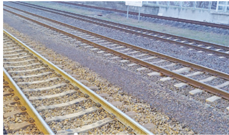
Badania zostaną przeprowadzone w jedenastu lokalizacjach

T roska o bezpieczeństwo jest niezwykle ważna. Zawsze kierowcy i uczestnicy ruchu muszą zachowywać ostrożność. Zwłaszcza przy przejazdach kolejowych. Pruszkowskie Starostwo Powiatowe zajmie się sprawdzeniem natężenia ruchu oraz warunków