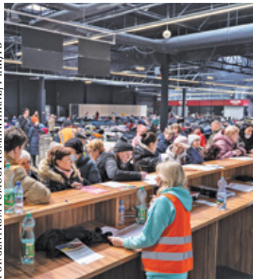
Centrum Pomocy Humanitarnej

– Zapewnienie edukacji dla dzieci przebywających w Rządowym Centrum Pomocy Humanitarnej Ptak, samodzielnie przez samorząd gminy Nadarzyn jest niemożliwe do zrealizowania – czytamy w korespondencji. – Do gminnych publicznych szkół podstawowych uczęszcza obecnie 2045 uczniów, w tym blisko 200 uczniów to uchodźcy mieszkający na terenie gminy – napisano.