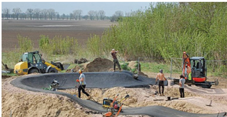
Budowa pumtracku w Brwinowie

Mieszkańcy trzech miast ogrodów dzięki ankiecie Stowarzyszenia LGD Zielone Sąsiedztwo mogą wpłynąć na to, gdzie i jak w najbliższych latach będą mogli odpoczywać i uprawiać sport. Na podstawie ich opinii powstanie projekt inwestycji na sumę 7 mln zł pochodzących z unijnych dotacji.