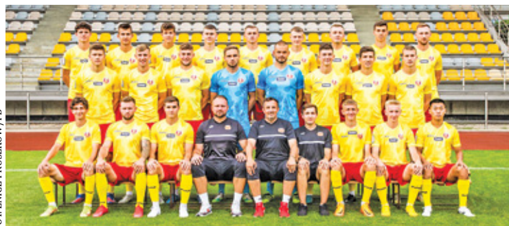
Znicz nadal bez zwycięstwa na wyjeździe

Znicz Pruszków ogłosił nabór na zajęcia dla dziewczynki i chłopców