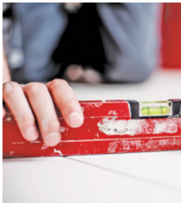
Z programu mogą skorzystać mieszkańcy gminy Michałowice po 60. roku życia

Gmina Michałowice wychodzi naprzeciw potrzebom seniorów. Samorząd zapewnia wsparcie w ramach programu „Złota Rączka dla Seniora”. Na czym polega? – To nowy program