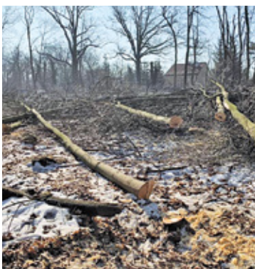
Wycięto drzewa, które stanowiły zieloną wyspę pośrodku miasta i wiaduktu nad torami

Sąd uznał, że konieczne jest między innymi przesłuchanie dalszych świadków, aby ocenić i wyjaśnić sprawę. Zdaniem sądu informacje zawarte w aktach świadczą mogą m.in. o tym, że oskarżony otrzymywał sprzeczne informacje od funkcjonariuszy publicznych, którzy nie nakazali mu kategorycznie zaniechać wycinki drzew. Konieczne jest także zbadanie, czy kilkadziesiąt drzew wyciętych z po-