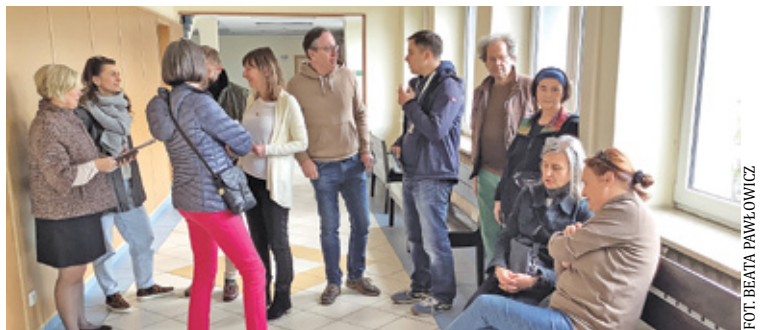
W sądzie rejonowym zgromadziło kilkanaście osób, w tym ekologów i mieszkańców Milanówka