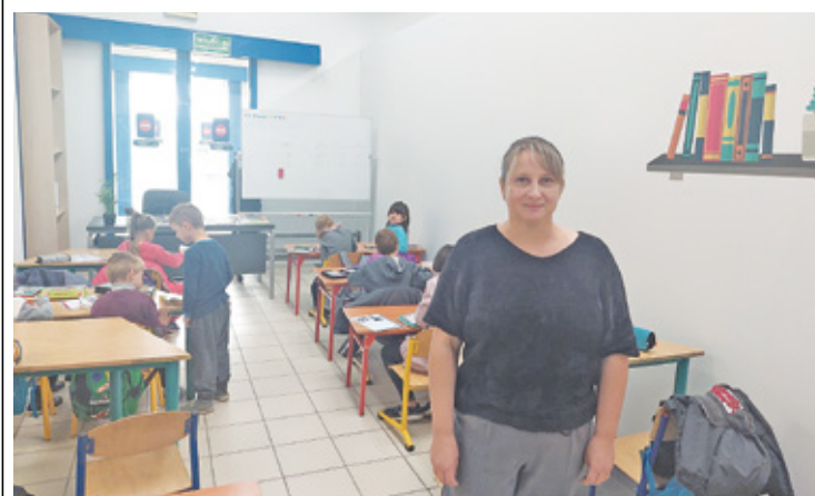
Lekcje w filii dla ukraińskich dzieci zaczynają się od godz. 9.00