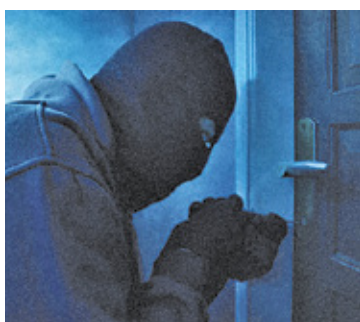
Włamywacze w Pruszkowie są coraz bardziej zuchwali

Policja informuje, że problem jest jej znany. Tylko od 1 do 22 września zgłoszono trzy kradzieże z włamaniem do mieszkań w Pruszkowie. – Do zdarzeń dochodziło w różnych godzinach w ciągu dnia i nocy – informuje Karolina Kańka, rzecznik prasowy Komendy Powiatowej Policji w Pruszkowie. – Wielu złodziei działa w środku dnia. Włamywacz, zanim zdecyduje się doko-