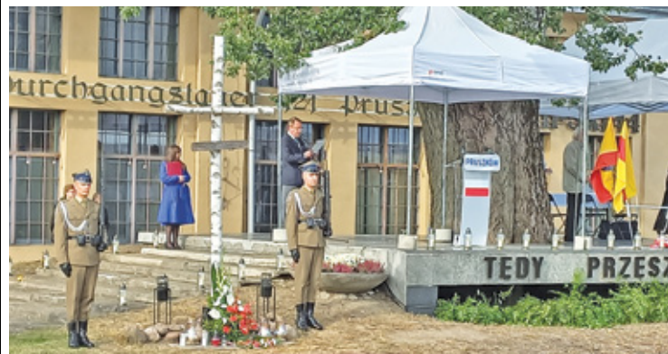
Uroczystość miała miejsce przy pomniku „Tędy przeszła Warszawa” na terenie byłego obozu w Pruszkowie

Mariusz Błaszczak, Minister Obrony Narodowej w swoim liście przypominał historię obozu i przelaną w nim krew. Oddał też hołd osobom, które wspierały uwięzionych przez hitlerowców w Pruszkowie ludzi, pod-