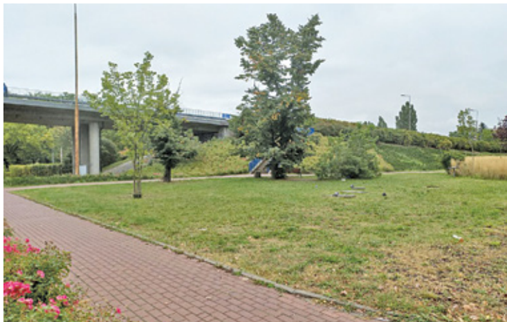
Planowane miejsce instalacji pomnika

Zakup zabytkowego parowozu TY-220 to wydatek rzędu 75 800 zł. Jednak to dopiero początek wydatków związanych z pomnikiem. Dochodzą koszty renowacji, które obejmują prace polegające na rozłożeniu pojazdu i całkowitą jego odnowę, transport na miejsce renowacji, a następnie podróż do Piastowa i instalację w wybranym miejscu. Całość przedsięwzięcia, bez kosztu zakupu, może wynieść ponad 300 tysięcy złotych.