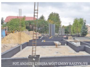
FOT. ANDRZEJ ZARĘBA WÓJT GMINY RASZYN/FB

Gmina podpisała umowę na wsparcie w wysokości 7,6 miliona złotych na budowę budynku komunalnego w Podolszynie. – Środki te są nam niezmiernie potrzebne – podkreśla wójt Andrzej Zaręba.