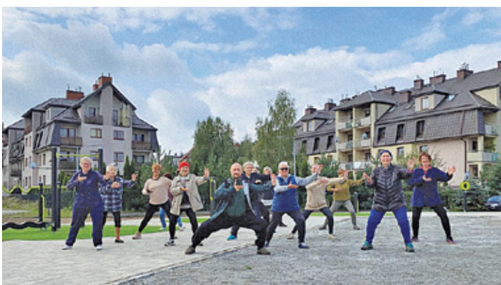
Strefa znajduje się między Osiedlem Sochaczewska i ul. 11 Listopada

W kwietniu informowaliśmy na naszych łamach o projekcie. Dziś mieszkańcy Brwinowa mogą spędzać aktywnie czas na tym terenie. Na ponad 740 m kw. pojawiły się urządzenia do ćwiczeń, z których korzystać może każdy chętny. Co prawda strefa powstała z myślą o seniorach, ale nie wyklucza to udziału innych osób.