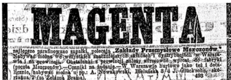
Reklama z Kurjera Warszawskiego z 1890 r.

Dzięki umiejętności manipulowania ludźmi Kreuger miał wpływ np. na cenę pudełka zapałek. Łożył olbrzymie sumy na przekupywanie ministrów i posłów w różnych państwach. Między innymi okazało się, że dla uzyskania