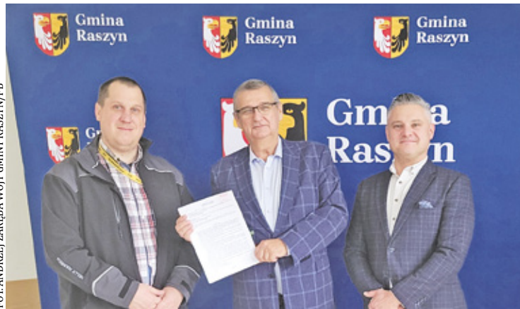
Gmina podpisuje umowy z wykonawcami

Gmina Raszyn będzie rozwijała infrastrukturę rowerową. Samorząd planuje budowę ścieżek, ale najpierw zajmie się ich zaprojektowaniem. Gmina ogłosiła postępowanie przetargowe na przygotowanie dokumentacji. Pierwszą ze ścieżek zaplanowano wzdłuż ul. Długiej, Olszynowej, Drogi Hrabskiej i części ul. Falenckiej. Tym samym cyklisci przejadą od Dawid, przez Łady do