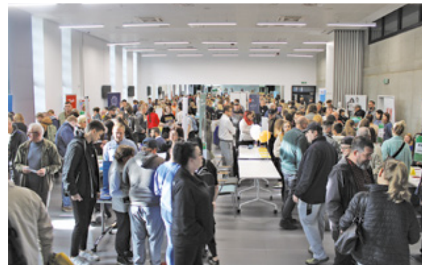
XVIII Grodziskie Targi Pracy

Targi są bez wątpienia wydarzeniem ważnym dla pobudzenia lokalnego rynku pracy oraz zwiększenia aktywności zawodowej mieszkańców Powiatu Grodziskiego. Warto także podkreślić, że stopa bezrobocia