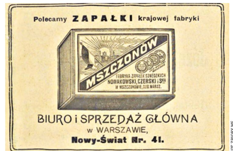
Reklama zapałek z Mszczonowa z 1919 r.

To właśnie jego zapałki pod Wilnem i nad Prypecią, w tzw. Polsce B., dzielono na czworo.” Kreugera w latach 20. XX wieku uznawano za najbogatszego człowieka na świecie. Jak powstała jego fortuna napiszę w drugiej części.