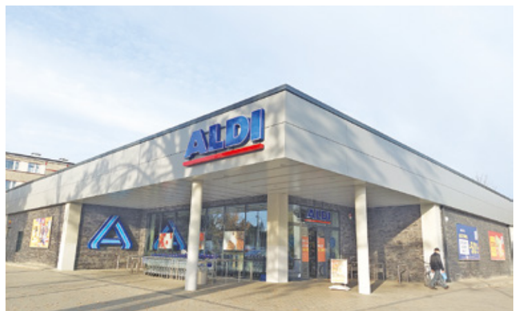
Market sieci Aldi działa już od kilku lat w sąsiednim Grodzisku Mazowieckim

budowy, gdyż nie wymaga ona żadnej dodatkowej zgody samorządu. – Zdaniem radnych markety i sklepy, które