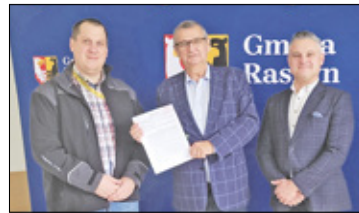
||| Raszyn - Czas projektowania s. 7