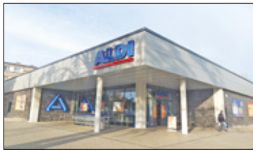
||| Milanówek - Kolejny market niemieckiej sieci s. 2