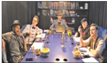
||| Brwinów - Gry RPG - wspólnie stwórzmy opowieść s. 6