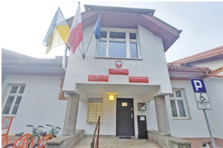
Podkowa Leśna w grudniu już nie będzie połączona siecią wodociągową z Brwinowem