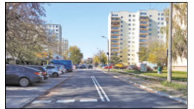
||| Piastów - Koniec remontów s. 7