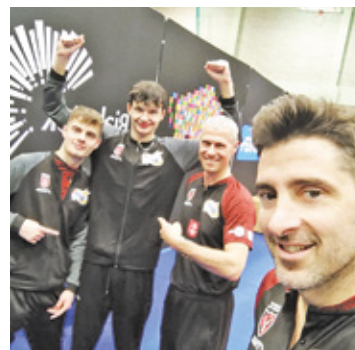
Radość po wygranej w Białymstoku