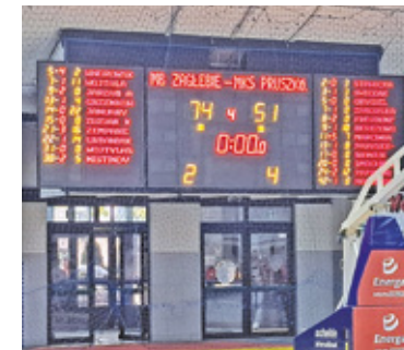
MKS nadal bez wygranej

kontynuowały w drugiej odsłonie, a MKS był bezradny. Na półmetku pruszkowski zespół przegrywał 16:58. Jedynie w ostatniej kwarcie MKS toczył