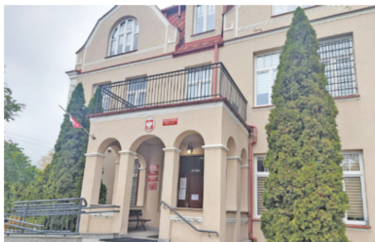
Brwinów przez półtora roku konfliktu uniezależnił się od sieci wodociągowej Podkowy