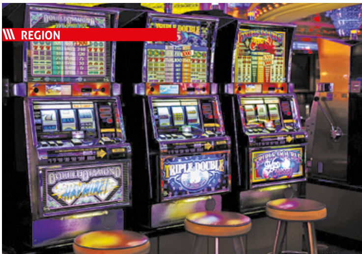
REGION Działalność nielegalnych punktów hazardowych to naruszenie ustawowego monopolu państwa w tym zakresie i straty dla jego budżetu, ale przede wszystkim negatywne skutki dla społeczeństwa