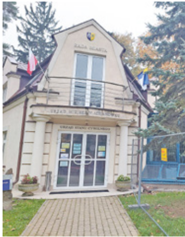
Urząd Stanu Cywilnego w Milanówku mieści się w eleganckim budynku ze szklaną przybudówką, która właśnie stanowi powód zalań

Wymiana poszycia dachu nie rozwiąże jednak problemu urzędu stanu cywilnego. Woda do budynku dostaje się nie tylko od góry, zalewając pokoje urzędników. Radni, nie tylko państwo młodzi, zwracali od kilku lat uwagę