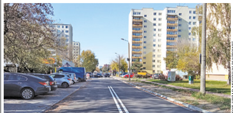
Nowe nawierzchnie to większy komfort

Konieczny był także remont Jaśminowej i Placu Słonecznego. Jakość infrastruktury była daleka od ideału. Jezdnia, zjazdy i chodniki były bardzo zniszczone. W ostatnich tygodniach ulice przeszły metamorfozę, co cieszy mieszkańców. Nawierzchnia jezdni zo-