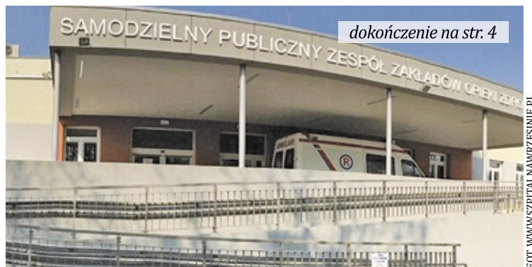
Szpital na Wrzesinie

Informacja o odejściu 15 pielęgniarek ze szpitala zaskoczyła mieszkańców Pruszkowa.