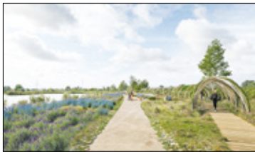
||| Michałowice - Naturalny teren s. 3