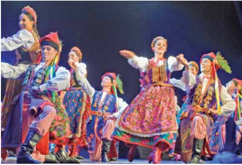
Artyści „Mazowsza” wystąpili ze znakomitym koncertem