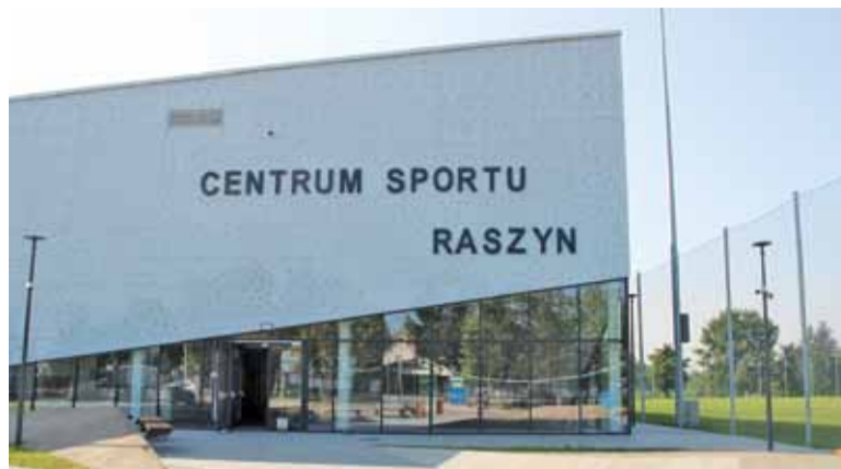
Centrum Sportu Raszyn jest już gotowe

Przez ponad rok przy ul. Sportowej trwały prace budowlane. Wiązało się to z trudnościami dla lokalnego klubu KS Raszyn, który mecze u siebie musiał de facto rozgrywać na obcych boiskach. Hala jest już gotowa, niebawem wszystko powinno wrócić do normy.