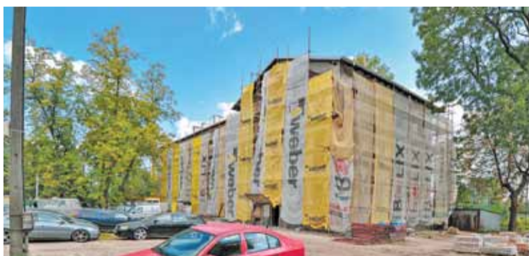
Obecnie modernizowany jest zabytkowy budynek