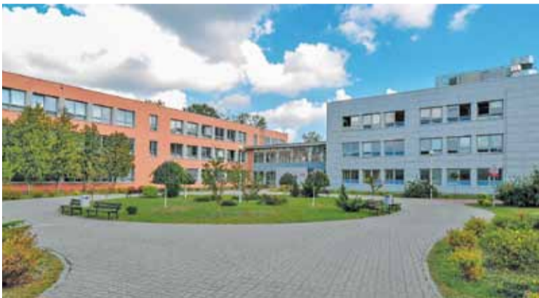
Zespół Szkół Ogólnokształcących i Sportowych przy ul. Gomulińskiego