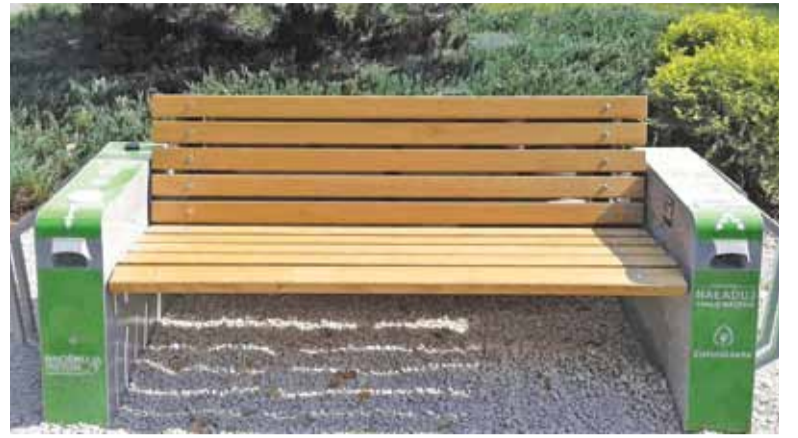
Ławki solarne zostały zamontowane z myślą o wygodzie mieszkańców