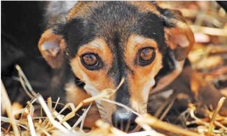
Małe gminne schronisko jest lepsze dla zwierząt, a także tańsze w użytkowaniu niż zewnętrzne schroniska