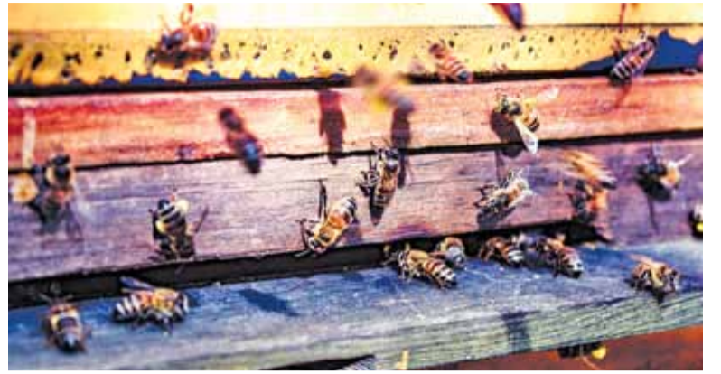
O pszczoły powinni dbać wszyscy, bo wszyscy bez nich zginą