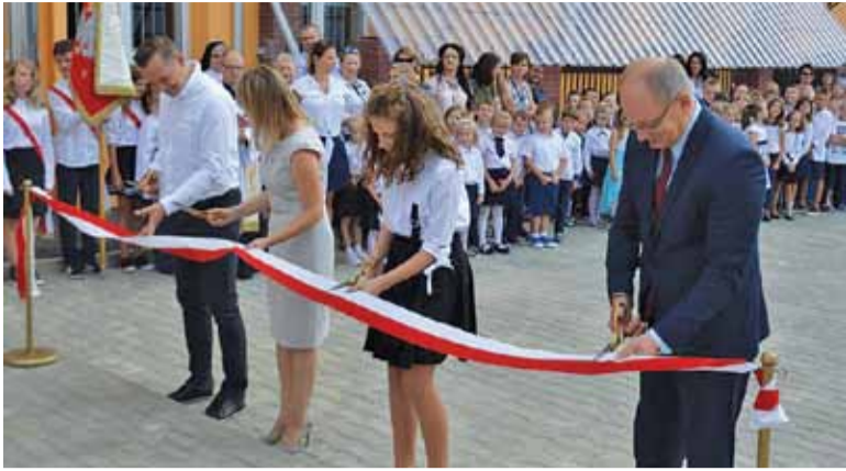
Na ten moment w Kostowcu czekali od dawna