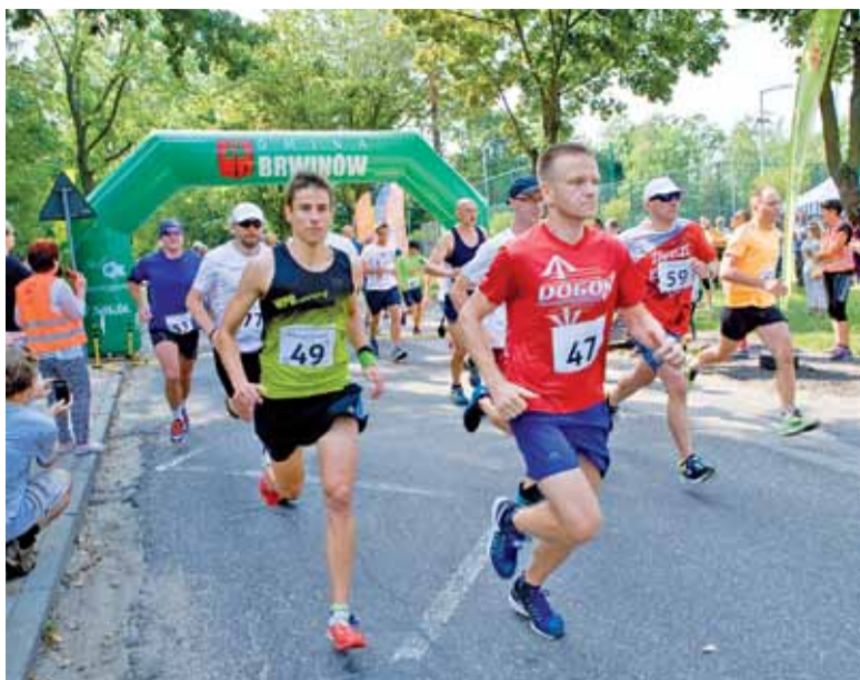
Start przy żółwińskim Orliku