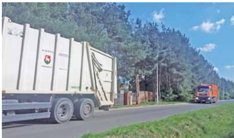
Do Hetmana jadą właśnie odpadki z Piaseczna