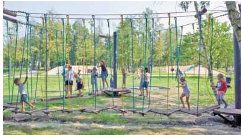
Na Stawach Walczewskiego dzieci mają teraz swoje miejsce

W ramach inwestycji wykonane zostały również ścieżki z mineralno-żywniczą nawierzchnią. Budowa placu zabaw współfinansowana jest w 90%