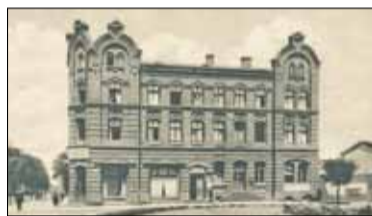
||| Historia - Śmierć racjonalizatora, cz.2 s. 6