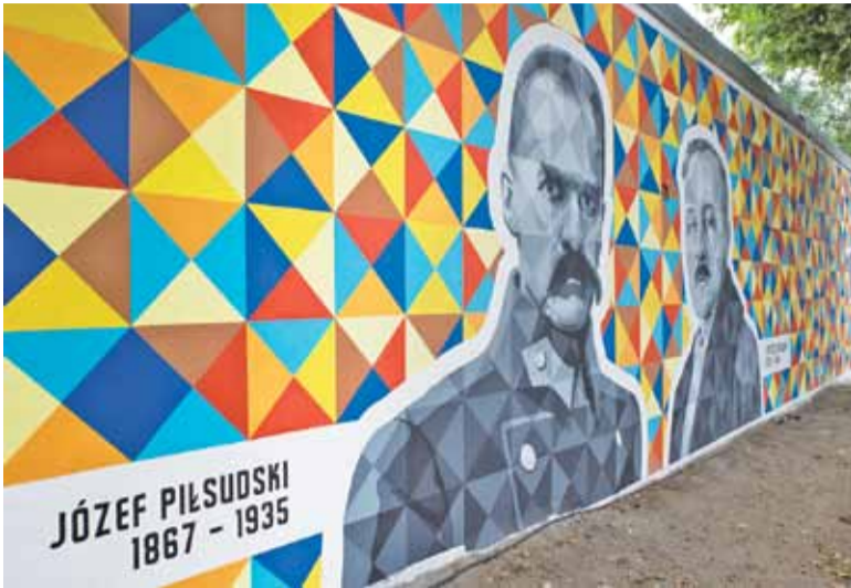
Mural w całej okazałości