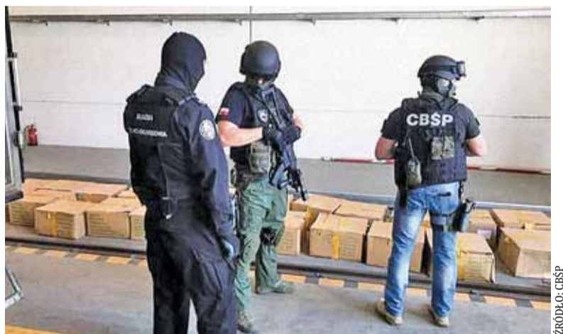
W trakcie działań zabezpieczono 1,1 tony krajanki tytoniowej, ponad 10 tys. sztuk papierosów bez polskich znaków akcyzy oraz maszyny do produkcji papierosów