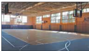
||| Łady - Szkoła w nowej odświeżeniu s. 5