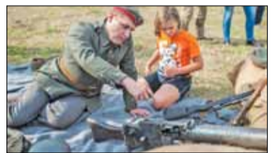
||| Grodzisk Mazowiecki - Rodzinny Piknik Historyczny s. 7