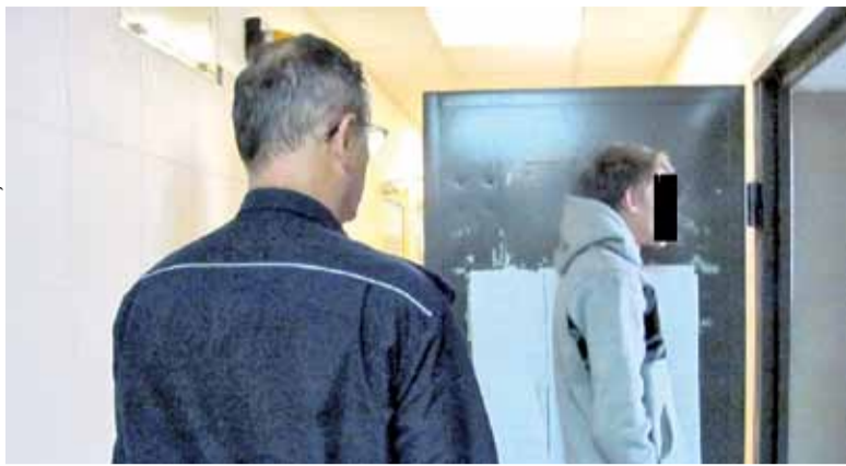
Kamil P. usłyszał zarzut prowadzenia pod wpływem alkoholu oraz zabór ciągnika