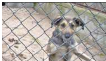
||| Milanówek - Czekając na adopcję s. 4