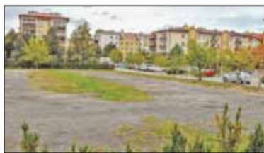
||| Pruszków - Co powstanie przy ul. Latter? s. 2

P R U S Z K Ó W ||| P I A S T Ó W ||| B R W I N Ó W ||| M I C H A Ł O W I C E ||| N A D A R Z Y N ||| R A S Z Y N G R O D Z I S K M A Z O W I E C K I ||| B A R A N Ó W ||| J A K T O R Ó W ||| P O D K O W A L E Ś N A ||| M I L A N Ó W E K ||| Ż A B I A W O L A