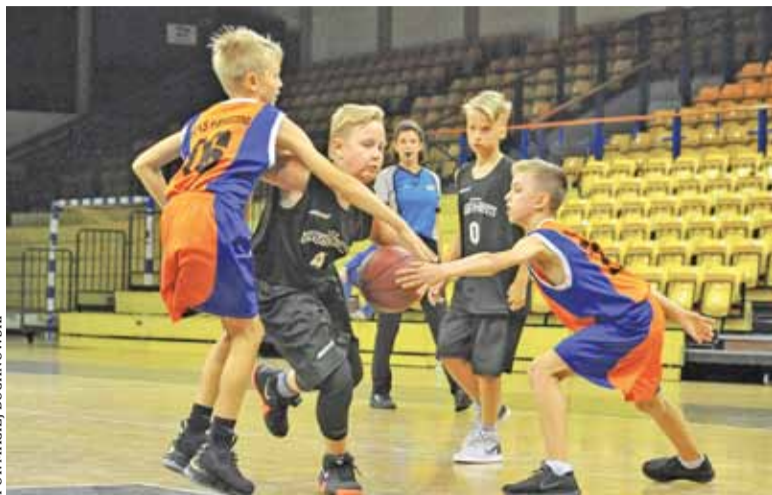
Młodzi zawodnicy dzielnie walczyli

W miniony weekend w halach Znicz, MOS i ZSOiS w Pruszkowie odbył się Memoriał Krzysztofa Żolika. Zawodnicy rywalizowali w dwóch kategoriach wiekowych, U12 i U14. Łącznie w me-