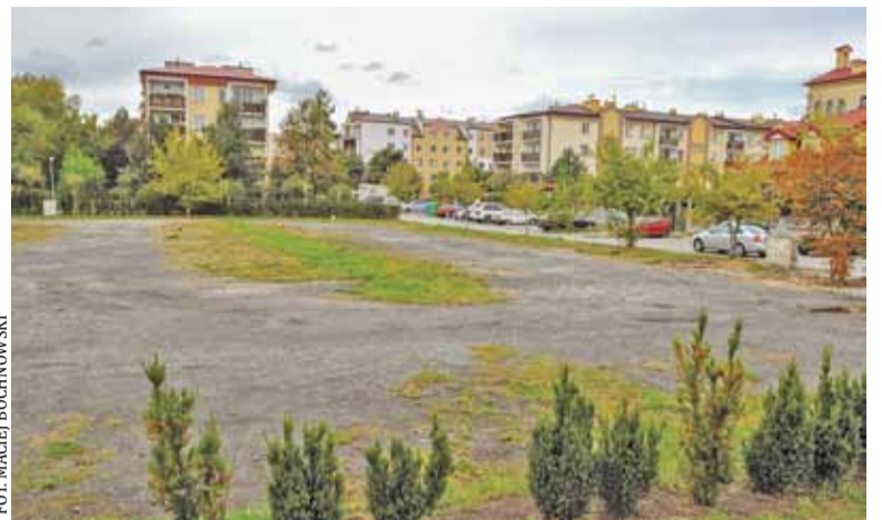
Teren czeka na zagospodarowanie

Urząd zaproponował mieszkańcom trzy koncepcje zagospodarowania terenu. Dwie dotyczą urządzenia boisk, jedna zakłada teren zielony. Przygotowanie dwóch wariantów koncepcji przeznaczonej na wykorzystanie spor-