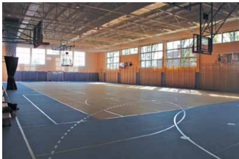
Hala sportowa w szkole w Ładach