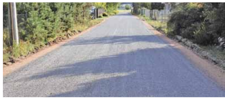
Utwardzona destruktem droga jest równa jak asfalt