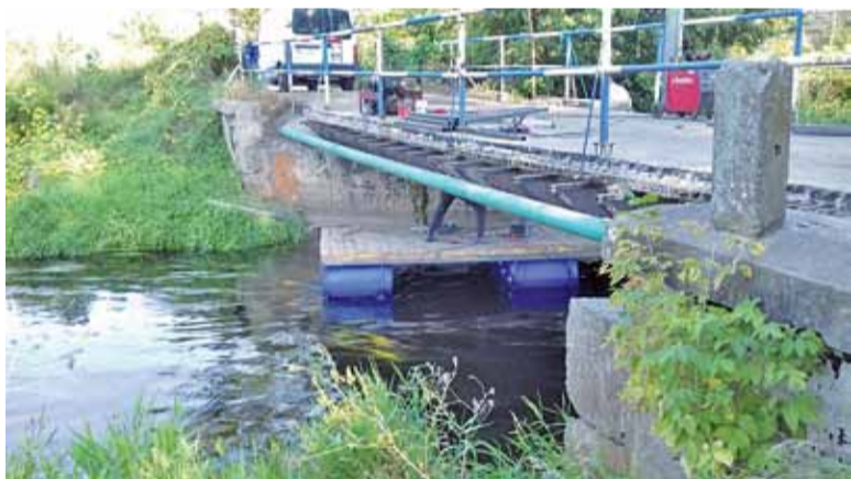
Dla ruchu kołowego most będzie całkowicie zamknięty do końca października