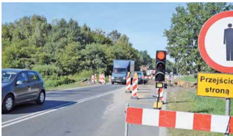
W miejscu prowadzonych prac nikt nie pracuje