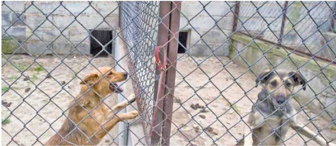
Odrzucone, smutne, czekają aż ktoś je przygarnie