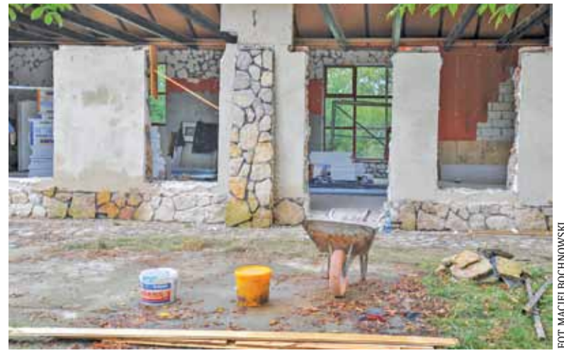
Prace modernizacyjne trwają