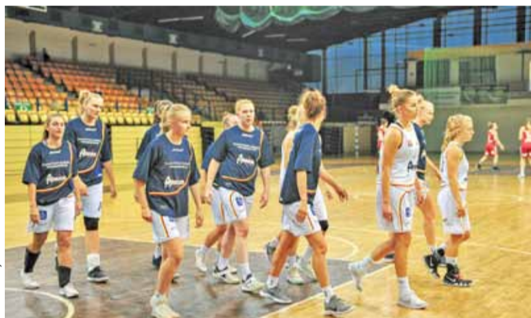
Lider skompletował kadrę. Krajewska to dwunasta zawodniczka w pruszkowskiej ekipie