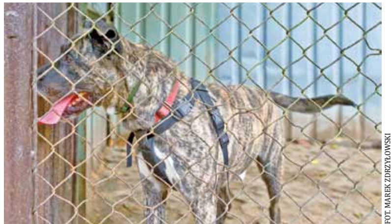
Ten piękny zwierzak czeka na swojego nowego pana

Tak, ale mamy ich niedużo, ponieważ nie mamy warunków, aby zapewnić im odpowiednią opiekę. Mamy jeden budynek z trzema izolatkami i nie możemy łączyć młodych kotów ze starymi. Koty to przeważnie dzikusy, które w ogóle nie nadają się do adopcji. Praca z kotami jest bardzo trudna. Koty mają „charakterki”, które bardzo trudno jest zmienić,