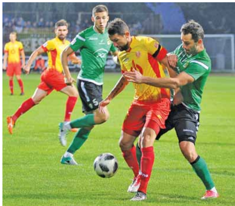
Znicz wygrał czwarty mecz w sezonie