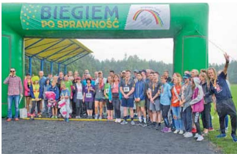
Rodzinna fotka na pożegnanie

Zawodnikom nie przeszkadzała nawet drobny deszcz, który schładzał