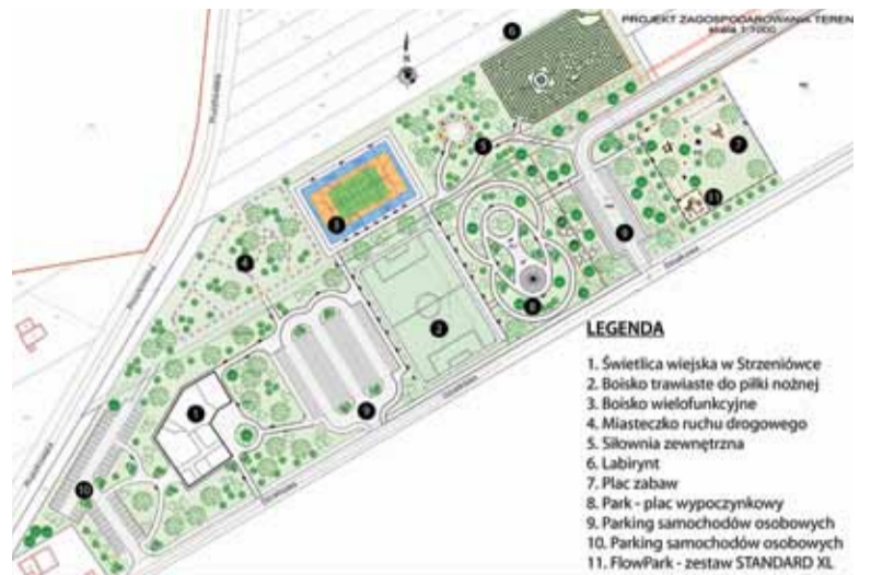
Projekt zagospodarowania kompleksu sportowo-edukacyjno-rekreacyjnego w Strzeniówce

Zaplanowano tu budowę świetlicy wiejskiej i parku z placem wypoczynkowym, dwóch boisk sportowych – trawiastego do piłki nożnej oraz wielofunkcyjnego, a także zewnętrznej siłowni. Najmłodszych ucieszy z pewnością labirynt, FlowPark, oraz plac zabaw. Planowane jest też utworzenie miasteczka ruchu drogowego.