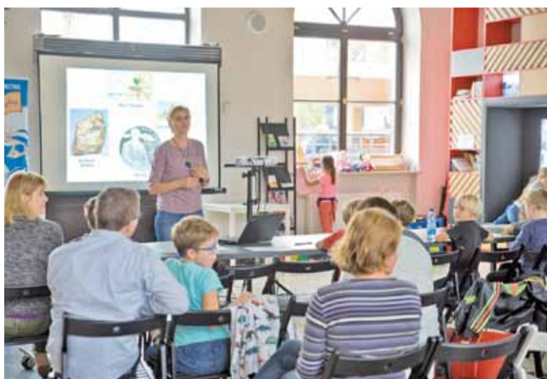
Spotkanie z kulturą Chile

Chile okazało się niezwykle interesującym krajem. Podczas prezentacji, prowadzonej przez rodowitą Chilijkę, dzieci dowiedziały się o położeniu kraju. Mogły także posłuchać, jacy ludzie tam mieszkają, co jedzą, jak się bawią, a także np. dlaczego wrzesień jest dla mieszkańców najważniejszym miesiącem w roku.