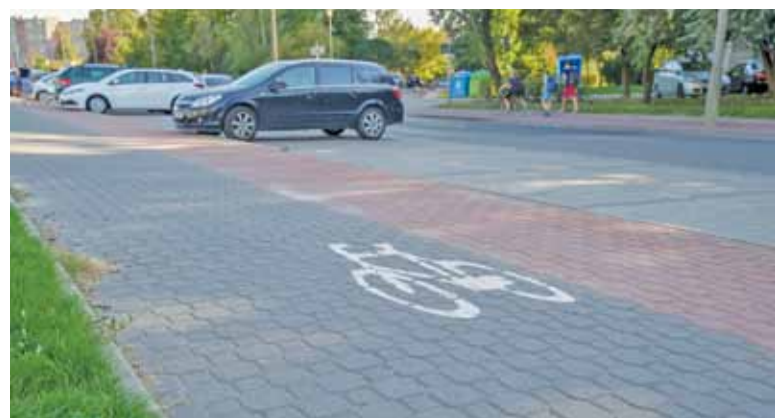
W Pruszkowie przybywa tras rowerowych