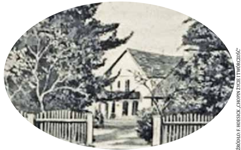
Żelazowa Wola – dworek

i wsparciem króla, firmę specjalizującą się w handlu winem. Spółkę dla łatwości wymawiania przez Francuzów nazwali „Ferrand, et Chopin”. Mikołaj Szop, zmienił nazwisko na francuskie, ożenił się z Francuzką i spłodził z nią dzieci, w tym syna imieniem Jean Jacques. Najmłodszy syn Jeana Jacques’a Chopina Nicolas to właśnie Mikołaj Chopin, ojciec kompozytora Fryderyka. Gdy Mikołaj miał 17 lat, przyjechał do Polski z jednym ze swoich krewnych i został zatrudniony jako rachmistrz w wytwórni tabaki. Wydarzenia z czasów drugiego rozbioru Polski i związane z nim bankructwa tysięcy firm spowodowały, że Mikołaj stracił pracę. Wtedy zdecydował, że wróci do Francji, ale rozchorował się i podróż była niemożliwa. Już jako rekonwalescent zaciągnął