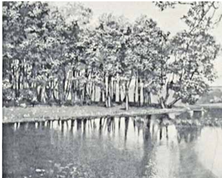
Żelazowa Wola – staw