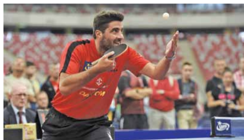
FOT. DARTOM BOGORIA GRODZISK MAZOWIECKI