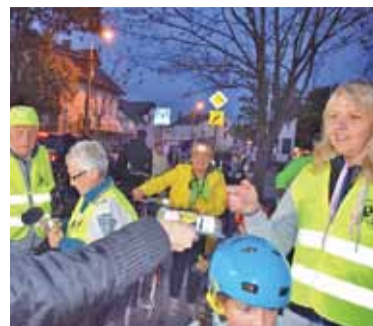
Przed wyruszeniem na trasę wszyscy uczestnicy otrzymali elementy odblaskowe