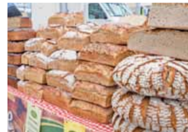
Chleb jest symbolem dożynkowego święta

Przed estradą prezentowane były wieńce dożynkowe, pracowicie uwite