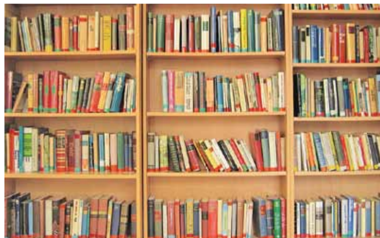
W bibliotekach przybędzie książek

Warto promować czytelnictwo wśród dzieci i młodzieży, ponieważ jest to doskonała płaszczyzna poznawania