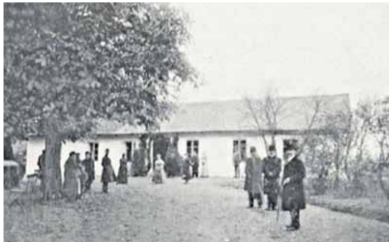
Żelazowa Wola – oficyna, w której zamieszkali Chopinowie po ślubie, tu urodził się Fryderyk