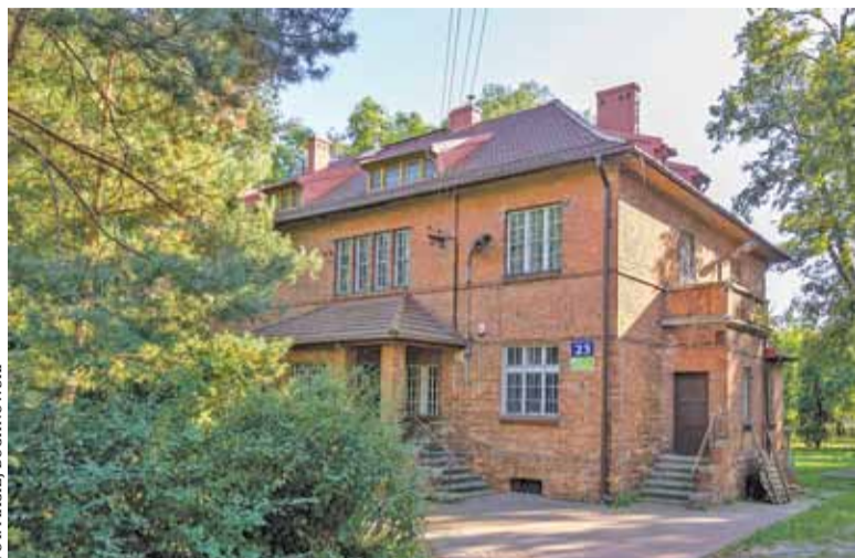
Willa Millera wymaga remontu, aby mogła nadawać się do użytkowania