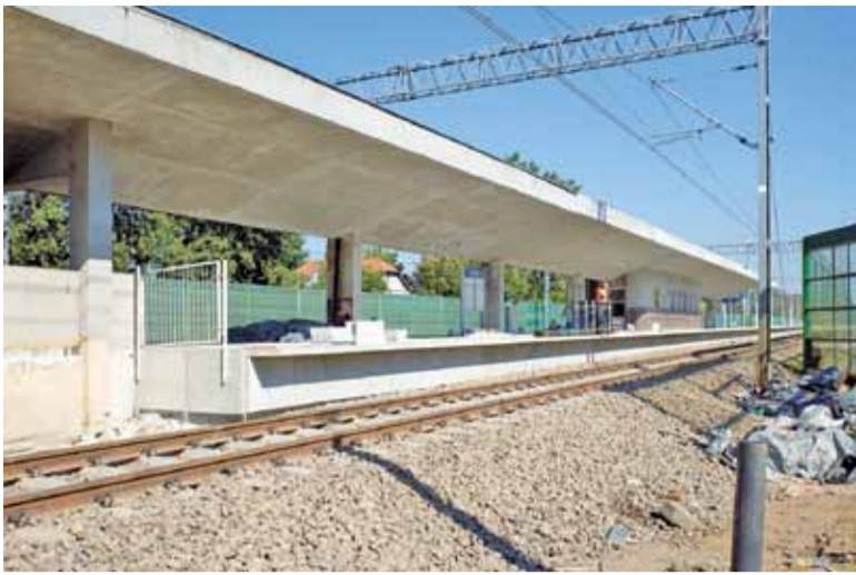
Na stacji Brwinów wciąż trwają prace wykończeniowe