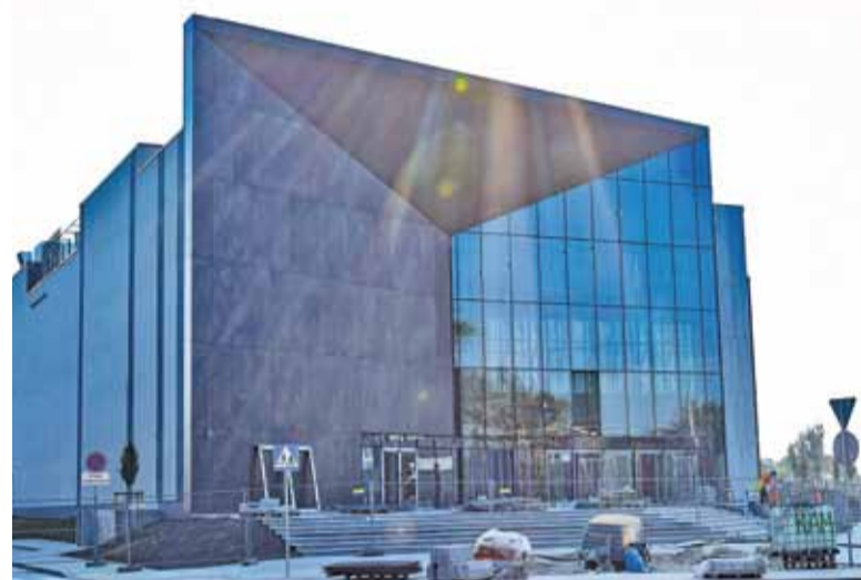
Na budowie trwają ostatnie prace wykończeniowe