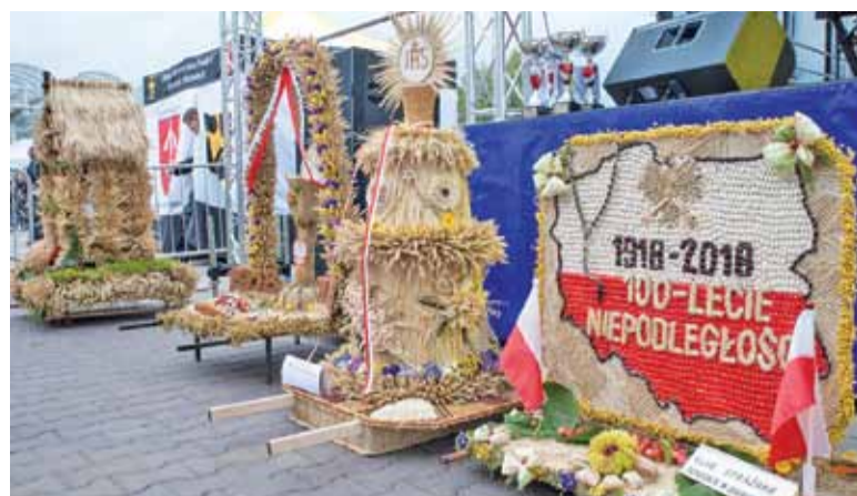
Tegoroczne wieńce oprócz tradycyjnych form nawiązywały również do aktualnych wydarzeń