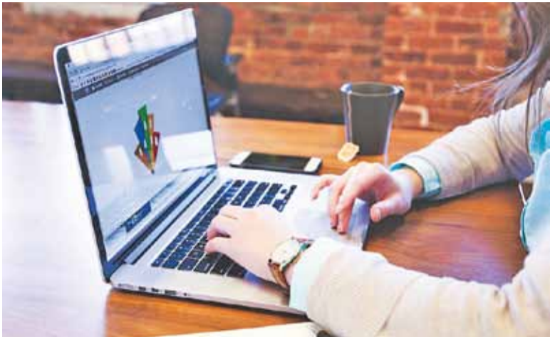
Szybki Internet ma objąć ponad 6 tys. gospodarstw