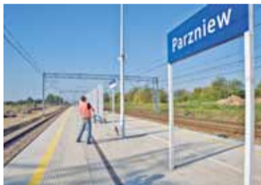
Nowo powstała stacja Parzniew

Przejazd trasą LK 447 pokazał, że prace wciąż trwają, więc wciąż mogą pojawiać się utrudnienia dla pasażerów. Najważniejsze jest jednak to, że pociągi wracają na tory i czas dojazdu do Warszawy ulegnie znacznemu skróceniu. Czas przejazdu z Grodziska do Warszawy będzie wynosił ok. 35 minut.