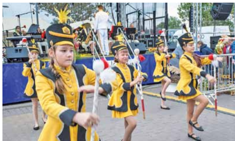
Młodzieżowa Orkiestra Dęta z uroczymi mażoretkami prezentuje się bardzo kolorowo