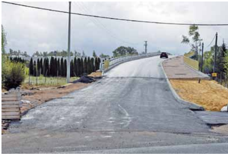
Przy wjeździe na wiadukt w Nadarzynie nie ma znaków B1, więc zgodnie z prawem ruch odbywa się legalnie