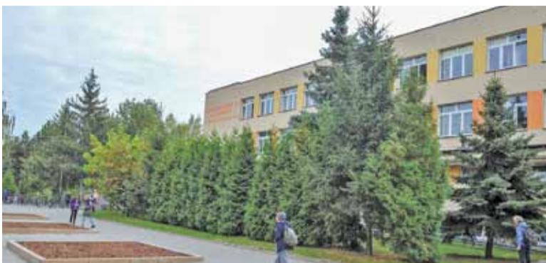
Lodowisko ponownie stanie na terenie Szkoły Podstawowej przy ul. Jasnej