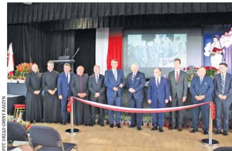
Uroczyste otwarcie kompleksu w Ładach