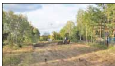
||| Brwinów - Ruszyła budowa przedszkola

P R U S Z K Ó W ||| P I A S T Ó W ||| B R W I N Ó W ||| M I C H A Ł O W I C E ||| N A D A R Z Y N ||| R A S Z Y N G R O D Z I S K M A Z O W I E C K I ||| B A R A N Ó W ||| J A K T O R Ó W ||| P O D K O W A L E Ś N A ||| M I L A N Ó W E K ||| Ż A B I A W O L A