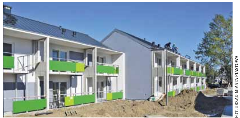
Prace są na finiszu

Z deficytem mieszkań komunalnych zmagają się wiele samorządów. Piastów stworzył Wieloletni Program Gospodarowania Mieszkaniowym Zasobem Gminy, w którym podkreślano konieczność wybudowania nowych lokali. To był pierwszy ważny krok na drodze do podjęcia inwestycji. W 2016 r. piastowski magistrat miał już odpowiednie pozwolenia i projekt. Inwestycja nie wystartowała, bo trzeba