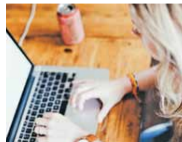
Szkolenia mają zwiększyć cyfrowe kompetencje mieszkańców

Może się wydawać, że korzystanie z sieci stało się niemal codziennością. Z pewnością tak jest w przypadku ludzi młodych, jednak dla osób starszych Internet ma wiele tajemnic. Dlatego nie brakuje programów, które pomagają poszerzyć wiedzę w zakresie korzystania z sieci. Program „J@ w