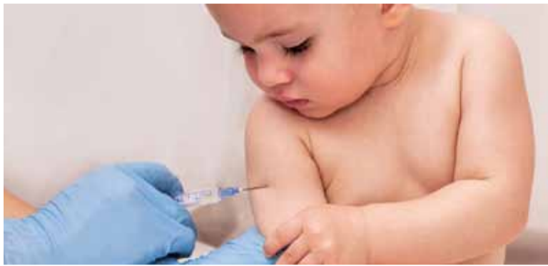
Dzięki szczepieniom pokolenie dzisiejszych rodziców nie wie nawet, przed czym szczepienia chronią populację