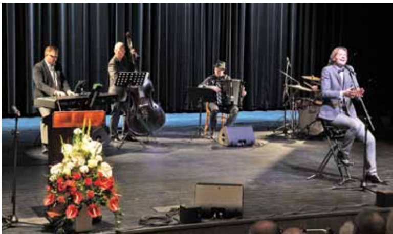
Publiczność nuciła wraz z zespołem piosenki Mieczysława Fogga