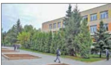
||| Pruszków - Miasto uruchomi lodowisko