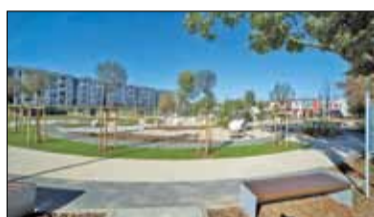
||| Grodzisk Mazowiecki - Kolejny park oddany