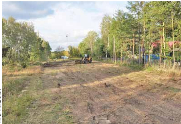
Na placu budowy rozpoczęła się niwelacja terenu. Wkrótce ruszą roboty budowlane

Nowe przedszkole powstaje w centrum Żółwina, za placem zabaw zlokalizowanym w pobliżu skrzyżowania ulic Nadarzyńskiej oraz Kasztanowej. Zaprojektowany budynek jest obiektem parterowym z zagospodarowanym poddaszem. Przedszkole będzie miało 6 oddziałów i będzie w stanie przyjąć 150 dzieci. Komunikacja między kondygnacjami odbywała się będzie nie tylko klatką schodową, ale również