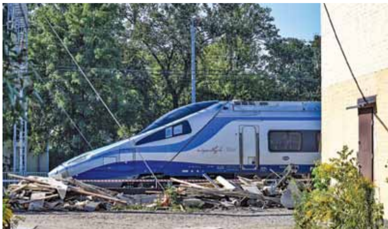
Korekta rozkładu będzie obowiązywać do 8 grudnia