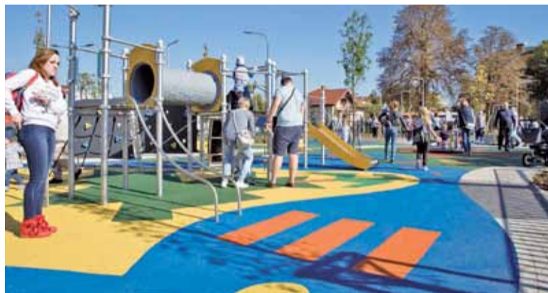
Plac zabaw dla dzieci cieszy się niesłabnącym zainteresowaniem

miasta teren sprzedać za duże pieniądze i powstałyby tutaj kolejne bloki – mówił