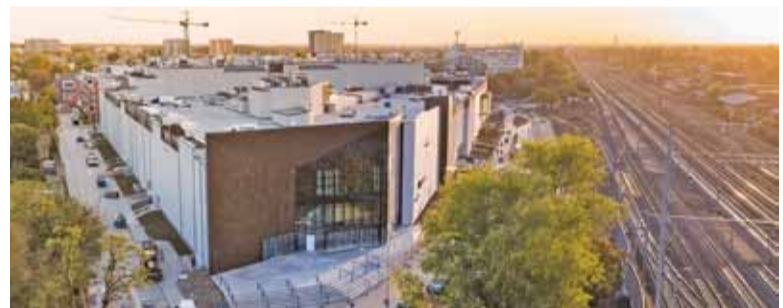
Budowa nowej galerii handlowej została już zakończona

P przed dwoma tygodniami mowa była o otwarciu nowej galerii handlowej na terenie Pruszkowa jeszcze w październiku. Pod koniec ubiegłego tygodnia inwestor podał jednak oficjalną datę otwarcia Nowej Stacji – 10 listopada o godzinie 10.00. Tego dnia zaplanowano oczywiście specjalne atrakcje, konkursy, zabawy i niespodzianki dla