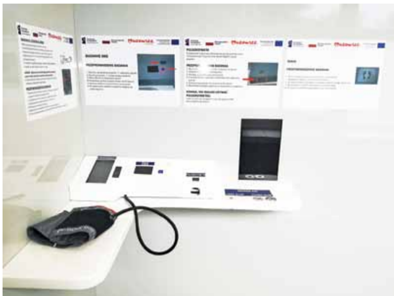
Platforma Telemedyczna – Urządzenie zainstalowane w grodziskiej Mediatece