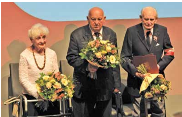
Duma i wzruszenie towarzyszyły wyróżnionej trójce pruszkowian