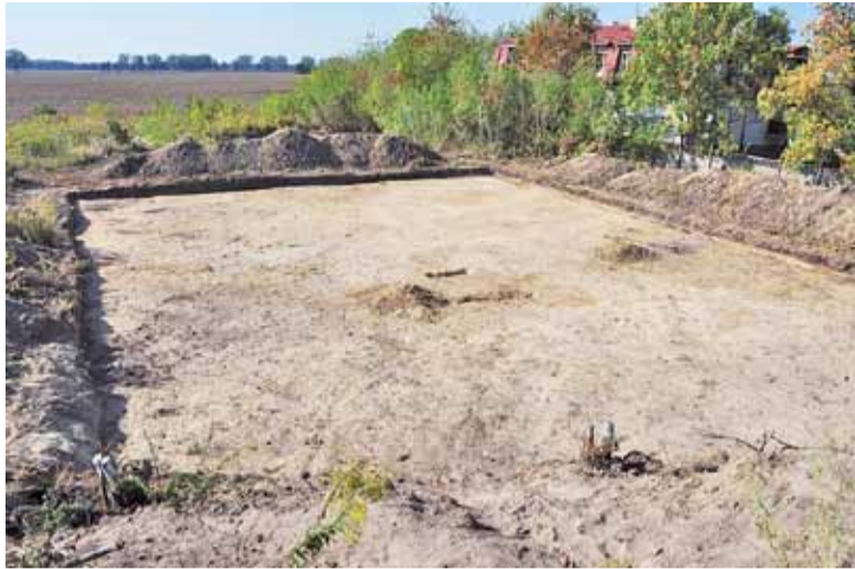
Teren, na którym pracowali archeolodzy, został już udostępniony inwestorowi