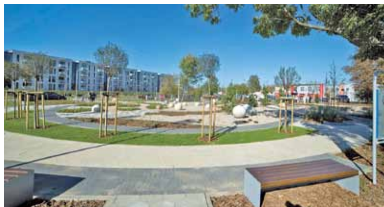
Park przy Bałtyckiej jest pięknie zaprojektowany

przez dzieci urządzeń i z całą pewnością będzie się cieszył niesłabnącą frekwencją.