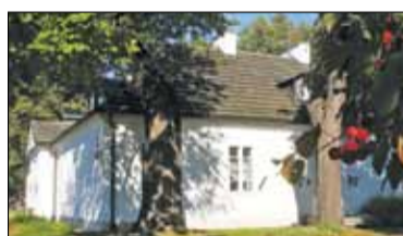
||| Historia dworu w Jordanowicach cz. 2