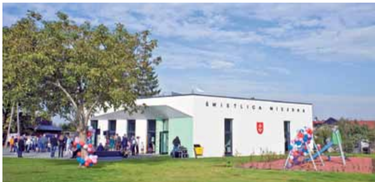
Świetlica i plac zabaw przy niej to znakomita propozycja na spędzenie wolnego czasu dla mieszkańców w każdym wieku