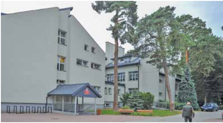
Zespół Szkół w Komorowie