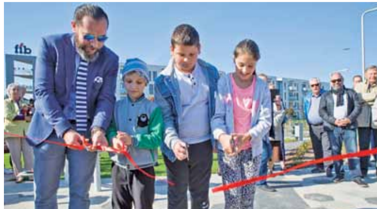
Wstęga przecięta – kolejny park oddany został do użytku mieszkańcom

Nowo oddany park jest pięknie zaprojektowany i bardzo funkcjonalny. Znalazł się tutaj plac zabaw dla dzieci, który już jest tłumnie odwiedzany przez maluchy. Cały plac wyłożony jest miękką wykładziną gumową, więc nawet gdy zdarzy się upadek, dziecku nie stanie się krzywda. Plac zabaw wyposażony został w wiele lubianych