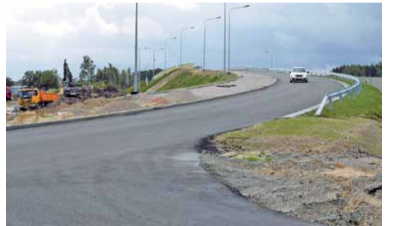
Podobnie sytuacja wygląda na wiadukcie w Urzucie

Od tygodnia zachęeni prawie ukończonym wiaduktem w Nadarzynie mieszkańcy już z niego korzystają. Tutaj również zniknęły znaki B1, co wszyscy odebrali jako sygnał jeżeli nie