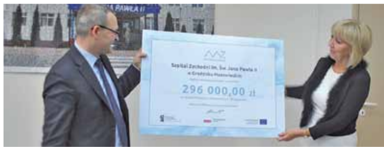
Sygnatariusze umowy prezentują symboliczny czek