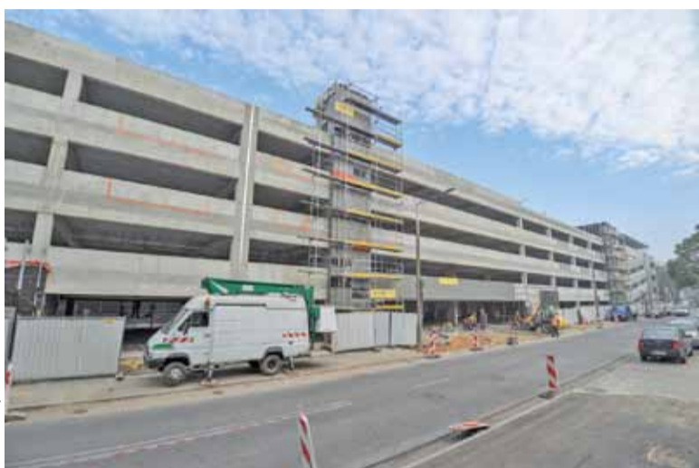
Parking przy ul. Sienkiewicza z zewnątrz