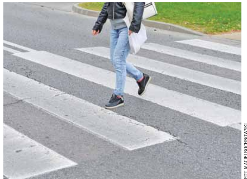
Piesi muszą być ostrożni w każdej sytuacji