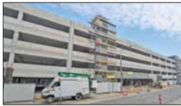
||| Pruszków - Kiedy parkingi będą gotowe? s. 5