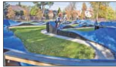
||| Grodzisk Mazowiecki - Najdłuższy pumtrack w Polsce s. 6