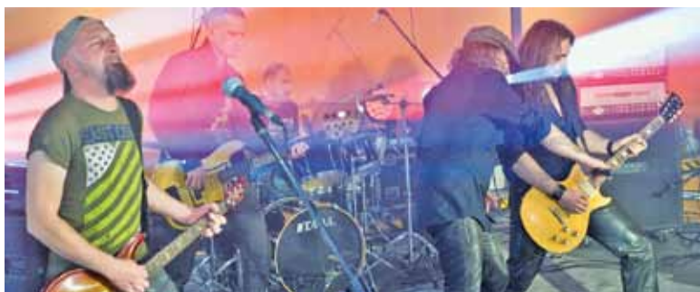
Podczas uroczystości otwarcia zagrały zespoły rockowe