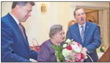
||| Brwinów - Honorowi obywatele s. 2

GRODZISK MAZOWIECKI ||| BARANÓW ||| JAKTORÓW ||| PODKOWA LEŚNA ||| MILANÓWEK ||| ŻABIA WOLA P R U S Z K Ó W ||| P I A S T Ó W ||| B R W I N Ó W ||| M I C H A Ł O W I C E ||| N A D A R Z Y N ||| R A S Z Y N