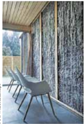
Austeria stanie się miejscem relaksu

no-kulturalnej. Obecnie trwa pierwszy etap, polegający na odrestaurowaniu budynku zasadniczego Austerii. Trwają prace modernizacyjne, które obejmują m.in. wybudowanie klatek schodowych, zamontowanie ogrzewania, wentylacji