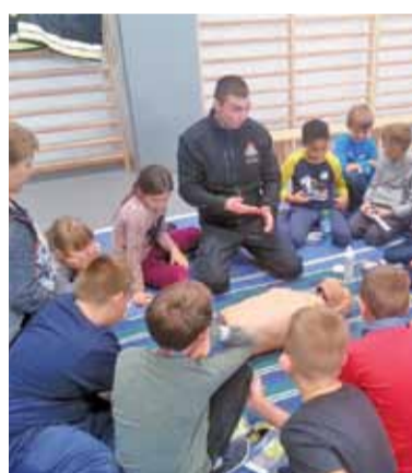
Uczniowie brwinowskiej SP nr 1 podczas zajęć z resuscytacji krążeniowo-oddechowej

Pierwszy panel był prowadzony przez egzaminatorów Wojewódzkiego Ośrodka Ruchu Drogowego. Prowadzący wyjaśnili zasady bezpiecznego