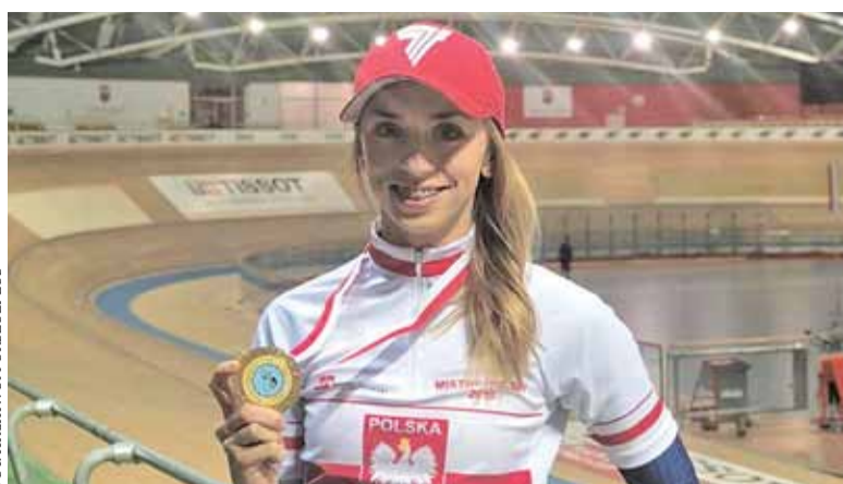
Szczęśliwa mistrzyni Polski