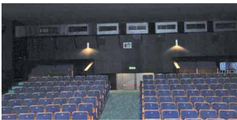
Wygląd sali kinowej po remoncie

Małe kina mają swój klimat i nadal przyciągają widzów, choć ciężko im konkurować z multipleksami. Piastowska Baśń na przestrzeni ostatnich lat przeszła przemianę. W 2014 r. wymieniono projektor analogowy na cyfrowy, pojawiły się również nowe fotele. Z pewnością wzrósł komfort oglądania filmów, ale na tym nie poprzestano. Modernizacja pomieszczenia zaadaptowanego na nową siedzibę kasy została przeprowadzona w 2017 r. Wtedy rów-