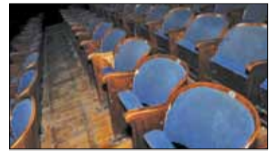
||| Piastów - Przemiana kina Baśń s. 7