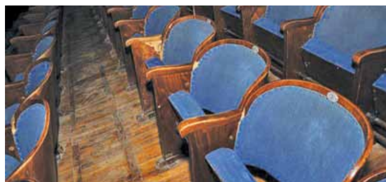
Tak wyglądały fotele w sali kinowej

niez wdrożono pierwszy etap systemu klimatyzacji.