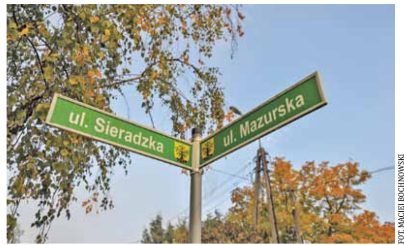
Budynek powstanie przy ul. Sieradzkiej