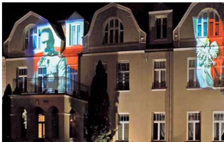
Patriotyczne motywy będą zdobiły elewację ratusza do końca listopada