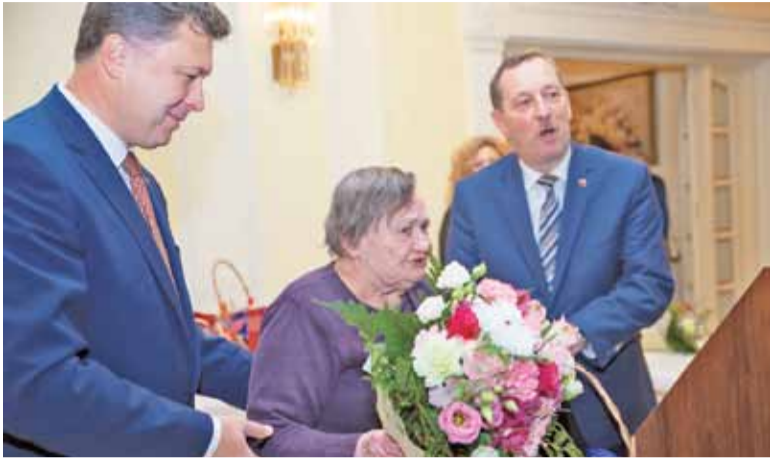
Wyróżnienia wręczyli przewodniczący Rady Miejskiej oraz burmistrz Brwinowa