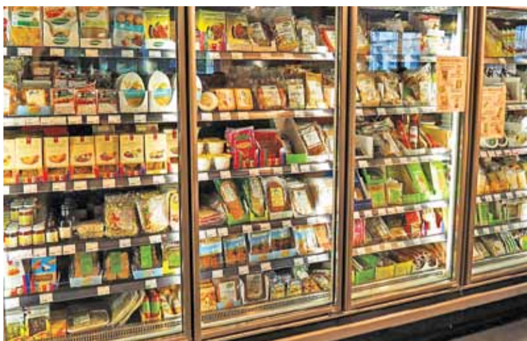
Unia pracuje nad regulacjami dotyczącymi różnicy jakości produktów na różnych rynkach