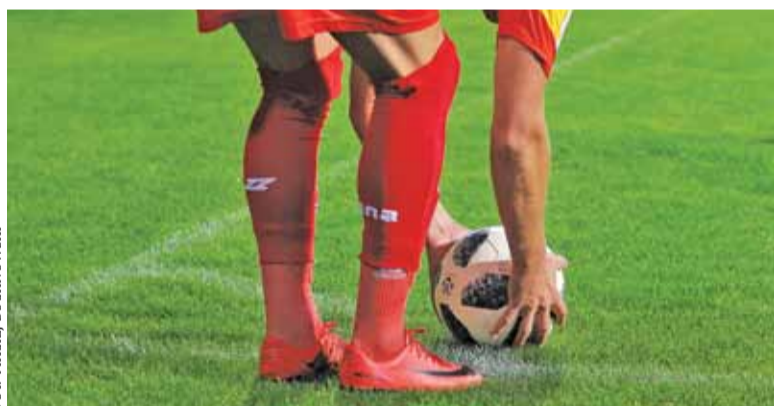
Znicz zremisował szósty mecz w sezonie