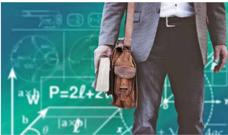
Wielu nauczycieli motywuje pasją. Ważne, by „system” nie zdołał jej w nich zabić