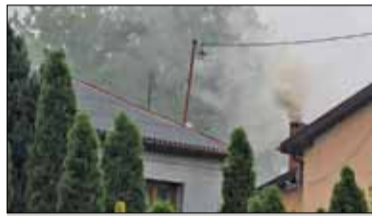
||| Powiaty - Idzie zima, a z nią smog s. 4