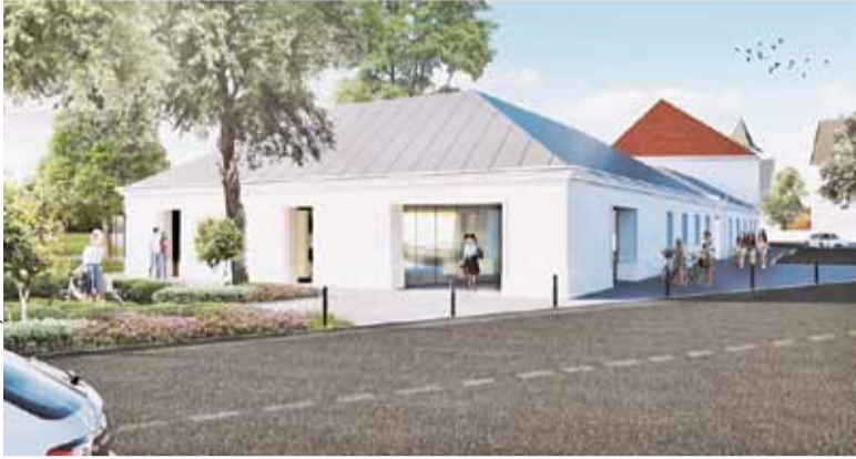
Tak ma wyglądać Austeria z zewnątrz