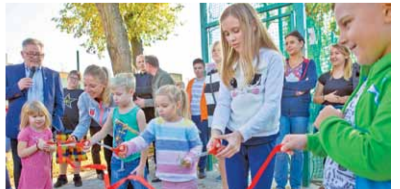
Przecięcie wstęgi sprawiło dzieciom ogromną przyjemność

W ramach inwestycji wykonane zostaną również prace związane z zagospodarowaniem terenu. Powstały