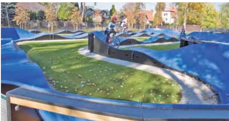
Grodzki tor jest znakomitą propozycją dla jeżdżących na rowerach, rolkach, deskorolkach i hulajnogach