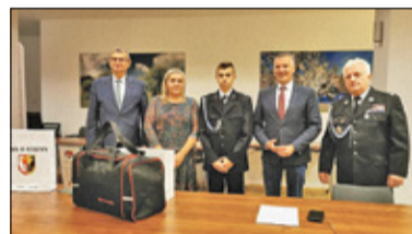
||| Raszyn - 15-letni Strażak Miesiąca nagrodzony s. 2