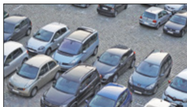
||| Komorów - W Komorowie powstanie parking s. 3