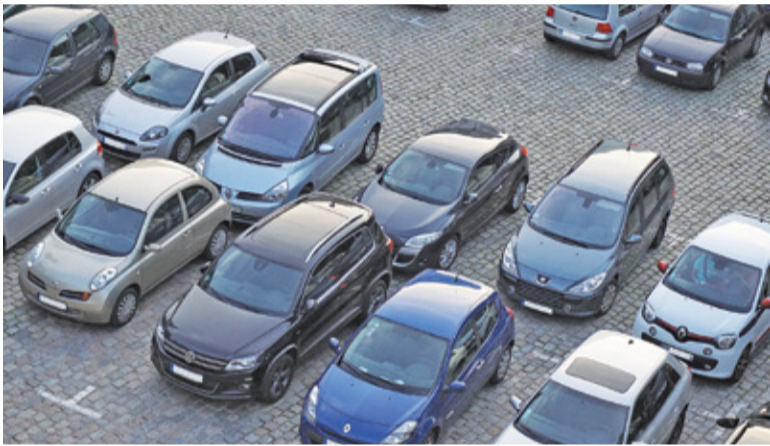
W ostatnich latach w wielu miejscowościach powstają parkingi „Parkuj i Jedź”

Gmina Michałowice przeprowadziła postępowanie przetargowe, w którym zgłosiły się cztery firmy. Wykonawca za realizację zadania zarobi blisko 885 tys. zł. Warto dodać, że inwestycja będzie wykonywana w formule „zaprojektuj i wybuduj”. Parking ma być gotowy do 15 czerwca 2021 roku, jednak do połowy grudnia zostanie opracowana dokumentacja, a także uzyskana decyzja administracyjna zezwalająca na reali-