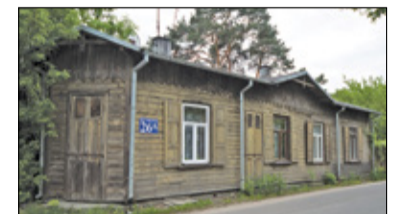
||| Mazowsze - Dziedzictwo w obiektywie s. 6