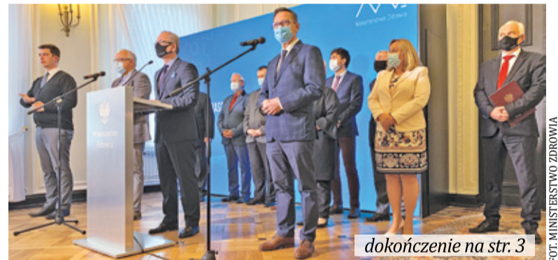
Resort zdrowia wprowadził nowe obostrzenia i zapowiedział zwiększenie liczby łóżek szpitalnych dla chorych na COVID-19

Przypomnijmy: do strefy czerwonej kwalifikują się powiaty, w których liczba zakażeń w ciągu ostatnich 14 dni (łącznie) przekroczyła 12 przypadków na 10 000 mieszkańców. Strefa żółta