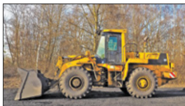
||| Grodzisk Mazowiecki - Skrzyżowanie już zamknięte s. 4