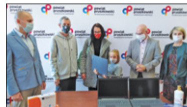
||| Pruszków - Sprzęt dla dzieci za 440 tys. s. 6