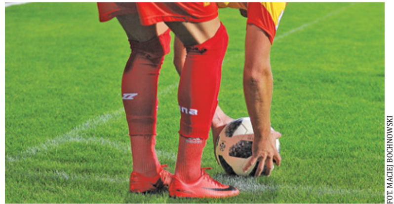
GKS – Znicz 1:1

W 10. kolejce IV ligi doszło do pojedynku Znicza II Pruszków z KS Raszyn.