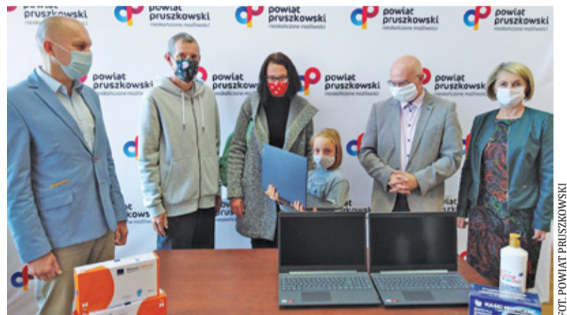
Dzieci otrzymały m.in. komputery, drukarki, skanery, meble czy też maseczki i rękawiczki jednorazowe