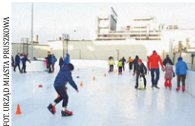
W ubiegłym roku lodowisko funkcjonowało na dachu centrum handlowego Nowa Stacja

Miasto Pruszków już rozpoczęło przygotowania do zimy i szykuje atrakcje dla miłośników łyżew. W ubiegłym roku lodowisko funkcjonowało na dachu centrum handlowego Nowa Stacja.