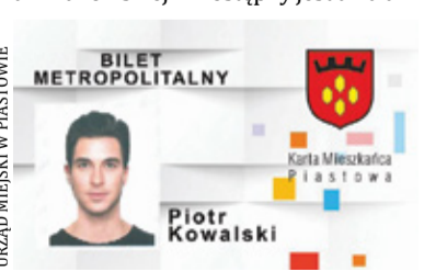
W punkcie można doładować bilet metropolitalny

Mieszkańcy Piastowa korzystający z komunikacji miejskiej zyskali komfortowe rozwiązanie. Punkt Kodowania Biletów został uruchomiony przy al. Krakowskiej 4. Dostępny jest dwa dni