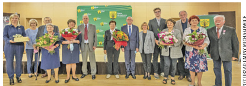
Pięć par otrzymało medale