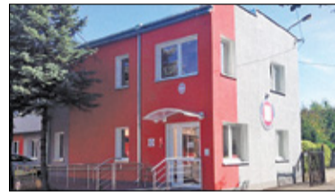
||| Grodzisk Mazowiecki - Zakazany sanepid s. 5