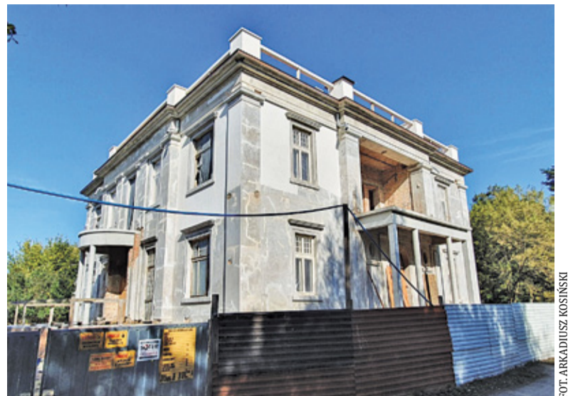
Nowy wykonawca zajmie się m.in. wykończeniem wnętrza, odtworzeniem wykusza, portyku i tarasu

Wykonawcą numer dwa była lubelska firma Vera Artis, która zobowiązała się sfinalizować roboty do czerwca 2020 r. Plany jednak spaliły na panewce: opóźnienia i nieprawidłowości doprowadziły do zakończenia współpracy. – Bezpośrednim powodem wypowiedzenia umowy było złamanie przez wykonawcę warunków umowy i prawa zamówień publicznych. Wykonawca postąpił wbrew warunkom