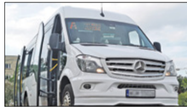
||| Michałowice - Rozwój gminnej komunikacji s. 5