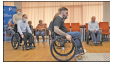
||| Pruszków - Warsztaty dostępności s. 6