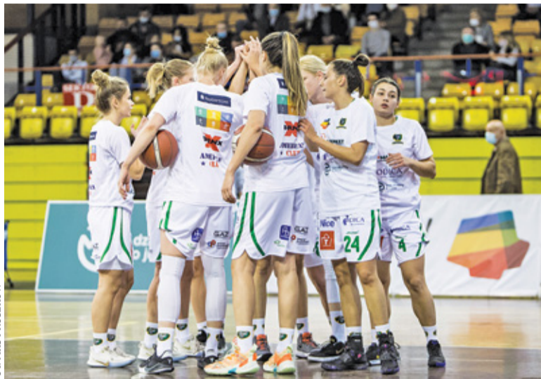
Pruszkowski zespół wygrał pierwszy mecz w sezonie

W dalszej części spotkania gra wyrównała się. KKS Olsztyn walczył, jednak pruszkowianki kontrolowały sytu-