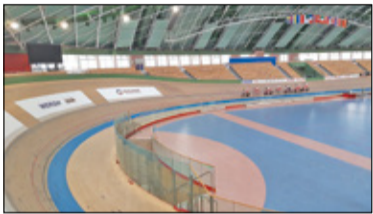
||| Pruszków - Komornik zajął tor kolarski s. 3