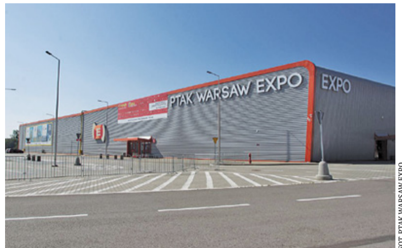
W halach PTAK Warsaw Expo można pomieścić tysiące łóżek i niebędą infrastrukturę dodatkową

- Jesteśmy gotowi, w przypadku nasilającej się pandemii koronawirusa,