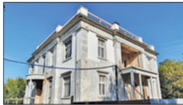
||| Brwinów - Do trzech razy sztuka? s. 4