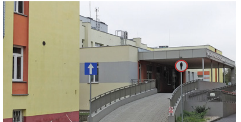
Szpital Powiatowy w Pruszkowie

Oba zadania są rozległe, ale i kosztowne. Realizacja inwestycji ma zapewnić polepszenie warunków dla pacjentów w przypadku szpitala, zaś nowy ośrodek to szansa na lepsze standardy i możliwości dla dzieci i młodzieży. Mogą pojawiać się obawy, czy koronawirus nie pokrzyżuje planów i nie wpłynie na postępy prac. Tak się jednak nie dzieje. Urzędnicy zapewniają, że działania związane z rozbudową szpitala nie zostały w żaden sposób ograniczone. Obecnie wykonywane są izolacje na ele-