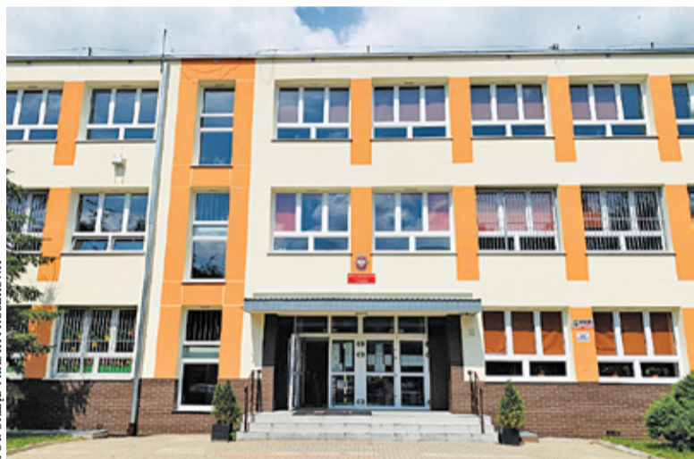
Szkoła Podstawowa nr 4

stawowej nr 4 oraz w najbliższym czasie przeprowadzić analizę możliwości zadania wybranego boiska szkolnego wraz z jego modernizacją. Obie te inwestycje chcielibyśmy wykonać w 2021