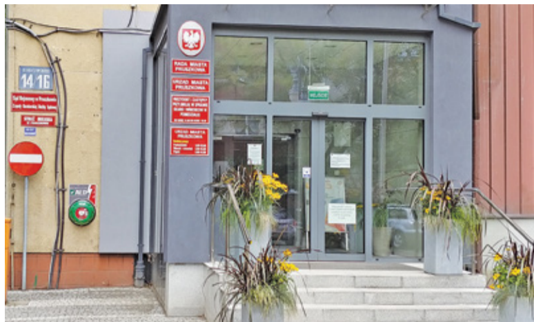
16 radnych było za przyjęciem uchwały