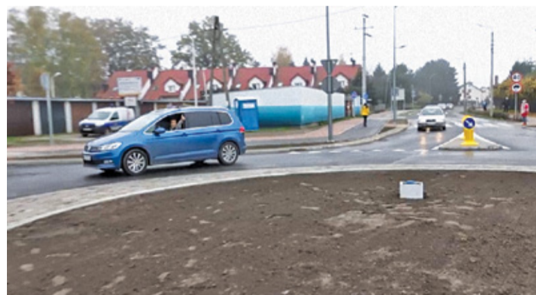
Spowolnienie ruchu w tym miejscu wpłynie na poprawę bezpieczeństwa dzieci uczęszczających do pobliskiego zespołu szkół