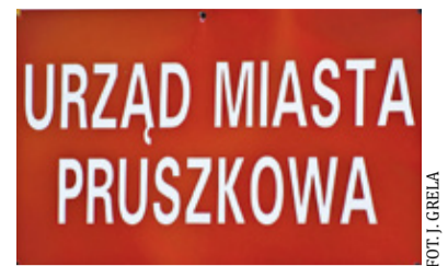
W urzędach załatwimy sprawy pilne

We wtorek nowe zasady funkcjonowania ogłosiły m.in. urzędy w Pruszkowie, Żabiej Woli czy Podkowie Leśnej. – W związku z rosnącą liczbą osób zakażonych wirusem SARS-CoV-2 (tzw. koronawirusem), w trosce o zdrowie i bezpieczeństwo mieszkańców oraz pracowników Urzędu Miasta Pruszkowa, od 3 listopada 2020 roku do odwołania, ulega zmianie sposób obsługi interesantów w budynku UM przy ul. Kraszewskiego 14/16 w Pruszkowie, w budynku Urzędu Stanu Cywilnego mieszczącego się na pl. Jana Pawła II 1 w Pruszkowie oraz w Punkcie Obsługi Mieszkańców przy ul. Sienkiewicza 2 w Pruszkowie – poinformował pruszkowski magistrat. Osobiste wizyty w urzędzie ograniczo-