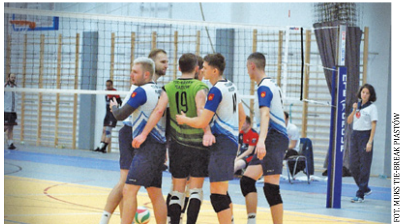
MUKS zaczął sezon od zwycięstwa

W kolejnym starciu do Piastowa przyjechał SPS Volley Ostrołęka. Tym razem gospodarze nie mieli powodów do zadowolenia. Mecz trwał zaledwie trzy sety, ale karty rozdawali przyjezdni. MUKS nie miał zbyt wiele do powiedzenia. Gospodarze przegrali do 21, 22, 18.