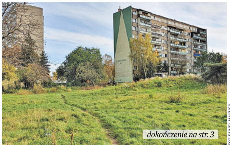
Teren przy ulicy Dobrej

Plany zagospodarowania przestrzennego terenów przy ul. Dobrej i przy ul. Spacerowej w Pruszkowie do zmiany. Jak podaje prezydent Paweł Makuch, dzięki temu nie zostaną one zabudowane.