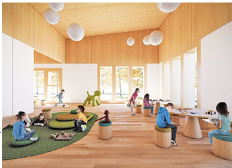
Przedszkole ma być nowoczesne

Samorząd ma również kolejne plany rozwoju bazy oświatowej. – Po wy-