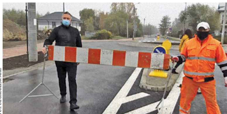
Zamiast symbolicznego przecięcia wstęgi w sobotę symbolicznie... usunięto barierki

Szybki finał prac cieszy szczególnie, jeśli wspomnimy perypetie związane z przygotowaniem do inwestycji. Przebudowę planowano już kilka lat temu, jednak z uwagi na remont linii kolejowej 447 pomysł trzeba było odłożyć w czasie. Wiadomo było bowiem, że ograniczenia w ruchu kolejowym skłonią część mieszkańców do przesiadania się do samochodów i w rezultacie przyczynią się do zwiększenia ruchu na drogach. Kiedy prace na kolei dobiegły końca, okazało się, iż wygasły pozwole-