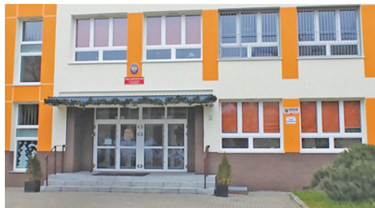
Szkoła Podstawowa nr 4

Z kolei w Szkole Podstawowej nr 10 koronawirusa miał jeden z nauczycieli. Oddział, w którym pracował, trafił na kwarantannę. O wszystkim dyrekcja placówki poinformowała magistrat i