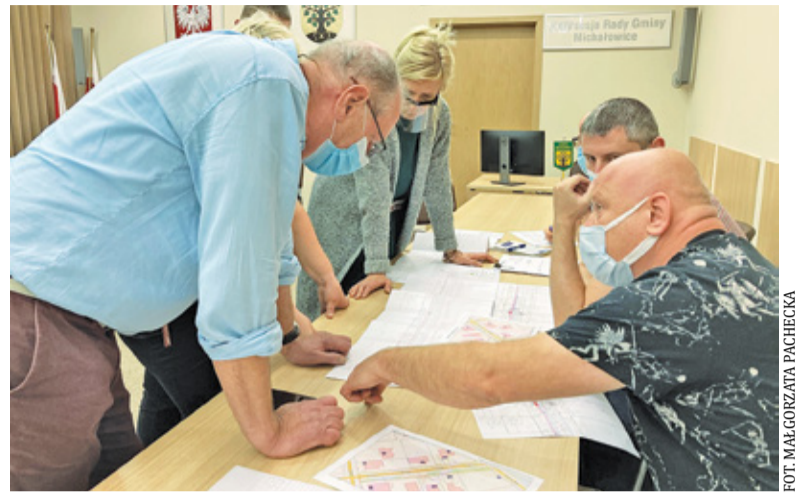
Spotkanie Rady Rowerowej

W wielu miejscowościach sprawdza się system roweru miejskiego. Z takim rozwiązaniem w ubiegłych latach mieli okazję zapoznać się mieszkańcy gminy Michałowice. Ponadto, samorząd pra-