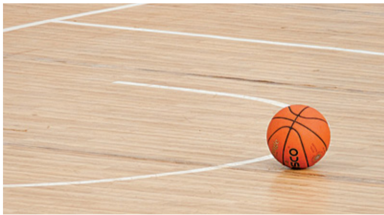
Elektrobud rozegrał dotychczas cztery spotkania – dwa wygrał, dwa przegrał

W końcu nadszedł czas na I-ligowe zmagania. 31 października w ramach 7. kolejki Elektrobud spotkał się z TS Wisłą Chemart Kraków. Mecz lepiej rozpoczął się dla gospodarzy, którzy