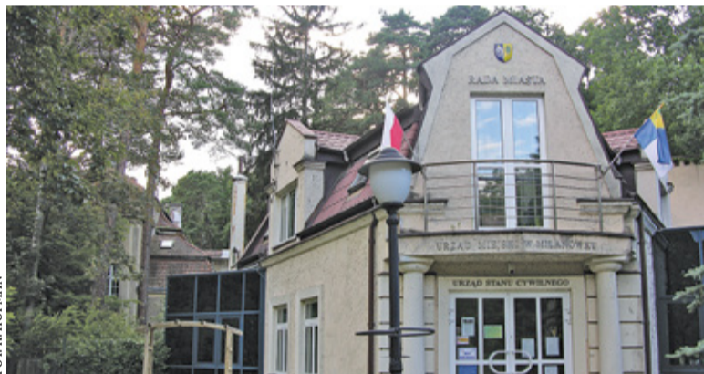
Urząd Miasta Milanówka pracuje zdalnie już od 12 października