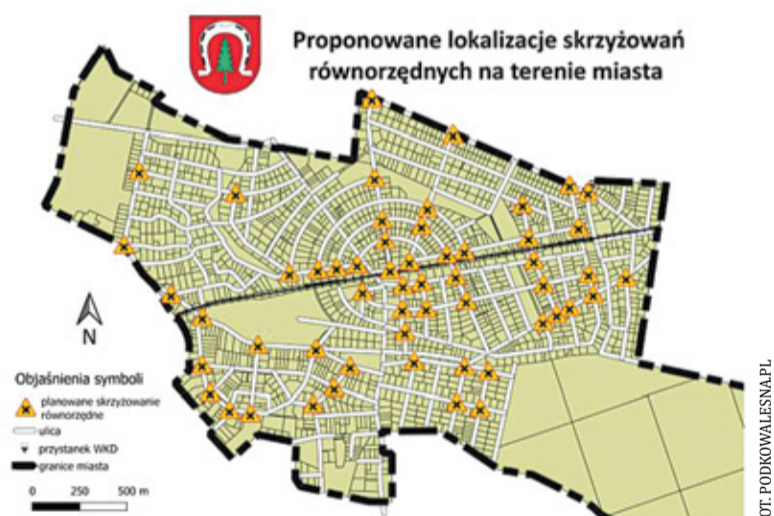
Wprowadzenie zasady równorzędności miałooby na celu zmuszenie kierowców do zdjęcia nogi z gazu

Rozpoczęte 2 listopada konsultacje mają na celu opracowanie zmian, które pozwolą zwiększyć bezpieczeństwo na drogach. – Mimo przyjęcia w wyniku konsultacji społecznych zasady dotyczącej nowo projektowanych dróg, a tyczącej się stosowania fizycznych środków spowolnienia ruchu (progi, skrzyżowania wyniesione, czy szczykany) i organizacji ruchu (strefy zamieszkania) nadal w wielu miejscach nie osiągnęliśmy satysfakcjonującego nas dzisiaj efektu. Z perspektywy czasu widać, że niektóre rozwiązania, mimo