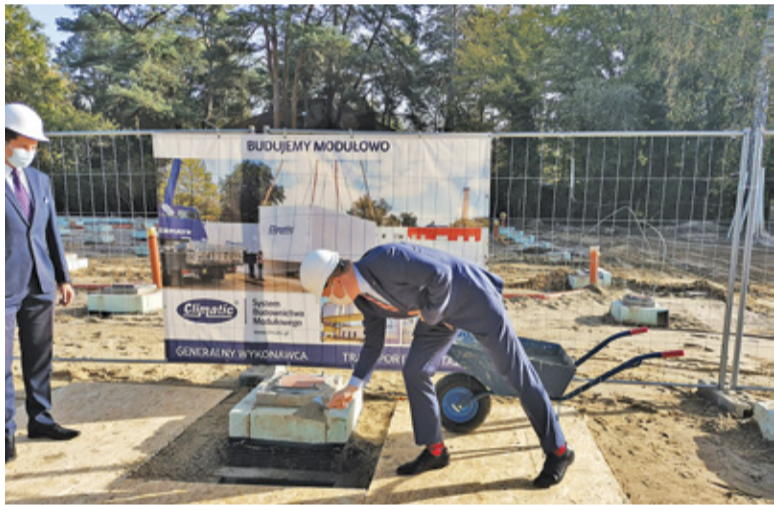
Podczas uroczystości w fundamentach ukryto „kapsułę czasu” z pamiątkami z teraźniejszości

Na tę inwestycję czekało wielu rodziców. Stan dawnego budynku Przedszkola Miejskiego im. Krasnala Hałabały od dawna pozostawiał wiele do życzenia. W dodatku relatywnie niewielka powierzchnia placówki nie wystarczała, by przyjąć wszystkie dzieci w wieku przedszkolnym. Wiadomo więc było od dawna, że inwestycja w budowę nowego przedszkola jest niezbędna.