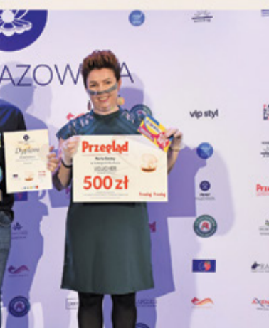
Perła Kultury otrzymała Parapetówka