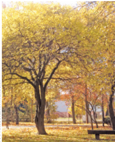
W 2019 roku gmina posadziła 309 drzew

Samorządy dbają o rozwój terenów zieleni, a także nasadzenia, które wzbogacają przestrzeń. Tą drogą podąża gmina Michałowice. Najlepszym dowodem jest liczba posadzonych w ciągu dwóch lat drzew: 656. – Wiosną tego roku posadziliśmy 173 drzewa, m.in. lipy drobnolistne, klony, jesiony, sosny, kasztan-