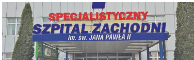
Część środków zostanie przeznaczona na rozbudowę oddziału „covidowego”

Dzięki dotacji udało się już zakupić m.in. 9 kardiomonitörów, ultrasonograf, aparaty do hemodializy czy mobilne urządzenie do dezynfekcji pomieszczeń. Na liście planowanych zakupów znajduje się jeszcze tomograf, system przyzywowy dla oddziału zakaźnego, defibrylatory i inne sprzęty niezbędne