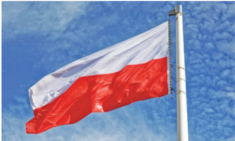
W większości gmin udało się już przekroczyć wymagany próg liczby głosów

Spośród gmin do 20 000 mieszkańców najlepiej w rankingu radzi sobie Żabia Wola, gdzie głosowały dotychczas 182 osoby. 166 głosów oddano w gminie Baranów, a niewiele mniej, bo 163 głosy akcja zebrała w Michałowicach. Maszty staną również w Nadarzynie – tu zgłoszono 119 osób – oraz w Jaktorowie, gdzie zebrano 110 głosów. Na tym