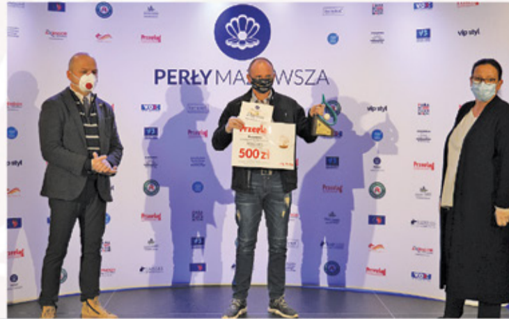
Prezes Stowarzyszenia Kondycja odebrał nagrodę Perły Sportu gminy Piaseczno za imprezę Frog Race