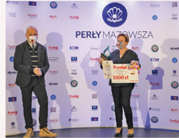
Nagrody w kategoriach: Przedsiębiorczość gminy Piaseczno, p oraz Mazowsza otrzymał Hotel De Silva