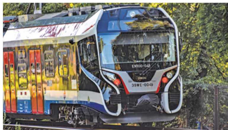
Wycinka ma związek z budową nowego toru WKD