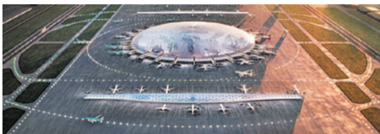
Do sporządzenia masterplanu chętne są trzy międzynarodowe konsorcja