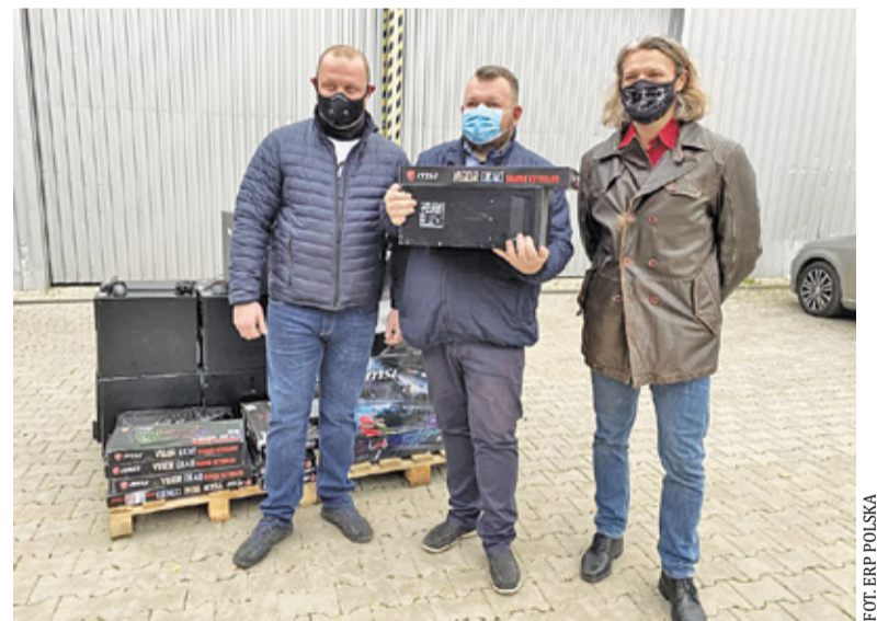
Komputery spędzą swoje drugie życie w domach grodziskich uczniów

Teraz organizacja zawitała również do Grodziska. W ramach współpracy z firmą Terra Recycling udało się naprawić 10 komputerów. Sprzęt trafił już do rodzin wytypowanych przez Ośrodek