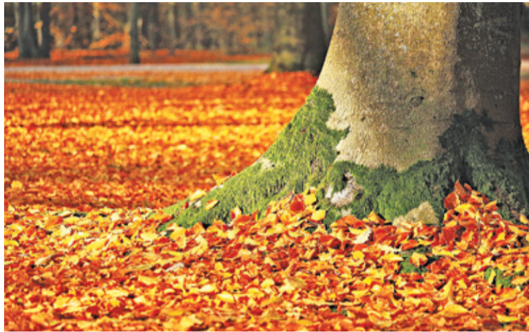
Mieszkańcy mogą bezpłatnie pozbyć się 10 dużych worków odpadów zielonych

Z nieodpłatnym odbiorem wiązać się też limity. – Z każdej nieruchomości mieszkańcy mogą wystawić do 10 worków 120-litrowych o wadze do 20 kg każdy. Worki z większą wagą oraz uszkodzone nie będą odebrane. Odpady wystawione przed posesję, a nie zgłoszone w terminie, nie zostaną odebrane – informują urzędnicy. Część mieszkańców nie podoba się ograniczenie ilości worków. – Rośnie u nas 12 dużych dębów i ze 20 rozmaitych brzoź,