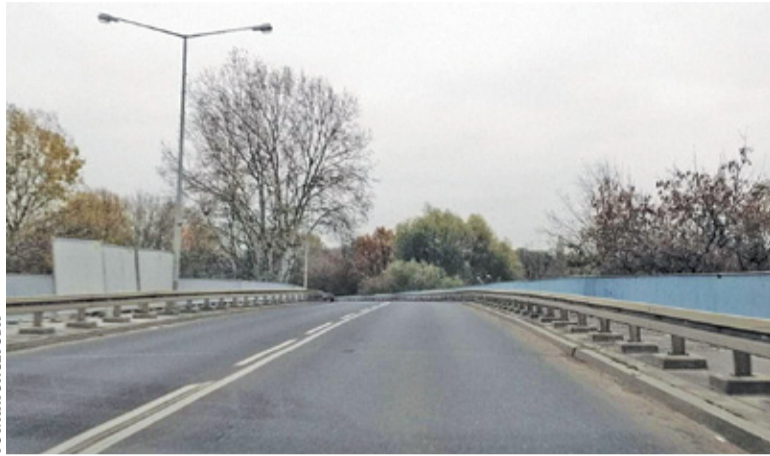
Wiadukt w ciągu DW 718