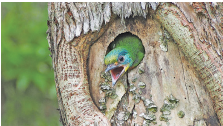
Prace muszą dobiec końca przed rozpoczęciem sezonu lęgowego

nowana już od dłuższego czasu inwestycja obejmie przebudowę liczącego 7,5 km długości odcinka między Podkova i Grodziskiem. Obok powstanie drugi tor, w związku z czym niezbędna będzie przebudowa istniejących przejazdów kolejowo-drogowych. Projekt inwestycji zakłada także przebudowę 11 istniejących oraz budowę 5 nowych peronów. W Podkowie zmieni się układ przystanku; pociągi relacji Podkova – Milanówek oraz Podkova – Grodzisk będą zatrzymywać się przy tych samych peronach dzięki nowemu rozjazdowi.