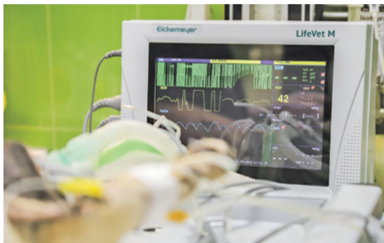
Szpital zakupił już m.in. 9 kardiomonitorów i ultrasonograf

||| Podkowa Leśna - Odbiór limitowany s. 6