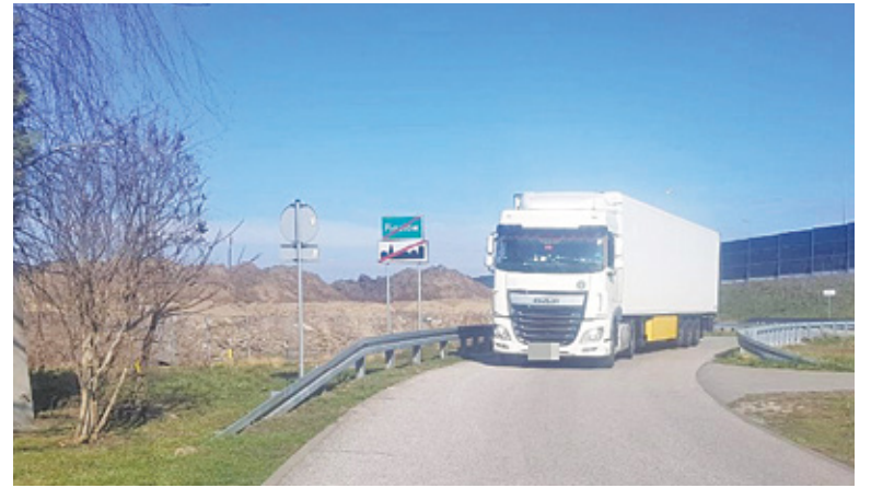
Problem dla mieszkańców stanowi ruch samochodów ciężarowych