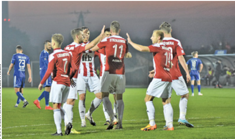
Przełożono dwa starcia Pogoni

Przyczyną takiego stanu rzeczy są przypadki zakażenia koronawirusem, które dotknęły grodziski zespół. W związku z zaistniałym faktem przełożone zostało spotkanie Pogoni z Pelikanem Łowicz zaplanowane na 21 listopada. Również starcie z Błonianką Błonie w ramach 18. kolejki nie odbyło się. – Wobec utrzymujących się przypadków COVID w naszym zespole, Wydział Gier i Ewidencji ŁZPN poinformował,