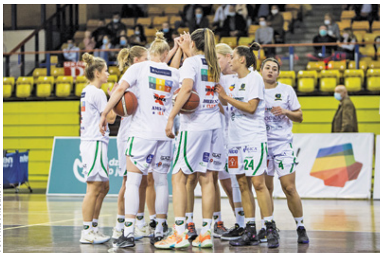
MKS przegrał drugi mecz w sezonie

D obra passa zespołu trwała w najlepszym. Pruszkowskie koszykarki pokonywały kolejnych rywali. Ich licznik zatrzymał się na sześciu wygranych z rzędu. W pokonanym polu MKS pozostawił m.in. UKS Basket SMS Aleksandrów Łódzki (74:63), KKS Olsztyn (98:77), AZS Uniwersytet Warszawski (90:67), Politechnikę Gdańską II (91:55), SMS PZKosz Łomianki (74:51), MPKK Sokołów S.A. Sokołów Podlaski (60:46).