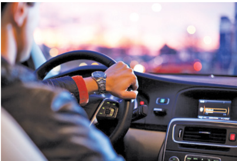
Od 5 grudnia kierowcy nie będą musieli przewozić ze sobą szeregu dokumentów