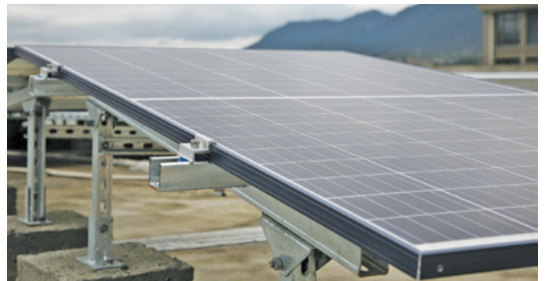
Mieszkańcy otrzymali informacje o możliwości uzyskania dofinansowania

Ponadto samorząd zwraca uwagę, że wszelka korespondencja kierowana do mieszkańców posiada logo gminy. Wszelkie działania urząd ogłasza przez kanały informacyjne w odpowiedniej formie. W zaistniałej sprawie trudno