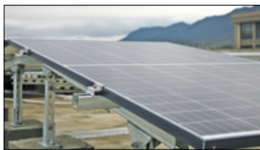
||| Michałowice - Powołują się na gminny program s. 2