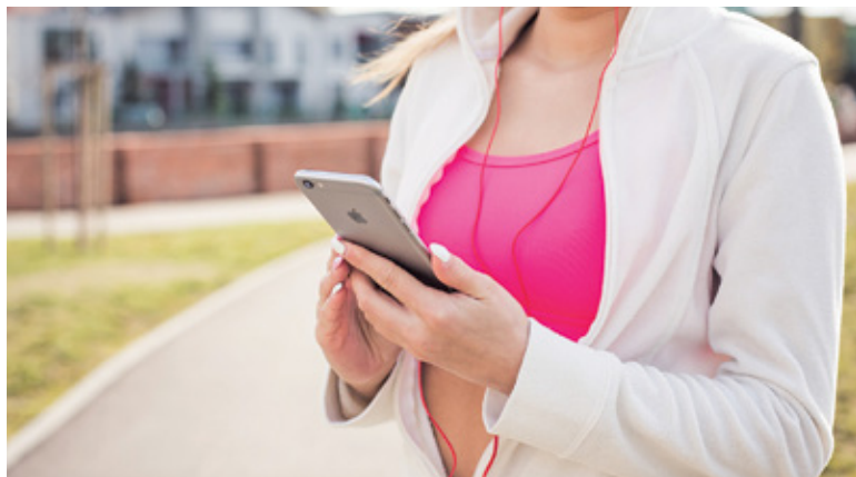
Za używanie telefonu na pasach będą nam teraz grozić kary

Rząd przyjął niedawno nowelizację ustawy Prawo o ruchu drogowym. Nowe przepisy mają w szczególności zwiększyć bezpieczeństwo pieszych na drogach. – Ustawa wprowadza szereg rozwiązań mających na celu poprawę bezpieczeństwa uczestników ruchu drogowego, w tym przede wszystkim pieszych, którzy w zderzeniu z rozjeżdżonym pojazdem nie mają żadnych