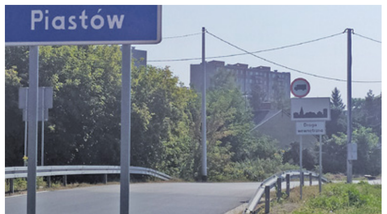
Znak zakazu paraliżuje działalność firmy