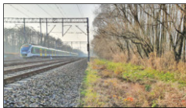
||| Brwinów - Rowerem do Milanówka s. 4