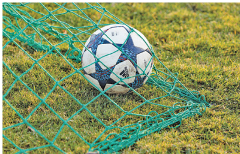
Raszynianki wygrały dziewięć meczów

Raszyn imponował formą strzelecką, ponieważ zdobyła 41 bramek. Straciła przy tym 15. Na wyróżnienie zasługuje