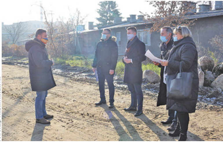
Planowana jest budowa blisko 150 mieszkań

B rak mieszkań komunalnych to błądka wielu samorządów. Kolejną problemową kwestią jest stan lokali, które znajdują się w zasobach gmin. Pruszków chce powiększyć ilość mieszkań znajdujących się w zasobach komunalnych. Władze miasta planują inwe-