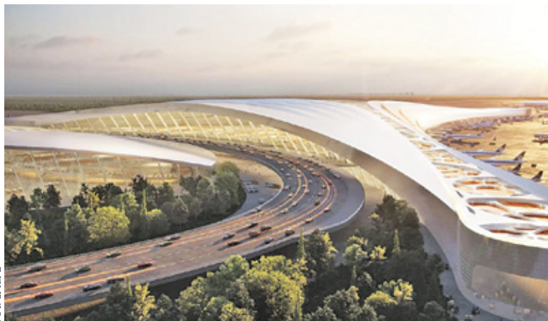
Analizy obejmą tereny lotniska, dworca kolejowego oraz tzw. „szprych”

S półka Centralny Port Komunikacyjny podpisała umowę z firmą Arup Polska na przygotowanie analiz środowiskowych terenów, na których ma powstać nowe lotnisko. – Ruszają kolejne prace związane z planowaniem lotniska. Najnowsza umowa na analizy środowiskowe dotyczy węzła CPK, czyli terenów przewidzianych pod budowę nowego portu lotniczego wraz z dworcem kolejowym i zbiegających się tutaj kolejowych „szprych” – informują władze spółki. W ramach umowy Arup Polska wykona tzw. inwentaryzację stanu zerowego. Ma na to czas do końca przyszłego roku. W dalszej kolejności przygotuje raport oddziaływania na środowisko i dostarczy decyzję środowiskową, pozwolenia wodnoprawne i decyzje o odrolnieniu gruntów. Opiewający na 32 mln zł kontrakt zakłada wykonanie analiz w czterech obszarach: badania elementów środowiska i dokumentacja hydrogeologiczna dla terenów samego lotniska i jego najbliższej infrastruktury, inwentaryzację gatunków