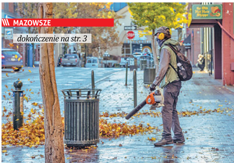
||| MAZOWSZE dokończenie na str. 3 Od 1 stycznia na terenie całego Mazowsza w życie wejdzie całkowity zakaz stosowania dmuchaw