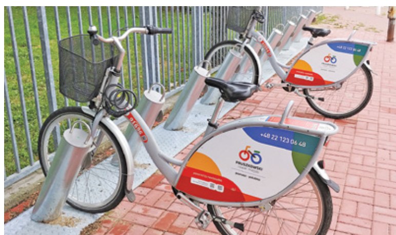
Mieszkańcy przejechali ponad 41 tys. km

powstają stacje wypożyczania jednośladów. Ta idea na dobre zakorzeniła się w Pruszkowie. 4 września 2017 roku to pamiętna data, ponieważ właśnie wtedy wystartował Pruszkowski Rower Miejski. Do dyspozycji mieszkańców oddano pięć stacji i 40 pojazdów. O tym, że inicjatywa spotkała się z pozytywnym odbiorem, najlepiej świadczy jej rozwój. Obecnie na rowerowej mapie Pruszkowa jest 15 punktów, gdzie można wypożyczyć rower. Do dyspozycji mieszkańców oddano 122 jednoślady.