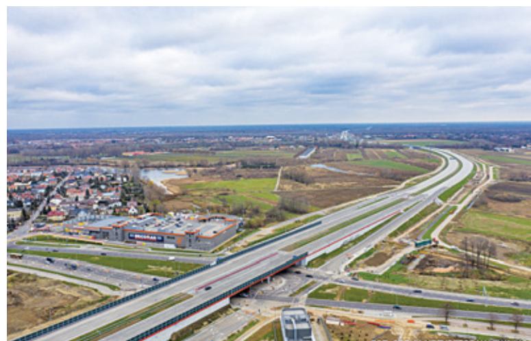
Na większości odcinków trwają już odbiory techniczne, po uzyskaniu których trasa zostanie oddana do użytku

Po uzyskaniu zezwoleń trasa zostanie oddana do użytku. Zgodnie z aneksami do umów, oba odcinki mają być gotowe do końca grudnia. GDDKiA zapewnia jednak, że ruch może zostać dopuszczony nawet na początku grudnia. Wszystko zależy od WINB. Ostatnio nowy odcinek trasy szybkiego ruchu testował... pierwszy polski samochód elektryczny. Na trasie kręcono bowiem reklamę pojazdu.