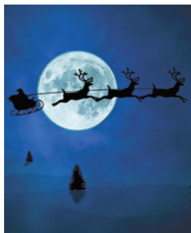
Podczas najbliższego Salonu K40 pierwszoplanową rolę odegra „Pchła Szachrajka”

6 grudnia dzieci i miłośnicy Jana Brzechwy mogą online obejrzeć Salon Poezji K40. Pisarz stworzył wiele niezapomnianych wierszy i opowiadań dla najmłodszych. „Tańcowała igła z nitką”, „Kaczka Dziwaczka”, „Akademia pana Kleksa” – na dziełach Brzechwy wychowały się całe pokolenia. Nadarza się okazja, aby przypomnieć sobie kolejną pozycję z bogatych zasobów pisarza. Podczas najbliższego Salonu K40 pierwszoplanową rolę odegra „Pchła