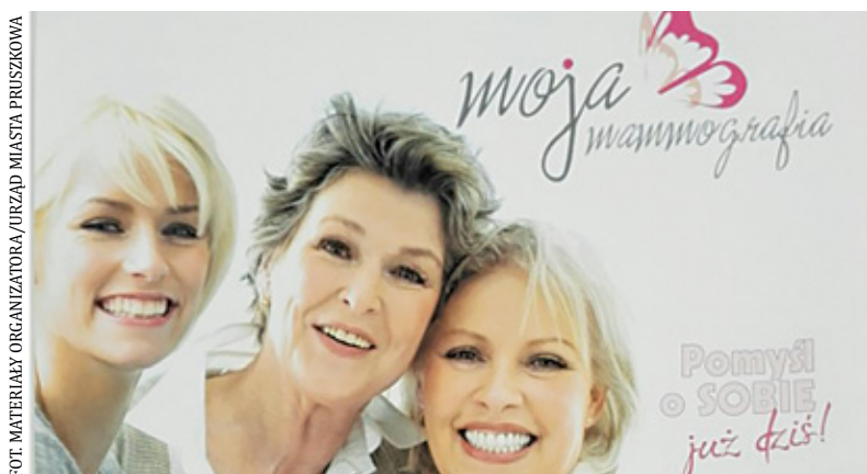
Badania zaplanowano na 10 i 12 grudnia

Badanie trwa zaledwie kilka minut i jest bezbolesne. Mammografia to jedna z najlepszych metod wykrywania raka piersi u kobiet. Pozwala znaleźć bardzo małe guzki, co daje możliwość