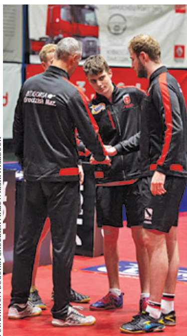
Drugą część sezonu Bogoria rozpocznie 8 stycznia

Po rozegraniu dwunastu kolejek Superliga znalazła się na półmetku. Z