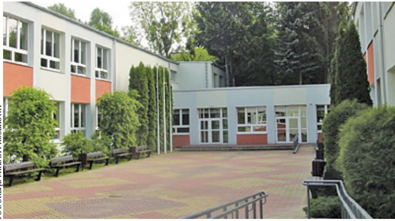
Szkoła Podstawowa nr 3

Miasto przeprowadziło uzgodnienia koncepcyjne. Wszystko wskazuje na to, że uda się spełnić założenia dotyczące uzyskania 12 sal lekcyjnych, około czterech pokoi do pracy indywidualnej, szatni w poziomie parteru, nowoczesnej biblioteki, czytelnicy i świetlicy. Zadanie miałyby objąć remont zaplecza kuchennego i stołówki, aby dostosować je do większej ilości uczniów. Konieczne stanie się również przygotowanie pokoju nauczycielskiego w odpowiednim standardzie. Z kolei na parterze planowane jest reprezentatywne wejście do szkoły z dużym otwartym holem, który będzie wyposażony w windę i portiernię. – W ramach realizowanej inwestycji planujemy remont sanitariatów przy