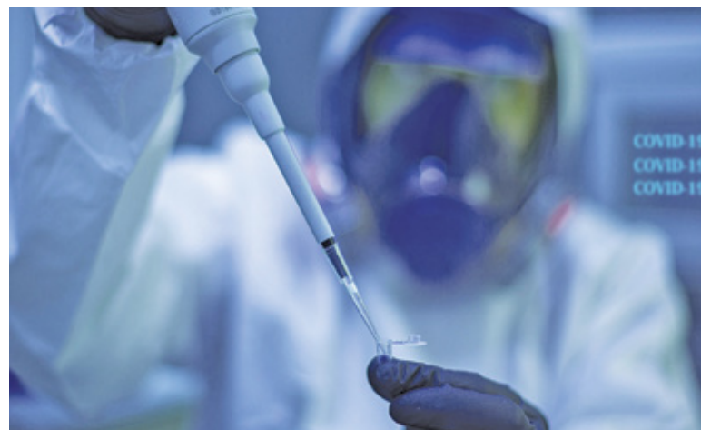
Pierwsze szczepionki powinny dotrzeć do naszego kraju w styczniu

Proces produkcji i dystrybucji szczepionki będzie przebiegał stopniowo, dlatego program szczepień również podzielono na etapy. Kolejność, w jakiej będą szczepione poszczególne grupy, ustalono m.in. na podstawie oceny ryzy-