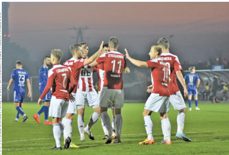
Pogoń zdobyła 39 punktów