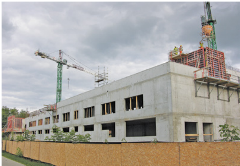
Największą inwestycją będzie powstające już Centrum Aktywizacji i Integracji Społecznej