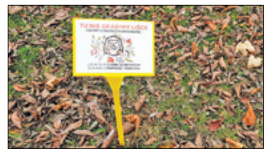
||| Michałowice - Troska o bioróżnorodność s. 6