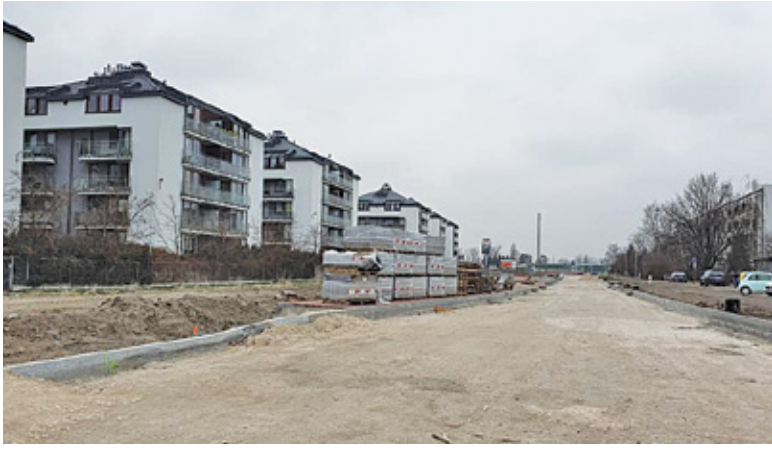
Przebudowa ul. Działkowej