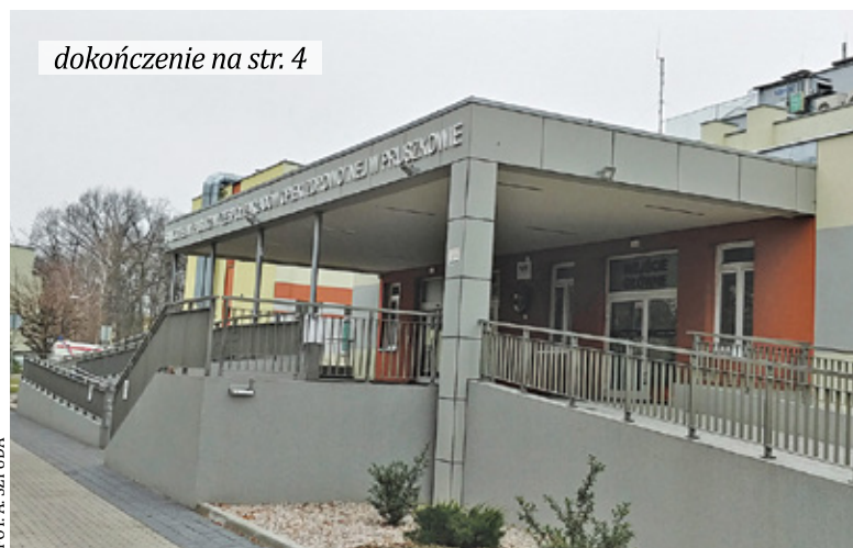
dokończenie na str. 4