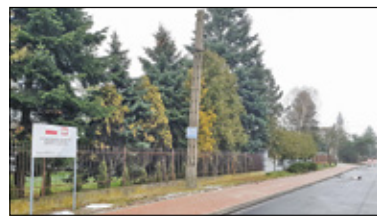
||| Piastów - Blisko 2 miliony na drogi s. 2