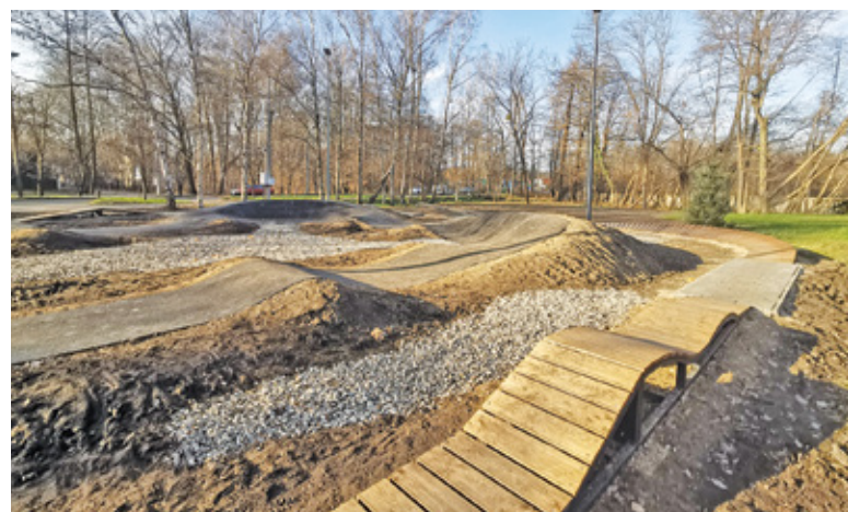
Nowy tor powstał z myślą o najmłodszych użytkownikach

Oficjalne otwarcie nowych atrakcji nastąpiło w mikołajki. Choć sezon rowerowy raczej należy uznać za zakończony,