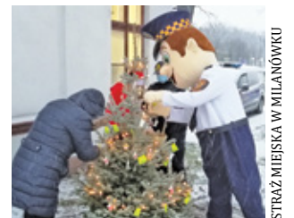
STRAŻNICY MIEJSKIE W MILANÓWKU

Święta za pasem. Kupujemy prezenty, rozglądamy się za choinką, szykujemy spis świątecznych potraw. Bożonarodzeniowa atmosfera zapanowała również w siedzibie milanowskiej straży miejskiej. Strażnicy już przygotowali świąteczne drzewko. Zamiast tradycyjnych bombek zawieszony na niej jednak odbłaski. To prezent dla mieszkańców, przygotowany w ramach akcji "Poczęstuj się odbłaskiem – świeć przykładem". Odblaskowa choinka stała się już milanowską tradycją. Corocznie strażnicy miejscy wykorzystują ten moment, by przypomnieć mieszkańcom o bezpieczeństwie na drodze. To świetna okazja, by obdarować dużych i małych milanowian odbłaskami, które poprawi ich widoczność na drodze. – Przyjdź i poczęstuj się odbłaskiem – świeć przykładem! – zachęcają funkcjonariusze.