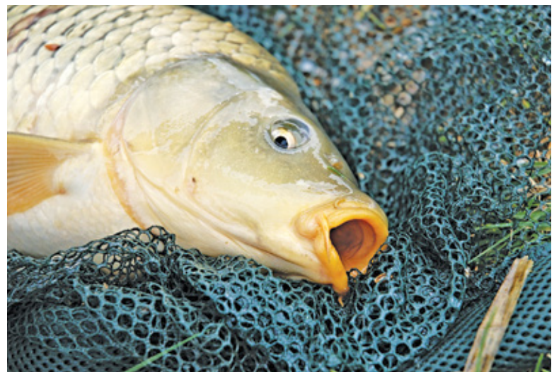
Sąd orzekł, że trzymanie i przenoszenie karpia bez wody narusza prawo o ochronie zwierząt

Historia zaczęła się w 2009 roku, tuż przed świętami. Karpie leżały w ażurowych skrzynkach, jeden na drugim, umierały. Pozbawione wody, nie mogły oddychać. Klienci wychodzili spokojnie, z siatkami zapełnionymi ledwo żywy-