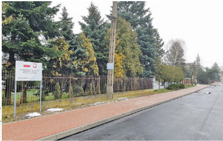
Ulica św. Stanisława Kostki

Remonty dróg to jedno z kluczowych zadań w planach inwestycyjnych samorządów. Ważne jest stworzenie odpowiednich warunków dla kierowców, ale także pieszych i cyklistów. Miasto Piastów przeznaczyło w ostatnim czasie prawie 2 miliony złotych na prace drogowe.