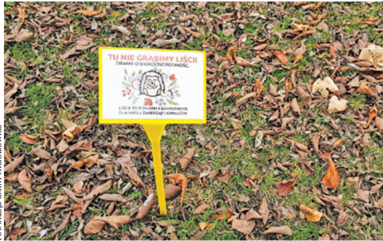
Liście są schronieniem dla zwierząt

K ażdy właściciel ogrodu zdaje sobie sprawę, że jesienią trzeba w nim wykonać wiele prac porządkowych. Zwłaszcza w przypadku, gdy na terenie naszej posesji rosną drzewa. Liście