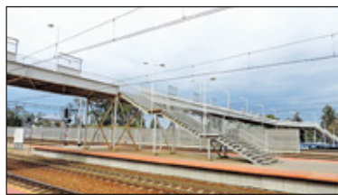
||| Grodzisk Mazowiecki - Kładka już gotowa s. 3