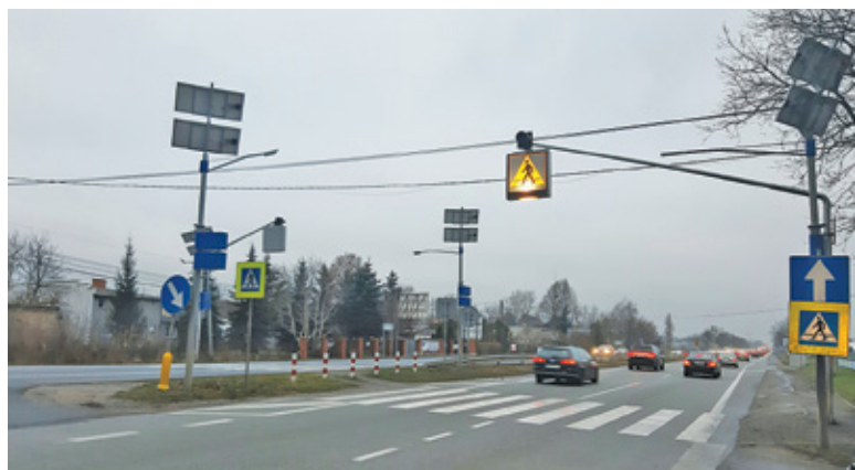
Specjalne lampy mają się pojawić obok wszystkich przejść dla pieszych na drogach krajowych

W ramach programu Bezpieczna Infrastruktura rząd zamierza finansować budowę bezpiecznych przejść dla pieszych, ścieżek rowerowych, chodników, zatoczek autobusowych i separa-