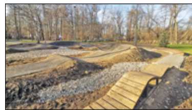
||| Podkowa Leśna - Mikołajkowe pompowanie s. 5