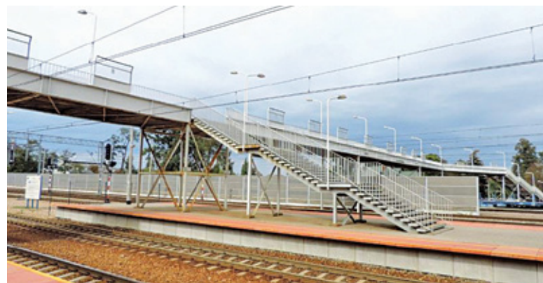
Wykonawca m.in. zabezpieczył metalowe elementy konstrukcji przed korozją i wybudował nowe, antypoślizgowe stopnie

To nie koniec zmian w tym miejscu. Zgodnie z zawartym jesienią br. porozumieniem, kładka zostanie teraz przekazana w zarząd miastu, które za-