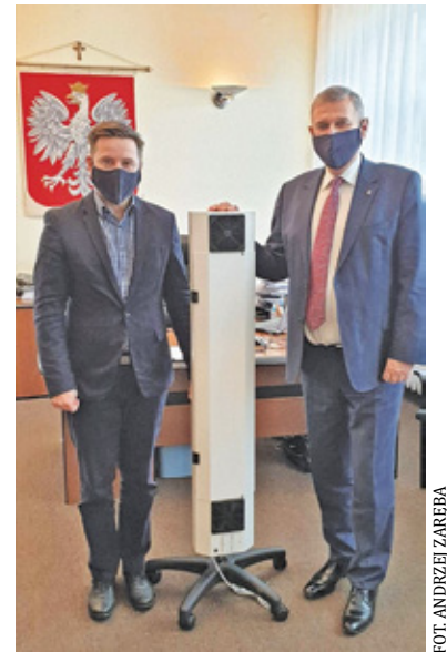
Lampy trafiły m.in. do szkół i przedszkoli

Gmina Raszyn dostarczyła do szkół i przedszkoli oraz świetlic środowiskowej w Rybiu i ogniska wychowawczego w Jaworowej lampy przepływowe UV-C. – Lampy te są urządzeniem dezynfe-