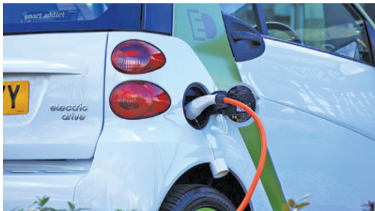
W aktualizacji planu wskazano na podjęcie działań ograniczających emisję dwutlenku węgla

Dokument ma znaczenie strategiczne i wskazuje drogę do osiągnięcia celów pakietu klimatyczno-energetycznego m.in. zwiększenie udziału energii pochodzącej ze źródeł odnawialnych czy poprawę postaw mieszkańców w zakresie ochrony środowiska. – W Planie przedstawiono wiele działań dotyczących różnych sektorów: budynków użyteczności publicznej, mieszkalnictwa, oświetlenia ulicznego i transportu. Większość z tych działań to zadania średnio/długoterminowe, a ich realizacja uzależniona jest od pozyskania dofinansowań zewnętrznych.