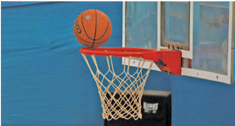
MKS wygrał drugie spotkanie w 2021 roku

Na półmetku rywalizacji przyjezdne prowadziły 54:29. W drugiej i trzeciej odsłonie Politechnika zdobyła tylko 18 punktów. Z kolei MKS nie miał zamiaru oszczędzać rywalkę i wygrał różnicą 51 punktów. Gospodynie trafiły zaledwie 30% gry, zaś MKS aż 56%. Politechnika popełniła również 22 straty. Warto również podkreślić skuteczność pruszkowianek z linii rzutów wolnych. Trafiły 11 z 12 prób.