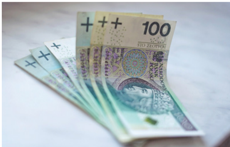
Radni sprzeciwili się wydatkom na zaplanowane przez burmistrza inwestycje