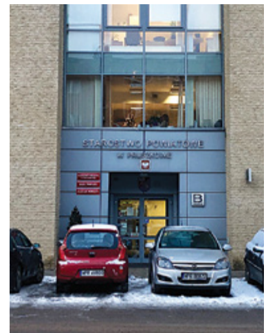
Powiat przekazał 50 tys. zł