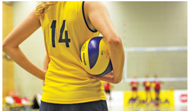
Zwycięski weekend za Spartą

W 14. kolejce grodziscy siatkarze pojechali do Warszawy, gdzie spotkali się z KS Metro Warszawa. Stołeczny zespół przeżywa kryzys i przegrywa mecz za meczem. Przeciwnie Sparta, która zdobywa kolejne punkty i prezentuje się znakomicie. Do rozstrzygnięcia spotkania w Warszawie potrzebne były cztery sety. Sparta prowadziła już 2:0 – 25:23, 25:20. Metro wygrało trzecią partię – 25:23, ale kolejna należała już do grodziszczan – 25:23.