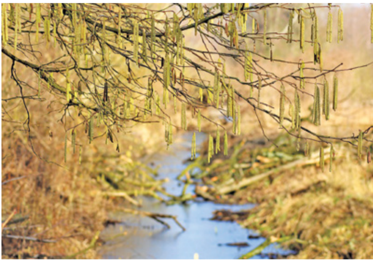
Nowy zbiornik ma zapobiegać podtopieniom okolicznych domostw

firmy: Transprojekt Gdański, pracownia Waga-Bart z Warszawy oraz poznański Zeneris Projekty. Zakładany przez