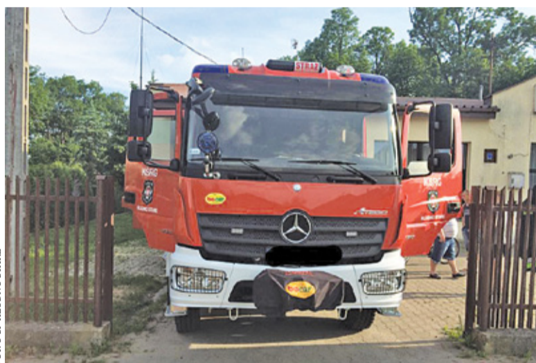
Strażacy z Kludna Starego już od dłuższego czasu czekali na poprawę warunków w strażnicy