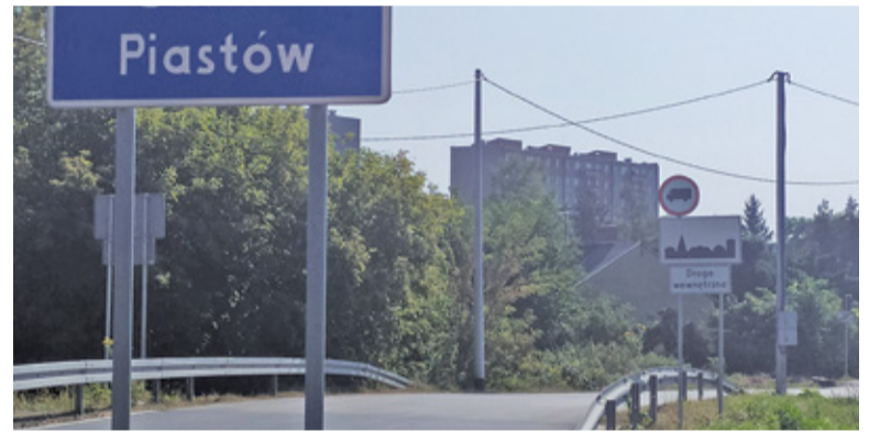
Konsultacje potrwać do 28 stycznia

Poszukiwanie najlepszego rozwiązania nadal trwa. Firma Panattoni przygotowała nową koncepcję organizacji ruchu z uwzględnieniem wniosków zgłoszonych przez władze Piastowa. Głównym celem jest zabezpieczenie terenu miasta przed wjazdem samochodów od strony ul. Fiołkowej. Ruch ma być kierowany w prawo w ul. L. Lisa-Kuli, na wiadukt nad autostradą oraz dalej w stronę Ożarowa. Nie będzie możliwości skrętu w lewo we wspomnianą drogę. Z kolei z Ożarowa pojazdy w lewo