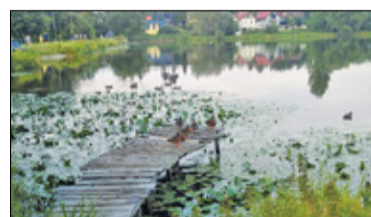
||| Komorów - Kolejna część prac przy zalewie s. 5