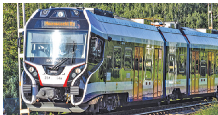
Utrudnienia na linii WKD mają potrwać około 2 lat

R ozbudowa sieci popularnej wukadki wchodzi w następną fazę. dokończenie na str. 3