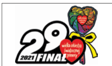
||| Region - Włączą się w dzieło pomocy s. 5