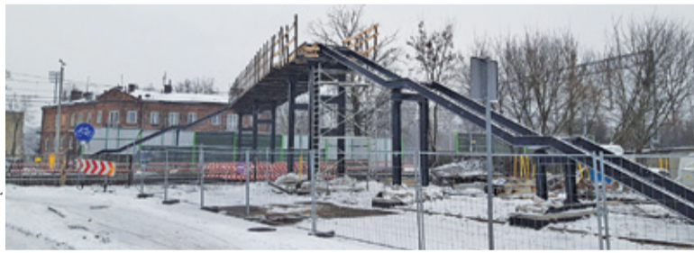
Inwestycja idzie do przodu

Jak dostać się z jednej strony torów na drugą? Najprościej skorzystać z kładki. Priorytetem jest jednak zapewnienie pieszym w pełni bezpiecznej i funkcjonalnej przeprawy. W Pruszkowie powstaje nowy łącznik ul. 3 Maja z ul. Majową. Jesienią ubiegłego roku przeprowadzono prace związane z demontażem starej kładki.