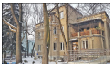
||| Pruszków - Willa pod Bocianem do przebudowy s. 2

GRODZISK MAZOWIECKI ||| BARANÓW ||| JAKTORÓW ||| PODKOWA LEŚNA ||| MILANÓWEK ||| ŻABIA WOLA P R U S Z K Ó W ||| P I A S T Ó W ||| B R W I N Ó W ||| M I C H A Ł O W I C E ||| N A D A R Z Y N ||| R A S Z Y N