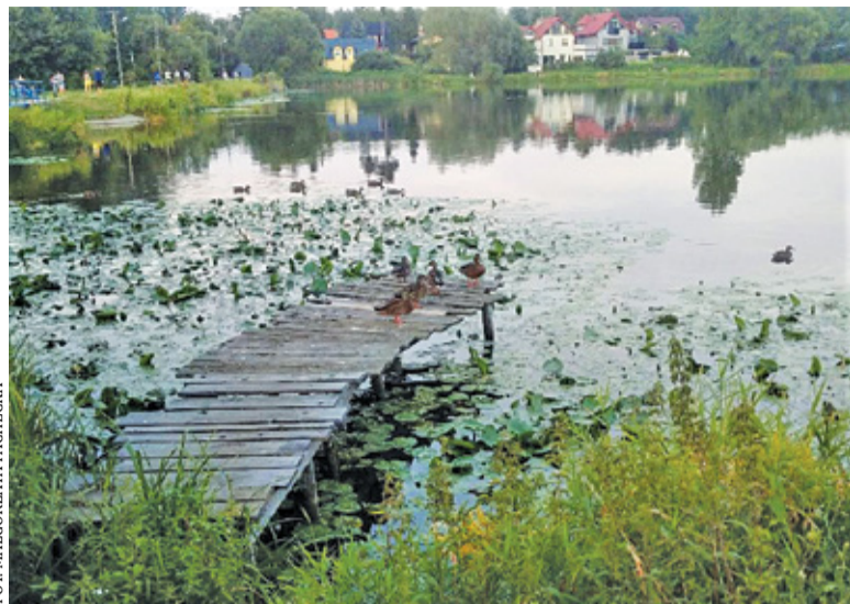
Inwestycja to koszt blisko 5 mln zł

Modernizacja grobli zbiornika ruszy w marcu, a zakończy się w czerwcu. Remont prowadzony będzie od strony ul. Głównej. Tam też będzie parking na