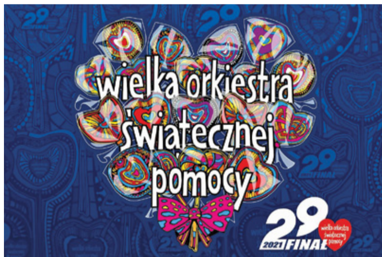
Finał odbędzie się 31 stycznia

W tym roku WOŚP zbiera środki na zakup nowoczesnych urządzeń medycznych dla oddziałów laryngologii, otolaryngologii i diagnostyki głowy. Ponad 1300 sztabów w Polsce i na całym świecie, tysiące wolontariuszy i ludzi dobrych serc. Tak wygląda Wielka Orkiestra Świątecznej Pomocy. Choć żyjemy w czasach pandemii koronawirusa,