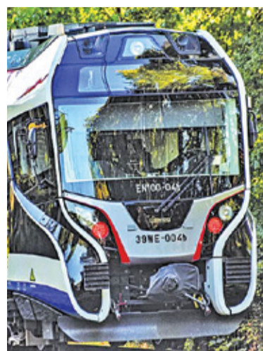
Komunikacja zastępcza ma kursować na czterech odcinkach między Śródmieściem i Milanówkiem

W ramach usługi operator będzie miał za zadanie zapewnić autobusy na odcinkach Warszawa Śródmieście WKD – Komorów, Warszawa Śródmieście WKD – Warszawa Aleje Jerozolimskie, Grodzisk Maz. Radońska – Podkowa Leśna Główna oraz Podkowa Leśna Główna – Milanówek Grudów. Dodatkowo spółka WKD oczekuje, że kursy