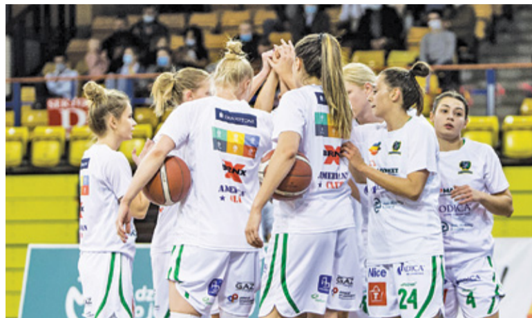
MKS wygrał różnicą 40 punktów

Trzecia kwarta wyrównana, jednak w żaden sposób nie mogła zmienić