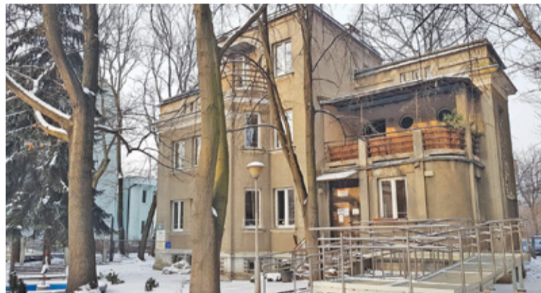
Willa pod Bocianem

Obecnie w budynku mieści się Dzienny Dom „Senior+”. Willa, co podkreślają władze powiatu, ma być również siedzibą Centrum Dialogu Społecznego. Bez wątpienia budynek ma swoje walory, jednak upływający czas sprawia, że konieczny jest remont. Powiat podjął działania w tym kierunku. Na początek konieczne jest przygotowanie