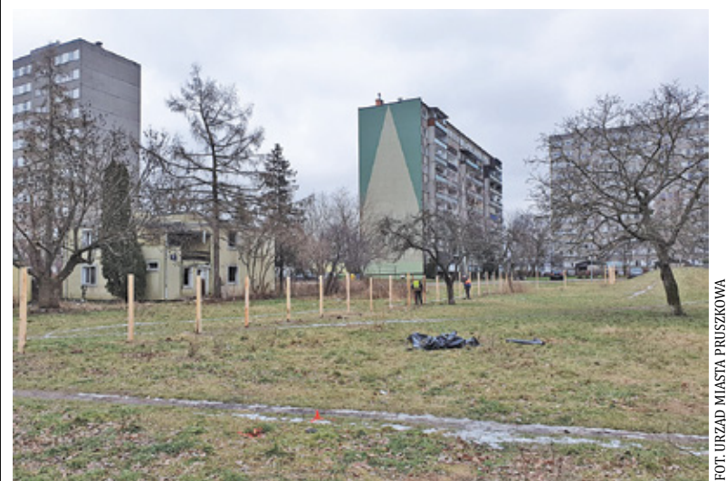
Właściciel ogrodził działkę

wem może postawić płot o wysokości do 220 cm. Urzędnicy zapewniają, że monitorują sytuację. – Aktualne wygro-