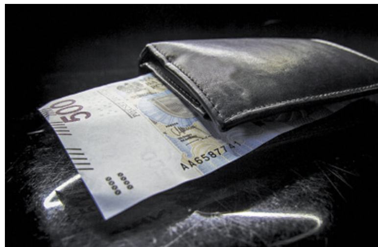
Jeśli nie złożymy wniosku w terminie, grozi nam utrata świadczenia

Tegoroczne świadczenia w ramach 500+ przez długi czas stały pod znakiem zapytania. Od czasu do czasu pojawiały się doniesienia o możliwym zawieszeniu programu lub zmianie formy świadczenia – zamiast gotówki rodziny rzekomo miałyby otrzymywać bony. Takie rozwiązanie sugerowała m.in. była minister rozwoju Jadwiga Emilewicz.