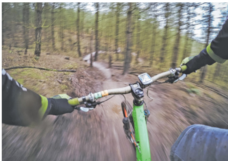
Wolcendorf stoczył zaciętą rywalizację o zwycięstwo ze Szczepanem Paszkim

Wolcendorf stoczył zaciętą rywalizację o zwycięstwo ze Szczepanem Paszkim. 2,9 kilometra, kolarze mieli do pokonania 5 okrążeń, czyli łącznie 14,5 km. Wolcendorf wyprzedził najgroźniejszego rywalą o blisko minutę.