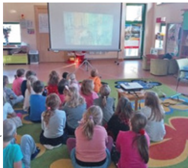
Dzieci wykonują wiele ciekawych zadań

Akcja odbywa się przy zaangażowaniu nauczycieli przedszkoli, którzy uczą najmłodszych poprzez zabawę. Projekt trwa od października 2020 roku, a dzieci w każdym miesiącu wykonują określone zadania. Celem projektu jest kształtowanie poczucia własnej tożsamości regionalnej, rozbudzenie zainteresowania miastem, zachęcanie do odkrywania ciekawych miejsc, poznanie pruszkowskich tradycji oraz integracja ze środowiskiem. W ramach akcji wykorzystywana jest platforma e-Twinning,