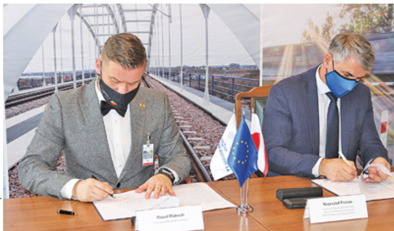
Podpisanie porozumienia z PKP

Kolejnym istotnym krokiem było podpisanie porozumienia pomiędzy Pruszkowem, Piastowem i powiatem pruszkowskim. Podkreślano, że inwestycja ma kluczowe znaczenie dla ruchu. W styczniu nastąpił kolejny pozytywny