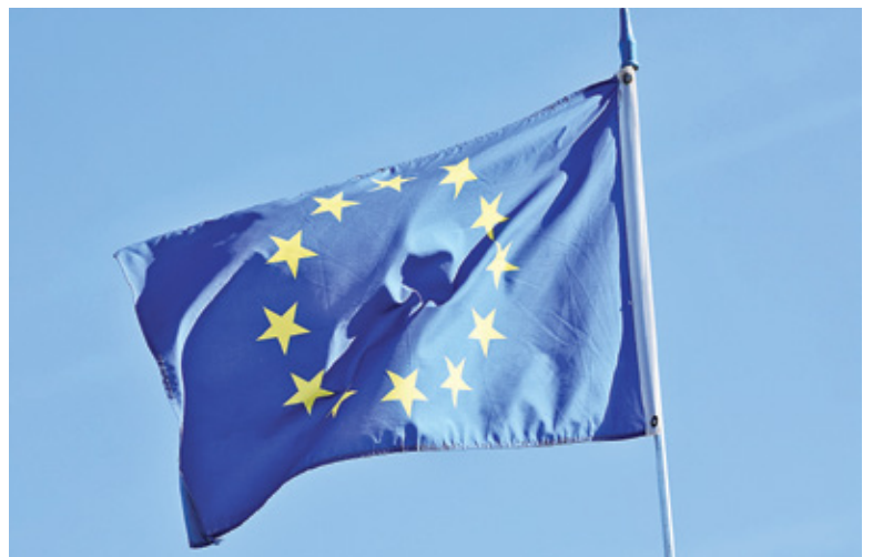
Środki z Unii Europejskiej znacząco wpłynęły na ilość realizowanych inwestycji

szono o wsparcie finansowe ze środków Europejskiego Funduszu Rozwoju Regionalnego, które mogłyby zostać przeznaczone na budowę ścieżek pieszo-rowerowych, oświetlenia, rewitalizację, ochronę zabytków, a także realizację projektów z zakresu gospodarki wodno-ściekowej czy termomodernizację budynków mieszkalnych. Niedostępne będą też środki z Europejskiego Funduszu Społecznego Plus, służące poprawie dostępności do usług zdrowotnych, przeznaczone na wsparcie dla przedszkoli i szkół, podniesienie kompetencji czy finansowanie pomocy dla osób starszych, z niepełnosprawnością i