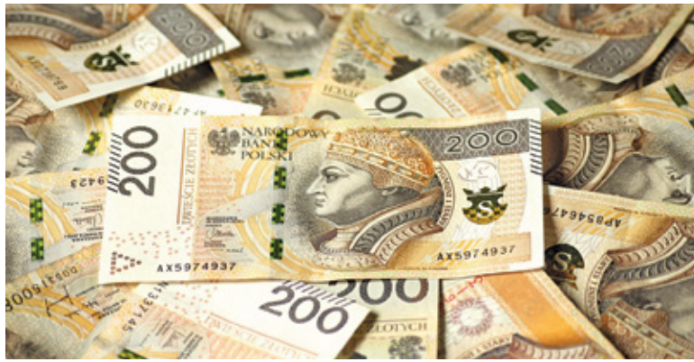
Najbardziej kosztownym zadaniem będzie budowa centrum przesiadkowego „Parkuj i Jedź”, która pochłonie 7,8 mln zł

Najbardziej kosztownym zadaniem będzie budowa centrum przesiadkowego „Parkuj i Jedź”, która pochłonie 7,8 mln zł. Miasto przygotowało również ponad 5,8 mln zł na inwestycje z zakresu gospodarki mieszkaniowej. 4,9 mln zł zostanie przeznaczone na odnowę budynków. Blisko 900 tys. zł zarezerwowano na ograniczenie niskiej emisji. Chodzi tu o podłączenie wielorodzin-