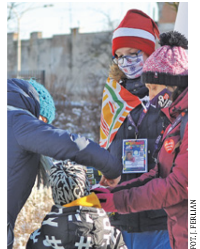
„Koronawirusowy” WOŚP na szczęście odbył się bez poważniejszych incydentów

Organizatorzy liczyli, że do tego czasu zniknie część obostrzeń – rząd zapowiadał bowiem zniesienie restrykcji 17 stycznia. Ostatecznie jednak obostrzenia przedłużono do końca stycznia, co uniemożliwiło przeprowadzenie imprez, które zwykle towarzyszą akcji WOŚP. Okazuje się jednak, że nawet tak trudne warunki nie mogły stanąć akcją na przeszkodzie, a hojność darczyńców pozwoliła pobić kolejne rekordy. Ogromną popularnością cieszyły się eSkarbonki – internetowe subkonta, na które można było przelewać datki bez wychodzenia z domu. Skarbonkę mógł założyć każdy wolontariusz, a suma zebranych tą drogą środków była doliczana do łącznego wyniku sztabu.