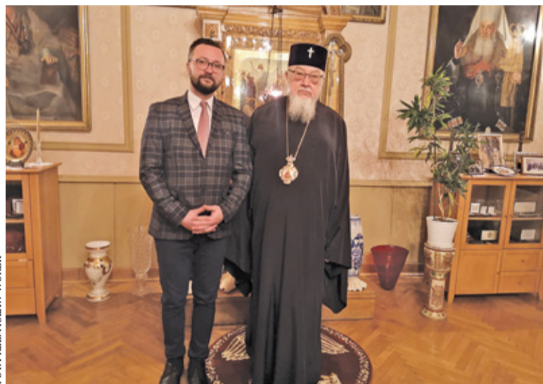
Zastępca burmistrza Piastowa na spotkaniu z Jego Eminencją Sawą

P rzez wieki ludzie migrowali i osiadali się w różnych krajach. Dotyczy to również Polski, która patrząc historycznie cieszyła się popularnością wśród innych nacji. W naszym kraju osiedlali się Litwini, Niemcy, Żydzi, Ormianie, Tatarzy, Karaimi czy Rusini.