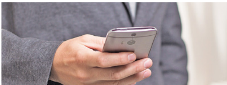
EcoHarmonogram pozwoli sprawdzić termin odbioru odpadów