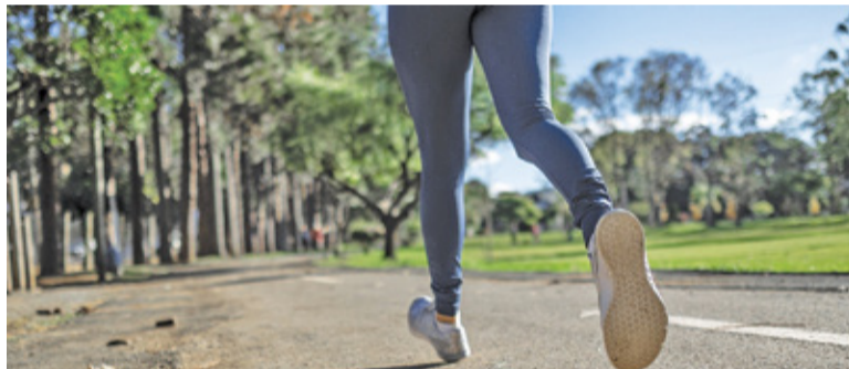
Trzeba pokonać 14 kilometrów

W niedzielę 14 lutego wszyscy spotkają się... No właśnie – gdzie? Każdy w innym miejscu, o innej porze. To nie ma żadnego znaczenia. Ważne, aby dla wszystkich stanowiło to przyjemność. Gmina Michałowice stawia na promocję aktywności fizycznej i zdrowego trybu życia, a także upowszechnienie biegania jako jednej z najprostszych form ruchu. Co istotne, Bieg Walentynkowy to propozycja kierowana do pełnoletnich mieszkańców. Wyzwanie dotyczy pokonania 14 kilometrów w dowolnym miejscu, za to koniecznie 14 lutego.