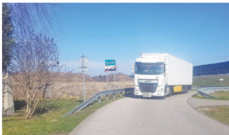
Miasto i spółka prowadząca działalność szukały kompromisu

Strony uzgodniły, że spółka na swój koszt dokona przebudowy skrzyżowania ul. L. Lisa-Kuli i drogi wewnętrznej (łączącej się z ul. Fiołkową w Ożarówie). Zadanie jest złożone. Przede wszystkim przebudowany zostanie wjazd z ul. Lisa-