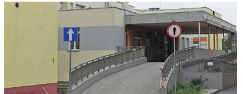
Szpital na Wrzesinie

O dalszych krokach związanych z wyłonieniem dyrektora szpitala na Wrzesinie będziemy informować na bieżąco.