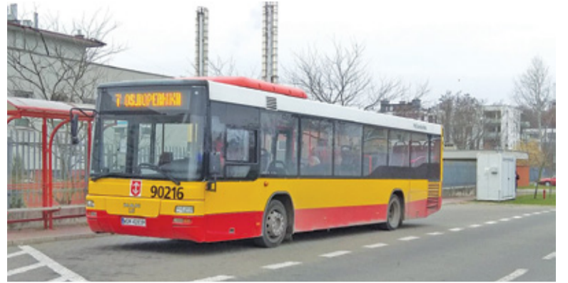
Nawiązanie współpracy z sąsiednimi samorządami pozwoli usprawnić komunikację lokalną

Konstruuąc siatkę komunikacyjną, warto wziąć pod uwagę potrzeby mieszkańców podróżujących poza granice gminy czy powiatu. Z takiego właśnie założenia wyszły władze powiatu gro-