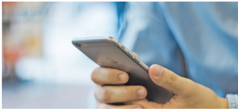
Mieszkańcy zyskają możliwość załatwienia spraw urzędowych bez wychodzenia z domu

Jakie usługi planuje wdrożyć urząd? Pierwszym krokiem będzie stworze-