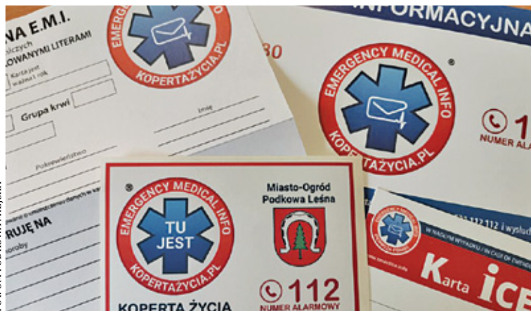
Koperta życia ułatwi służbom szybką pomoc w sytuacji zagrożenia

To pakiet zawierający najważniejsze dane na temat naszego stanu zdrowia. W skład koperty życia wchodzi karta informacyjna, w której obok podstawowych danych osobowych należy wpisać informacje o naszych chorobach, lekach, które przyjmujemy na stałe, czy alergiach na określone substancje. Ponad-