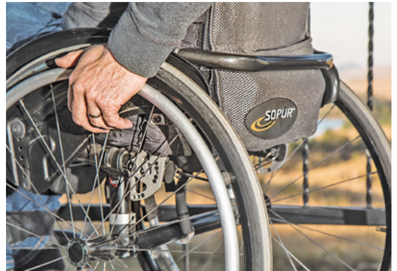
Sprzęt można wypożyczyć na pół roku

Celem przedsięwzięcia jest ograniczenie skutków niepełnosprawności oraz wspomaganie osób w procesie powrotu do aktywności fizycznej, społecznej, zawodowej, a także przeciwdziałanie wykluczeniu osób z niepełnosprawnościami. To niezwykle cenne