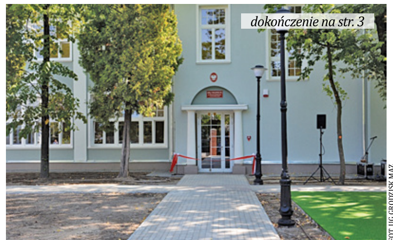
Rozbudowa ma zapewnić uczniom bardziej komfortowe warunki do nauki

Plany modernizacji placówki podjęto już w połowie 2019 r.