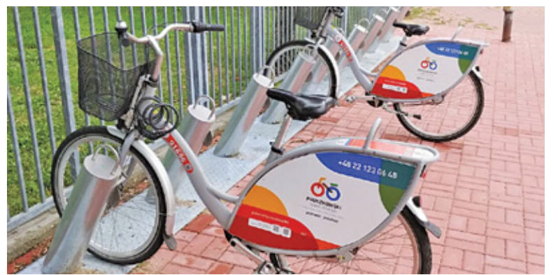
Sezon ma wystartować 15 kwietnia

na 15 kwietnia. Miasto ogłosiło przetarg na dostawę, uruchomienie oraz zarządzanie systemem. Jeśli wszystko dobrze pójdzie, w marcu postępowanie zostanie zakończone. Do dyspozycji mieszkańców będzie 106 rowerów, które zostaną rozmieszczone w 13 punktach. Stacje znajdują się w następujących lokalizacjach: rejon stacji WKD Pruszków, ul. Plantowa na osiedlu Staszica, Park Mazowsze, skrzyżowanie ulic Promyka i Robotniczej, teren CDK, plac przy Ostoi w rejonie ul. Zdziśława, ul. Spacerowa, rejon PKP przy ul. Kościuszki, rejon PKP w okolicy parking przy Waryńskiego,