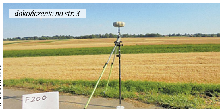
Badania mają na celu ustalenie dokładnej topografii terenu przyszłego lotniska