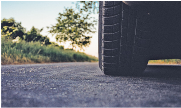
Gmina rusza z remontami

Zmiany dotkną również ul. Ryszarda w Komorowie. Kierowcy zyskają nową nawierzchnię, pojawi się rów-