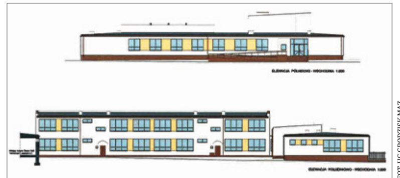
Wizualizacja zmodernizowanego gmachu szkoły

Zgodnie ze specyfikacją zamówienia od strony północno-zachodniej ma powstać piętro mieszczące 6 sal lekcyjnych. Na parterze w skrzydle dwukondygnacyjnym zaprojektowano gabinet pedagoga, gabinet pielęgniarki. W związku z większą liczbą uczniów i nauczycieli w projekcie uwzględniono również dodatkowe pomieszczenie szatni oraz pokój nauczycielski. Wykonawca przebuduje też m.in. szatnię, wiatrołap, portiernię i komunikację.