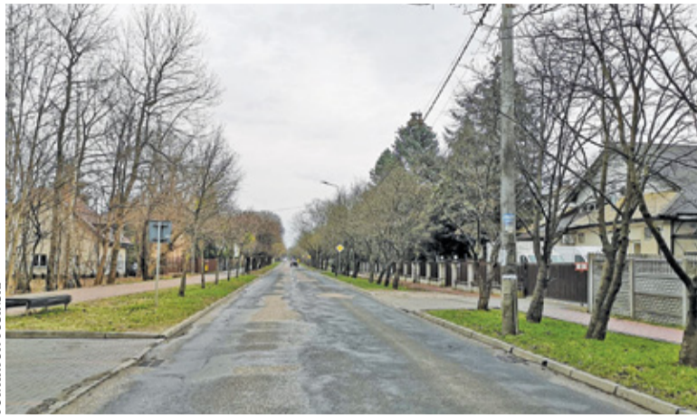
Od 10 maja etapowo zamykane będą odcinki drogi

– Ok. 10 maja rozpoczną się prace remontowe ul. Brwinowskiej w zakresie wymiany nawierzchni krawężników. W związku z tym, odcinki drogi etapowo będą wyłączane z ruchu. Objazdy będą prowadzone ul. Gołębia,