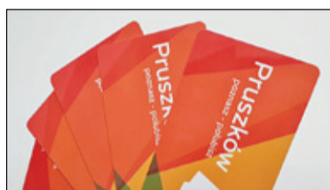
||| Pruszków, Michałowice - Tańsze testy z kartą s. 9