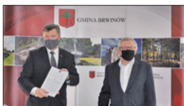
||| Brwinów - Biblioteka zakontraktowana s. 2