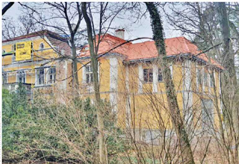
Prace przy renowacji willi prowadzone są pod nadzorem konserwatora zabytków