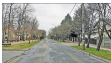
||| Podkowa Leśna - Przebudują Brwinowską s. 2