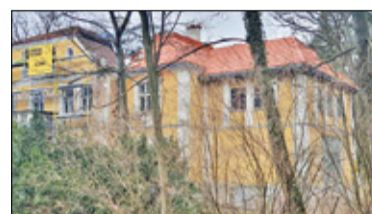
||| Milanówek - Waleria w trakcie rewitalizacji s. 10