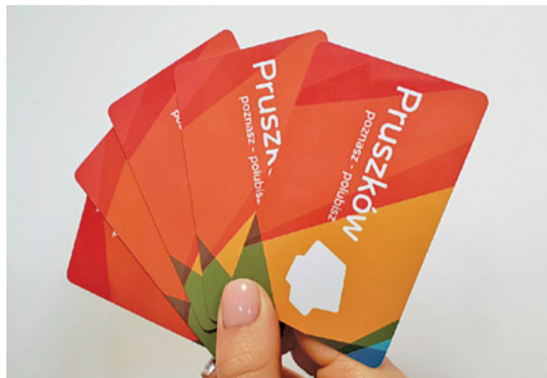
Pruszkowska Karta Mieszkańca

Mniej za badania zapłacą również mieszkańcy gminy Michałowice. Realizowane są również w szpitalu powiatowym. – Tymczasem z kartą mieszkańca naszej gminy mogą państwo wykonać testy na obecność przeciwciał SARS-CoV-2. Wszystkim życzą dużo odporno-