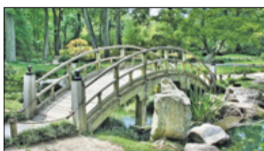
||| Pruszków - Powstanie strefa relaksu s. 2

GRODZISK MAZOWIECKI ||| BARANÓW ||| JAKTORÓW ||| PODKOWA LEŚNA ||| MILANÓWEK ||| ŻABIA WOLA PRUSZKÓW ||| PIASTÓW ||| BRWINÓW ||| MICHAŁOWICE ||| NADARZYN ||| RASZYN