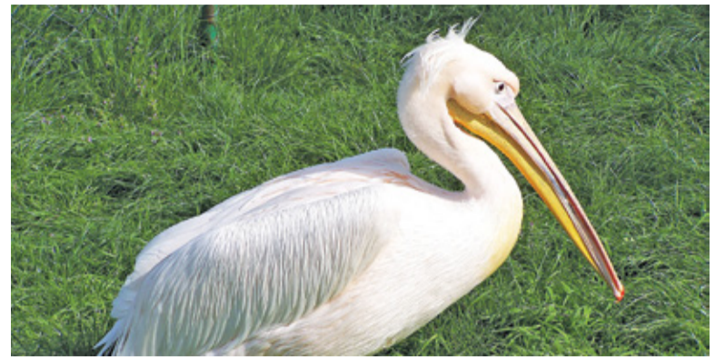
Stawy Raszyńskie stanowią łęgowisko i żerowisko ponad 100 gatunków ptaków

Tereny stawów Raszyńskiego i Spiskiego wraz z otuliną, jak również teren dawnego folwarku, miałyby zostać przeznaczone pod zabudowę mieszkaniową i komercyjną, również z możliwością budowy hal magazynowych. Na obszarach torfowych nad Raszyńką (między Drogą Hrabską i ul. Sportową) miałyby pojawić się zabudowa jednorodzinna. Tereny położone po drugiej stronie al. Krakowskiej miałyby z kolei zostać przeznaczone pod usługi komercyjne i tereny rolne.