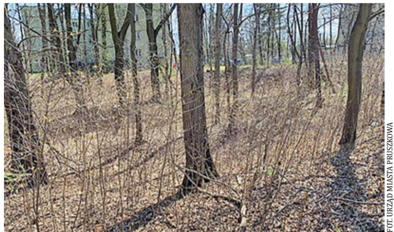
Teren przy szpitalu zostanie zagospodarowany

W Pruszkowie nie brakuje miejsc, gdzie można odpocząć i pocieszyć się naturą. Wiele osób ceni sobie Park Potulickich, mieszkańcy lubią spędzać czas w Parku Kościuszki. Właśnie w tym drugim, z myślą o dzieciach, miasto podjęło się prac związanych z modernizacją placu zabaw. Trampoliny, boccianie gniazdo, zestaw dwóch rowerów i tablicy z trasą