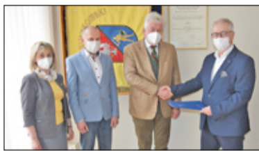
||| Pruszków - Szpital z nowym dyrektorem s. 2