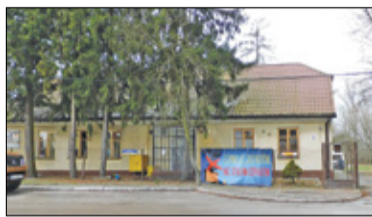
||| Raszyn - Projekt: żłobek s. 4