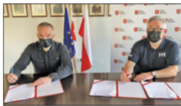
||| Grodzisk Mazowiecki - Nowe odwodnienie s. 2