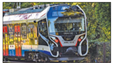
||| Region - Twoja bezpieczna WuKaDka s. 6