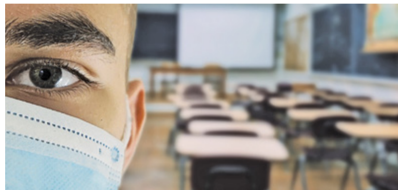
Dyrektor warszawskiego liceum zachęca nauczycieli do wyjścia z uczniami „w miasto” zamiast siedzenia w klasach i skupiania się na tradycyjnej nauce

Ostatnie tygodnie przed wystawianiem ocen to zazwyczaj czas sprawdzianów i kartkówek. A po miesiącach zdalnej nauki pokusa, by zweryfikować oceny wystawione w oparciu o pisane poza kontrolą nauczyciela testy i wypracowania, może być wyjątkowo silna. Z dziennikiem czerwonym od sprawdzianów i kartkówek wiążą się największe obawy uczniów i ich rodziców. Zwracają na to uwagę również psychologowie. Podkreślają, że powrót do szkolnej rzeczywistości, de facto ponowne wejście w grupę uczniowską i relacje z nauczycielami, to i tak duży stres dla uczniów.