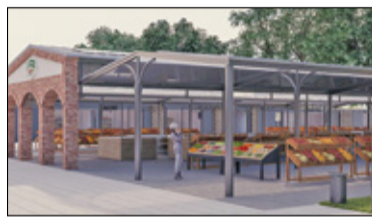
||| Milanówek - Ponowny przetarg na budowę targowiska s. 5