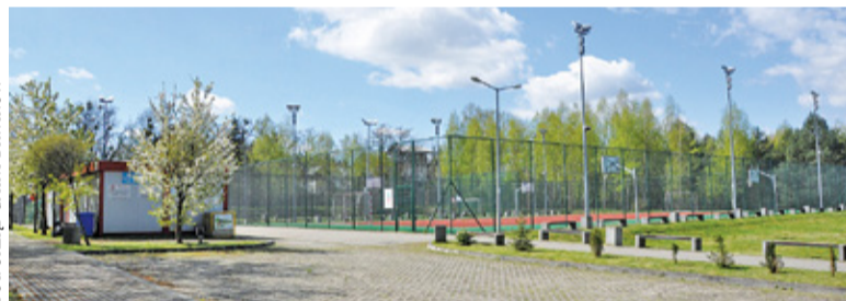
W ramach remontu zostaną wymienione nawierzchnie boisk. Pojawi się tu również osprzęt do nowych dyscyplin sportowych

Do zadań wykonawcy wybranego w przetargu będzie należeć rozbiorka istniejącej oraz wykonanie nowej na-