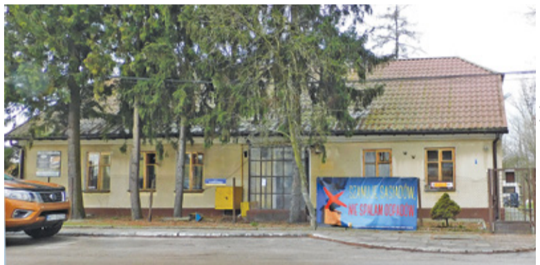
Budynek dawnej szkoły przy Austerii na zostać zaadaptowany na potrzeby nowej placówki

Do przetargu stanęło trzech ofertów, a najkorzystniejszą propozycję złożyła pracownia architektoniczna Ar-