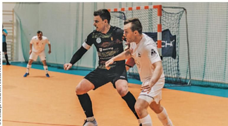
Podkowa zgromadziła w barażach cztery punkty

Wygrana w II lidze dała Podkowie przepustkę do zmagania w barażach o awans do I ligi. Tam ekipa z miasteczka trafiła na BonitosHelios Białystok oraz KP Soccer Calcio Łódź. Trzeba było stawić czoła rywalom i dać z siebie wszystko. Na początek rywalizacja z ekipą z Białegostoku. Wszystko układało się po myśli gości, bo Podkowa prowadziła 2:0. Gospodarze jednak walczyli