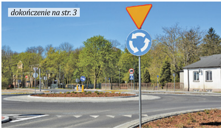
Nowe rondo ma znacznie poprawić bezpieczeństwo wszystkich użytkowników drogi