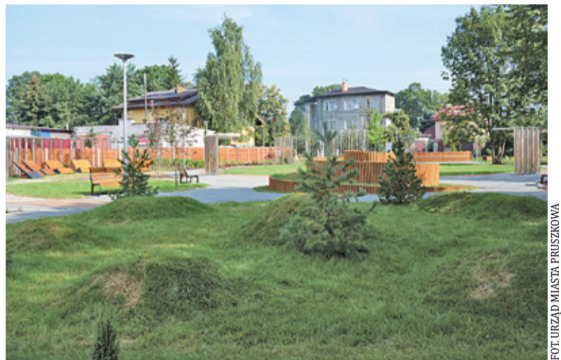
Ogród sensoryczny przy ul. Wapiennej

W ubiegłym roku w mieście powstał ogród sensoryczny, który wykonano na niezagospodarowanym terenie pomiędzy ulicami Partyzantów i Wapiennej. Znalazły się tam m.in. plac z kolorowymi luksferami, pole piaskowe czy ogród smaków i zapachów. O potrzeby dzieci z niepełnosprawnościami zadbało również na placu zabaw w Parku Kościuszki.