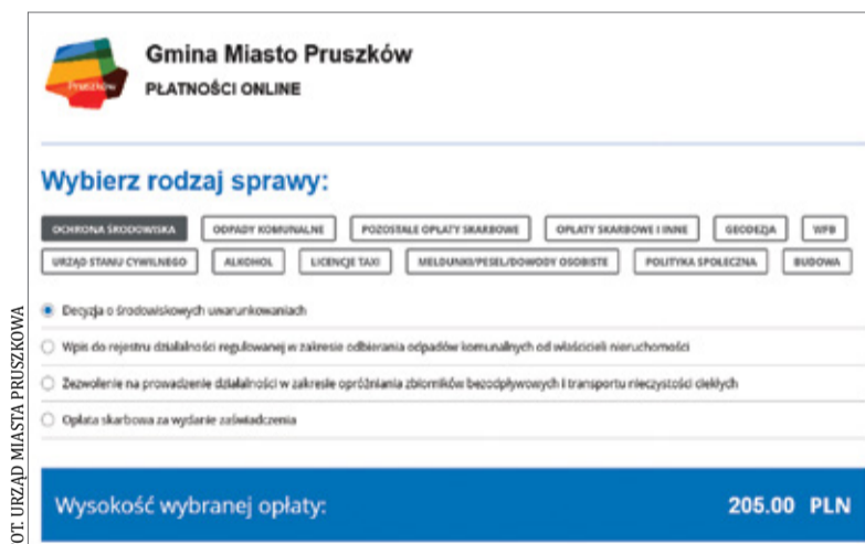
System e-płatności jest przejrzysty

Stanie w kolejkach zawsze nas denerwowało. Traciliśmy czas, czuliśmy złość i zniechęcenie. Z czasem zaczęto wdrażać system e-administracji. Gdy przyszła pandemia koronawirusa, urzędy i instytucje musiały zmienić system pracy i funkcjonowania. Wraz z rozwojem nowych technologii