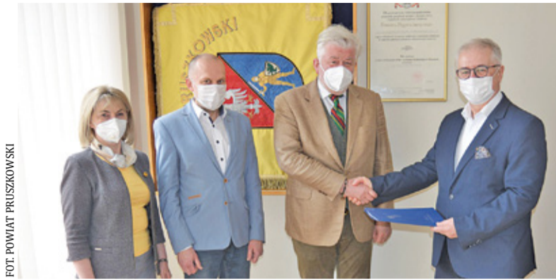
4 maja nowy dyrektor podpisał umowę

Przed nowym dyrektorem stoi wiele wyzwań. W ostatnim czasie w kontekście szpitala mówiło się o licznych problemach m.in. finansowych i kadrowych.