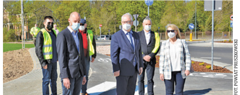
W poniedziałek przedstawiciele władz powiatu dokonali odbiorów technicznych

Oprócz samej budowy ronda, wykonawca wyremontował również nawierzchnię ul. Platanowej na odcinku