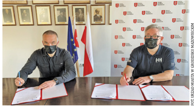
Burmistrz i skarbnik grodziskiej gminy podpisują umowę

– Odcinek podstawowy w ulicy Poniatowskiego obejmuje rozpoczęte roboty budowlane kanalizacji deszczowej pomiędzy studniami D1 i D6. Natomiast odcinek od mleczarni obejmuje budowę kanalizacji deszczowej w ulicy Poniatowskiego od studni D6 do studni D9 – informuje ratusz w specyfikacji