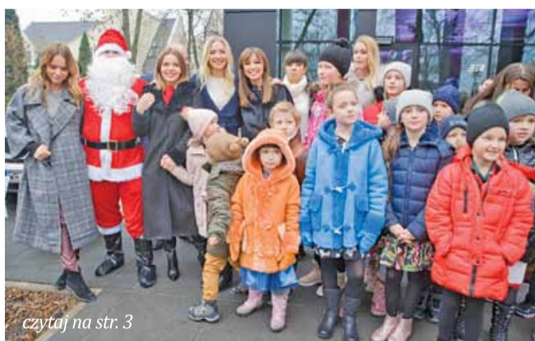
czytaj na str. 3