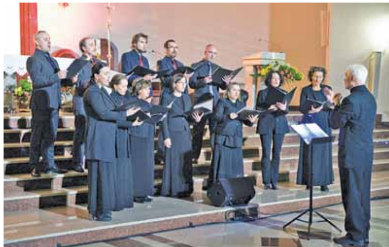
Ekumeniczny Chór Kameralny z Warszawy