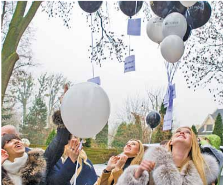
Baloniki z marzeniami poleciały wprost do nieba. Ciekawe czy doleczą...?