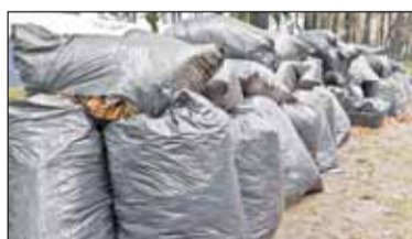
||| Grodzisk Mazowiecki - Śmieciowy problem s. 4