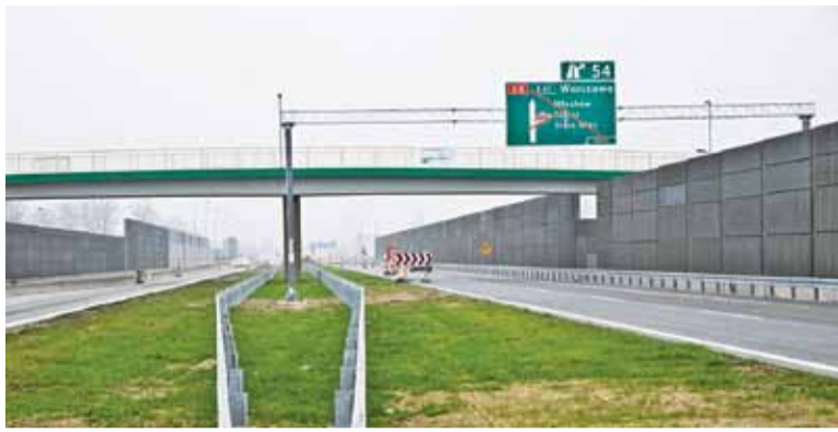
Droga główna jest już prawie gotowa na przejęcie ruchu

Przejezdność pod wiaduktem na węźle Młochów stoi pod znakiem zapytania. Wygląda na to, że jest tu jeszcze wiele do zrobienia. Wprawdzie rondo