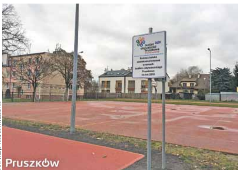
Boisko powstało przy SP nr 9