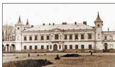
||| Historia - Falenty bankierów i nie tylko cz. 2 s. 7