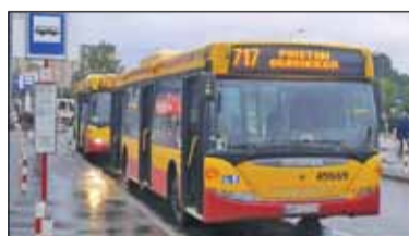
||| Piastów - Zniżki od grudnia s. 2