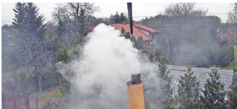
Sonda grodzkiego drona z powietrza sprawdzi skład dymu emitowanego przez podejrzany komin