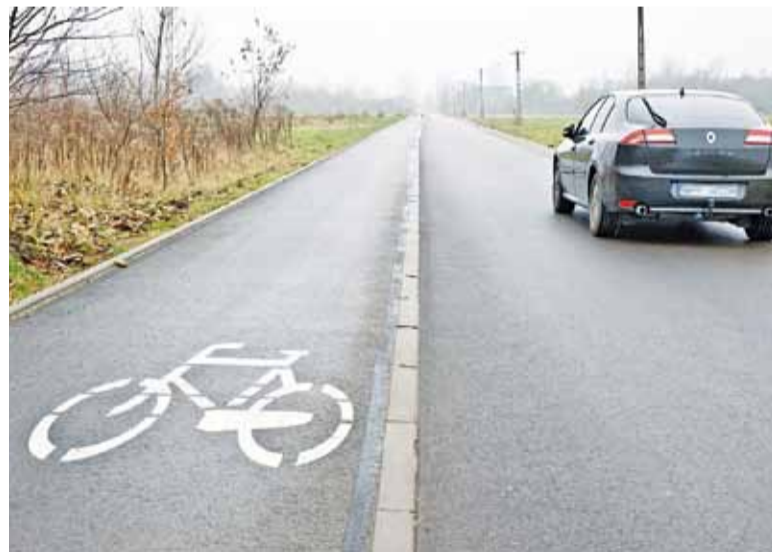
Na ulicy Wojskowej wykrojona ścieżka rowerowa uniemożliwia wymijanie samochodów jadących w przeciwnych kierunkach

Zastanawiający jest jednak przeciwny kierunek, czyli połączenie Kajetan z Ruścem. Przejechaliśmy się Klonową od strony Kajetan i przyznać trzeba, że