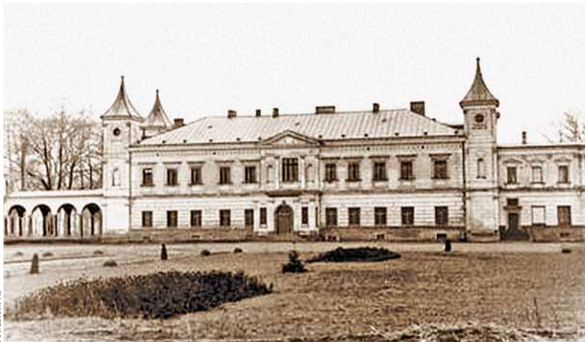
Pałac w Falentach w 1942 roku