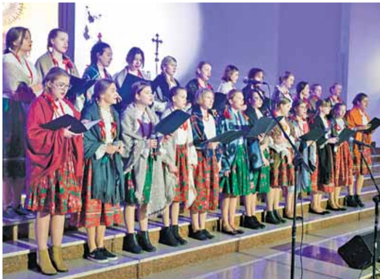
Grodziski Chór Bogorya zaprezentował utwory z nagranej w tym roku płyty

paczki i wiolonczelista, zagrała trzy melodie żołnierskie – „O mój rozmarynie”, „Pałacyk Michła” i „Deszcz jesienny deszcz”, oraz dwa motywy filmowe – z „Nocy i dni” oraz „Czasu honoru”. Za swój występ orkiestra otrzymała zasłużone brawa.