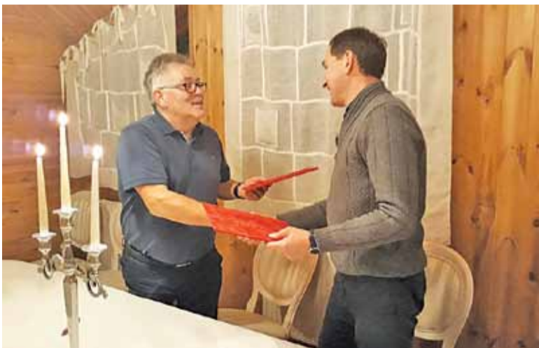
Włodarze obu stron podpisali list intencyjny o obustronnej współpracy