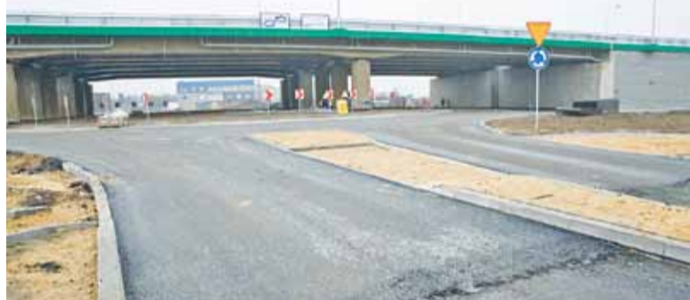
Rondo na węźle Młochów ma już nakładkę asfaltową, ale połączenia ronda z ringami chyba nie będą jeszcze przejezdne

P ostanowiliśmy sprawdzić, czy obecne tempo prac umożliwi dotrzymanie obietnicy wykonawcy robót. Na trasie głównej wykonano już bariery energochłonne, zainstalowano oznakowanie trasy. Latarnie oświetleniowe są