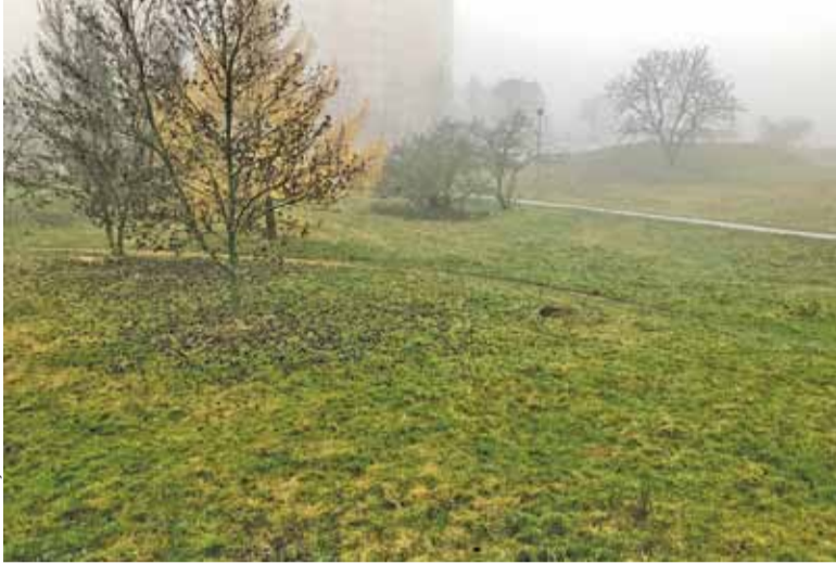
Park zostanie zagospodarowany