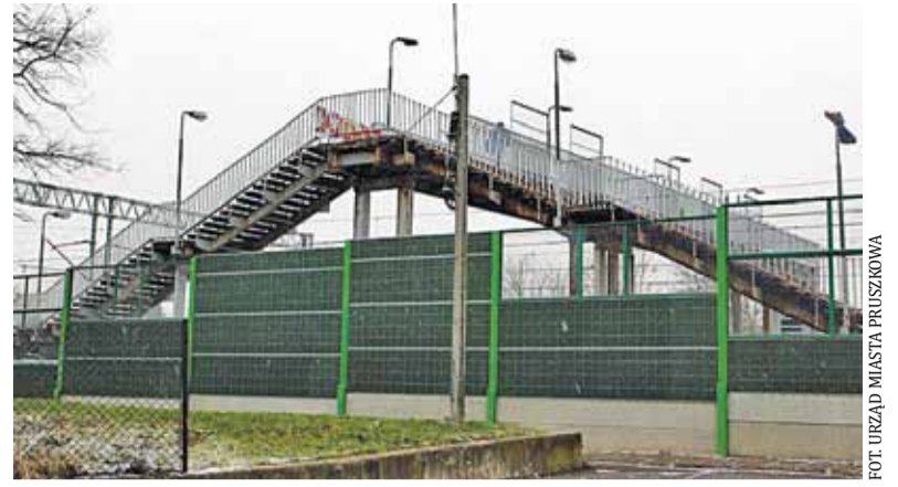
Kładka łącząca ul. Majową i ul. 3 Maja