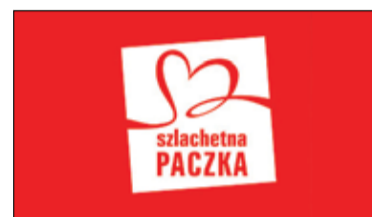
||| Region - Bądź szlachetny s. 8