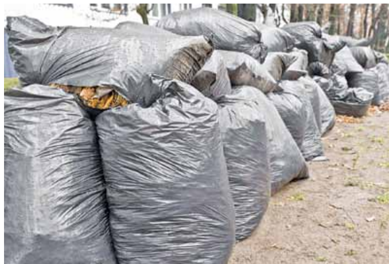
W tych workach są tylko liście. Niedługo mogą być to już śmieci!