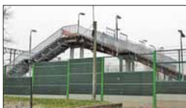
||| Pruszków - Roboty mają ruszyć w połowie roku s. 6