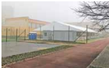
Lodowisko ruszy niebawem

Tak jak i w ubiegłym roku, miłośnicy jazdy na łyżwach nie zostaną na przysłowiowym „lodzie”. Tym razem lodowisko będzie większe. W ubiegłym roku miało powierzchnię 600 m 2 , teraz – 760 m 2 . W połowie listopada roz-