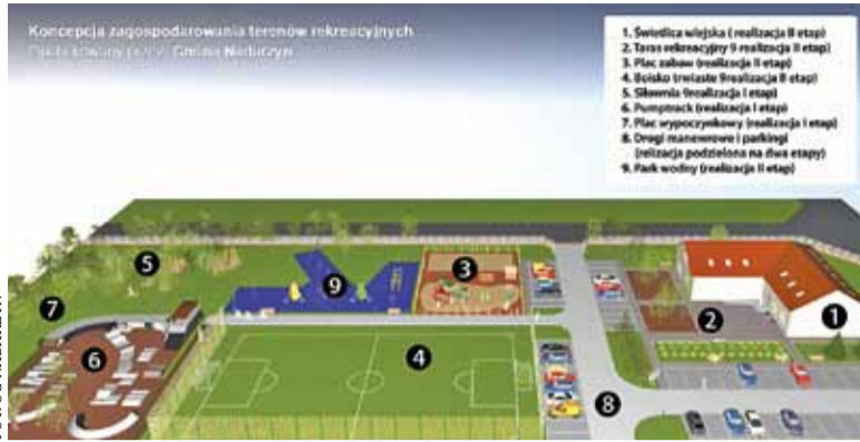
Wizualizacja terenu przed wprowadzeniem zmian