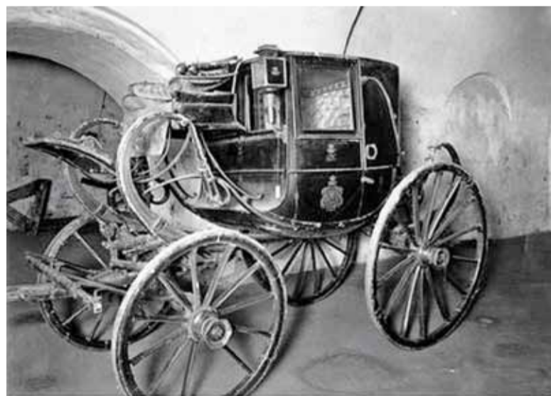
Kareta Stanisława Augusta Poniatowskiego