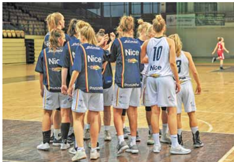
Liderki są niepokonane na własnym parkiecie