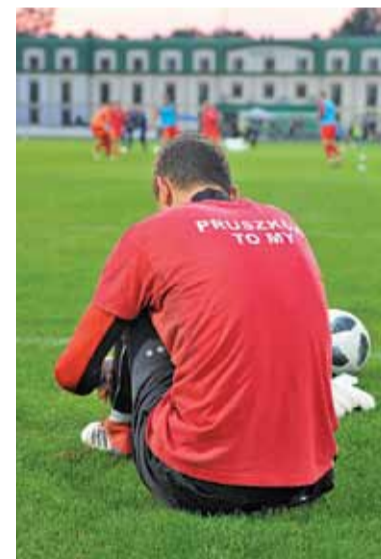
Znicz wygrał siódmy mecz w sezonie

Goście bardzo chcieli jak najszybciej strzelić bramkę. Początek spokojny, jednak wraz z upływającym czasem łodzianie szturmowali bramkę Znicza,