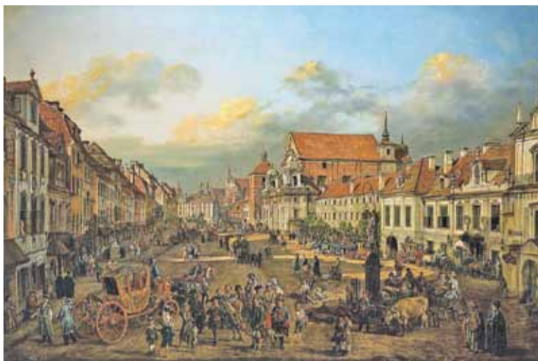
Krakowskie Przedmieście obraz Bernardo Bellotto (Canaletto)

Szlachta, widząc te ogromne inwestycje, chętnie pozbywała się nierucho-