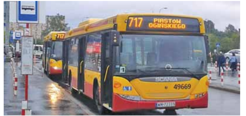
Bilet metropolitalny w Piastowie wystartuje 3 grudnia

Tradycyjnie już w trzecią niedzielę stycznia w całej Polsce i wielu krajach na świecie zagra Wielka Orkiestra Świątecznej Pomocy. To już 27. Finał, podczas którego będą zbierane środki na zakup sprzętu dla specjalistycznych szpitali dziecięcych. Tego dnia ruszą na ulice również wolontariusze grodziskiego sztabu WOŚP. Trwa właśnie rekrutacja osób chętnych do udziału w akcji. Wolontariusze mogą zgłaszać się do 19 grudnia na stronie iwolontariusz.wosp.org.pl lub osobiście w godz. 17.00-19.00 w Willi Radogoszcz. Do zarejestrowania się wystarczą podstawowe osobowe oraz zdjęcie. Warto jednak pamiętać, by nie odkładać tego na ostatnią chwilę – liczba miejsc jest ograniczona!