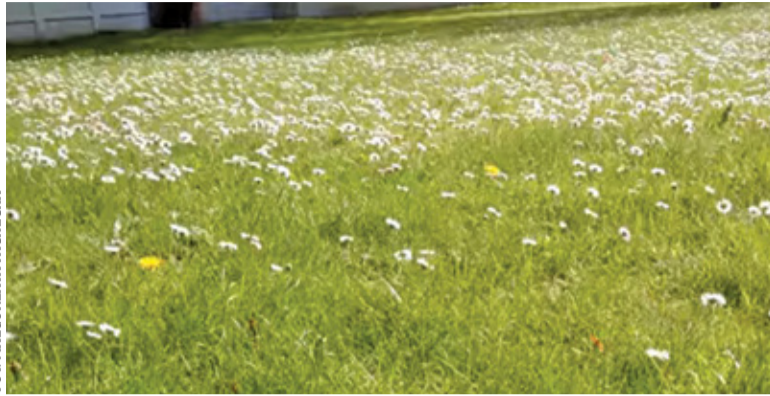
Samorząd liczy, że tegoroczne koszenie uda się zrealizować szybciej

Wiosną wszystko budzi się do życia, a przed ogrodnikami wiele porządków i działań na rzecz pięknego wyglądu roślin. Dotyczy to również samorządów dbających o stan zieleni. Gmina Michałowice przystąpiła do działania i rozpoczęła wiosenne koszenie. We wszystkich miejscowościach jest 40 hektarów trawników. W ubiegłym roku wiosenne koszenie zajęło blisko cztery