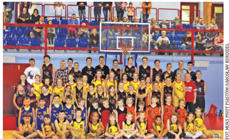
Pivot ma bogatą historię

Otóż to, im lepsze mamy owe wyniki, tym pilniej i szerzej jesteście obserwowani. Na przestrzeni tych lat wychowa-