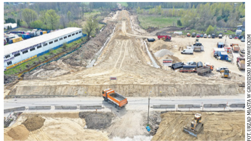
Budowa nasypów przy obwodnicy Grodziska Mazowieckiego

Ratusz szacuje, że taki proces może potrwać, zależnie od odcinka drogi, do kilku miesięcy, a prognozowane osiadania nasypów wyniosą kilka centymetrów. Magistrat wskazuje, że po zakończeniu procesu wzmocnienia gruntu wykonawca dokona rozbiórki nasypów