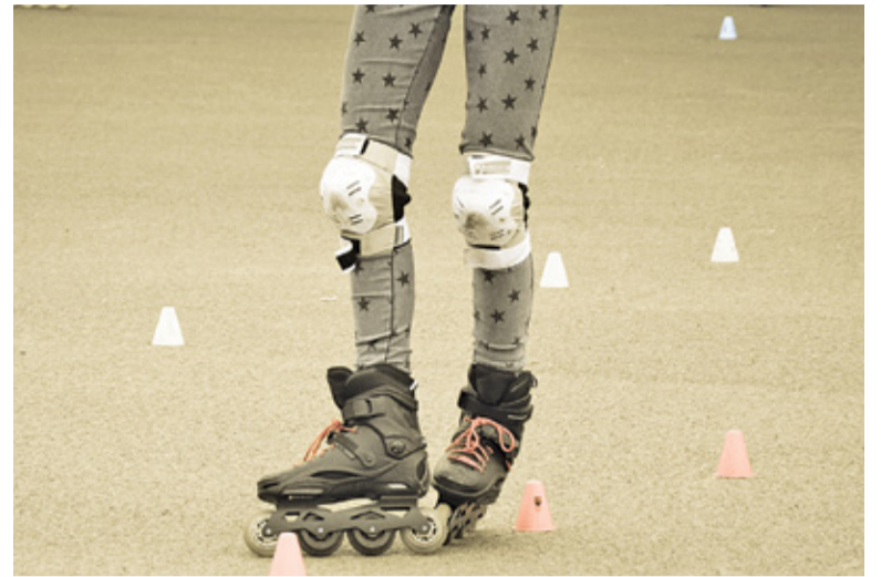
Tor wrotkarski ma powstać jeszcze w tym roku

W przetargu zgłosiły się dwie firmy: PNP Development z Paroli i BT Project z Poznania. Urząd zakładał na realiza-