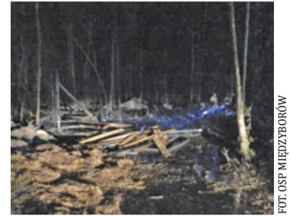
Pożar wybuchł w piątek chwilę po godz. 21.00

Z racji faktu, iż Budy Michałowskie leżą niejako na granicy powiatów grodzkiego i żyrdowskiego, pożar gasiły jednostki z obu powiatów – łącznie 13 zastępów, w tym PSP Grodzisk, OSP Jaktorów i OSP Międzyborów. Akcja trwała niecałe trzy godziny.