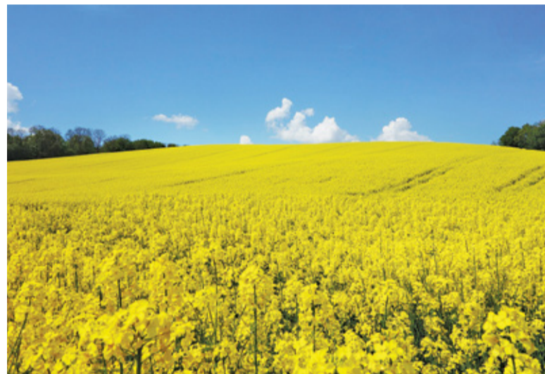
Kwitające pola rzepaku robią niezwykle wrażenie i są wyjątkową zachętą, by choć na kilka chwil uciec od miejskiego zgiełku

Muzeum Narodowego w Warszawie i obejrzeć zbiory dzieł artysty, szukając miejsc, które właśnie zobaczyliśmy?