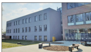
||| Piastów - Finał II etapu s. 2