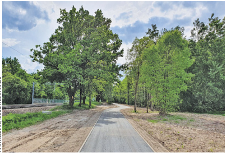
Ścieżka rowerowa między Grudowem a Brwinowem ma być gotowa za kilka dni

Inwestycja to ostatni już etap prac realizowany w ramach Zintegrowanych Inwestycji Terytorialnych. Problematyczne było przygotowanie dokumentacji projektowej. – Projektowanie było najtrudniejszym elementem całego tego procesu – szczególnie w zakresie uzyskania zgód i uzgodnień od PKP PLK, Wód Polskich oraz architektury wojewódzkiej i powiatowej. Szczegółowo