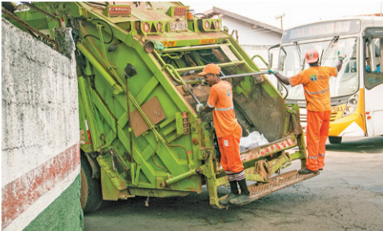
Niższa cena to efekt korzystnego rozstrzygnięcia przetargu na początku roku

Regulamin opłat za wywóz śmieci przewiduje także zniżki. Mieszkańcy, którzy zdecydują się na kompostowanie bioodpadów otrzymają rabat w wysokości 4 zł. Rodziny wielodzietne mogą