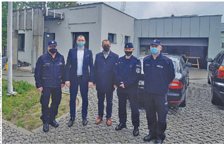
Żabiowscy policjanci już niedługo rozpoczną pracę w nowym posterunku

Zgodnie z informacjami udostępnionymi przez stołeczną policję wynika, że w budynku docelowo służbę będzie pełniło 10 policjantów.