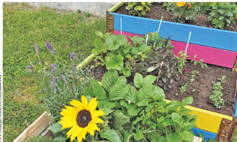
Rośliny pięknie rosną

Tego typu inicjatywy stają się coraz powszechniejsze. Niedawno założony został ogród na terenie Szkoły Podsta-