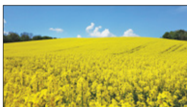
||| Region - Okolice bliższe i dalsze, znane i nieznanne s. 4