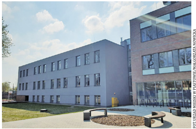
Efekty prac są już widoczne

Władze miasta poinformowały o zakończeniu działań związanych z działaniami w ramach II etapu przebudowy i rozbudowy liceum. – Prace dotyczyły budynku „starej szkoły”, w ramach których wykonano: rozbiórkę budynku kotłowni z kominem, nowe konstrukcje ścian i stropów parteru i dwóch pięter, nową elewację, nową stolarkę okienną i drzwiową oraz ledowe oświetlenie wewnątrz budynku. W budynku „starej szkoły” zostały wykonane także prace instalacyjne – przekazali urzędnicy.