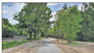
||| Milanówek - Ścieżka na finiszu s. 2