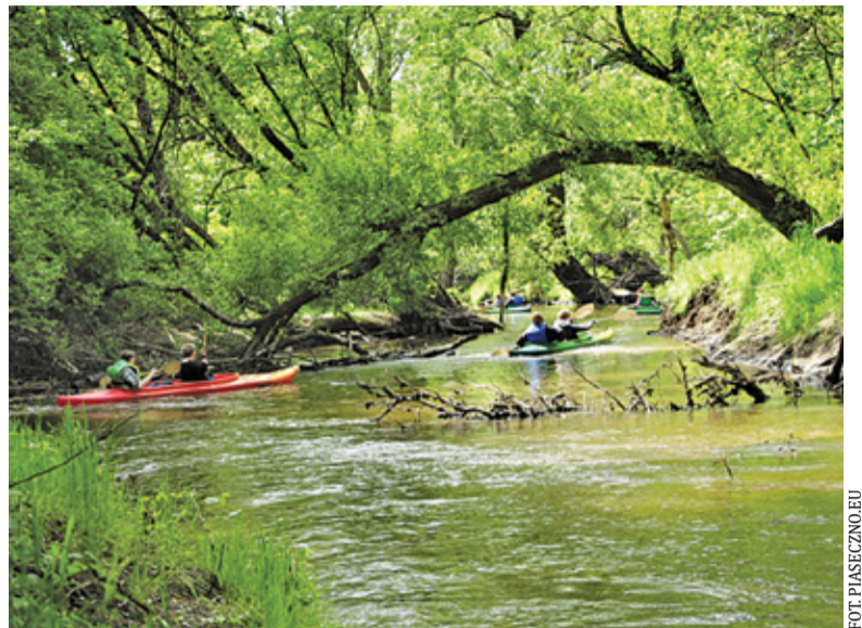
Na Jeziorce mamy do dyspozycji kilka spływów o różnym poziomie trudności

Pozostajemy jeszcze na chwilę w Pruszkowie, by odwiedzić Galerię Figur Stalowych. Znajdziemy tu niezwykle ciekawe połączenie sztuki i przemysłu. Postacie z bajek i filmów science fiction, politycy, gwiazdy estrady, zwierzęta, samochody – a wszystko to stworzone... ze złomu. W dodatku każda rzeźba jest robiona ręcznie, przy użyciu podsta-