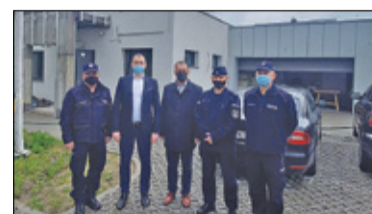
||| Żabia Wola - Posterunek na wykończeniu s. 6