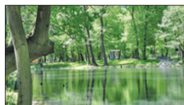
||| Brwinów - Bakterie oczyszczą staw s. 5