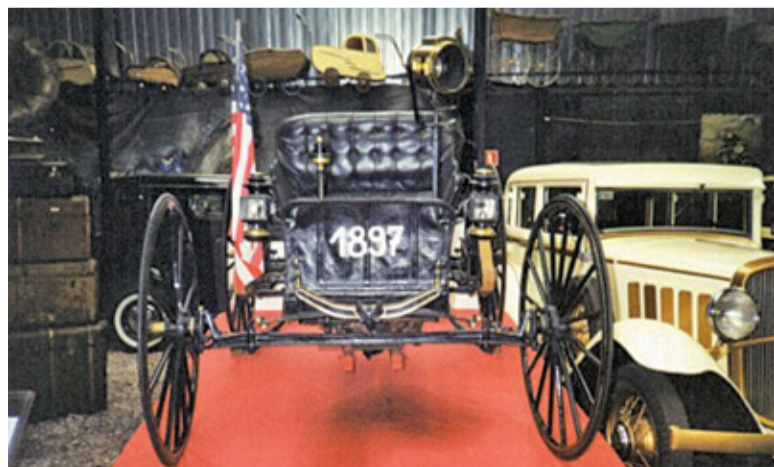
W zbiorach muzeum znajdziemy nawet najstarszy samochód w Polsce – JAG z 1897 roku!

Opuszczamy cmentarz i jedziemy dalej ul. Chełmońskiego. Mijamy kościół i skręcamy w prawo, do ul. Długiej. Przez Kaleń, Grzmiącą i Słubicę docieramy znów do trasy S8. Przecinamy ją