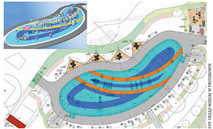
Tak ma wyglądać wodny plac zabaw

Wydawało się, że realizacja jest blisko. W końcu przeprowadzono postępowanie przetargowe. Najkorzystniejsza oferta na wykonanie wodnego placu zabaw opiewała na ok. 5,8 miliona złotych. – Jest atrakcyjna pod kątem tego, co mamy zaplanowane – podkreślał Sipiery. – To nie jest obiekt, który będzie pełnił funkcję przez okres kilku tygodni, jak to na komisjach było mówione. Będzie działał przez cały rok – uzupełniał Konrad Sipiery.