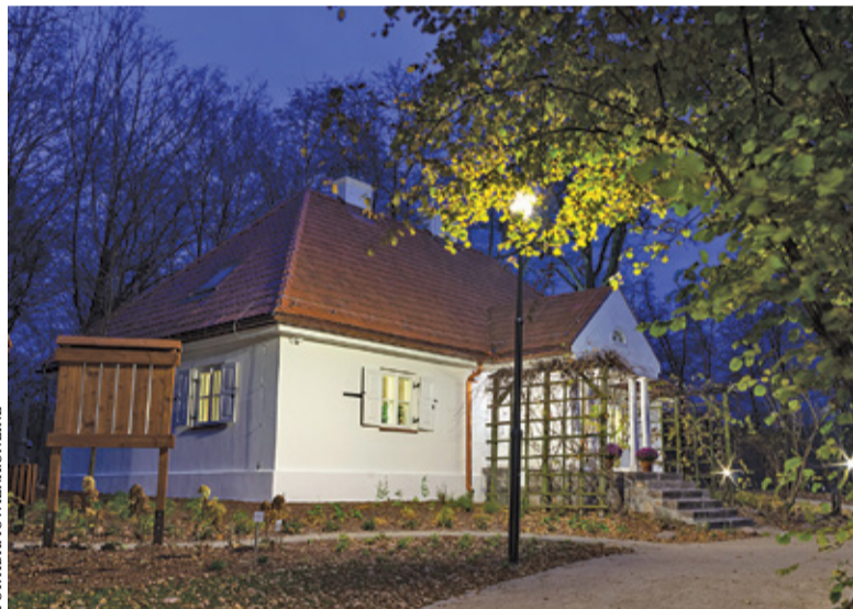
Niedawno odrestaurowany dworek Chełmońskich w Adamowiznie

dalszych okolic. Prezentujemy kilka propozycji na miłe spędzenie wolnego czasu.