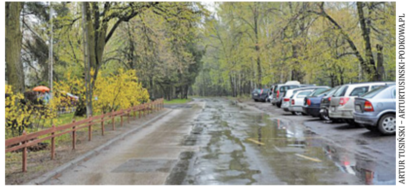
Przebudowa ulicy uporządkuje ważny rejon w centrum miasta

Słowa Tusińskiego zmieniły się w czyn. 28 maja rozpoczęły się prace przy przebudowie ul. Lotniczej. Zakres przebudowy obejmuje wykonanie