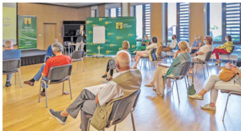
Podczas spotkania nie brakowało pytań

Wiadomo, że uchwała krajobrazowa ma uporządkować przestrzeń i wprowadzić konkretne rozwiązania. W całym procesie należy jednak pamiętać o pogodzeniu interesów stron. – Chcemy zabezpieczyć interesy przedsiębiorców.