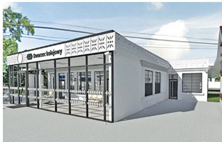
Przewoźnik zaprezentował niedawno wizualizację projektowanego dworca

Milanówku. Planowano wyburzenie starego budynku przy tunelu od strony miasta i postawienie nowego przy tune- lu pod torami. Spółka chciała, aby nowy dworzec składał się z dwóch budynków spiętych kładką nad torami. W obiekcie miały znaleźć się kasy biletowe, toalety, lokal komercyjny oraz dwie poczekalnie – zamknięta i otwarta (nieogrzewana).