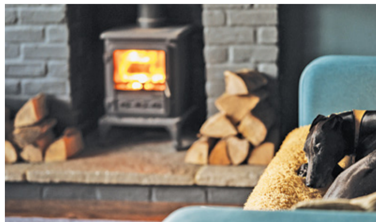
Najbliższe zimy mogą być ostatnimi, kiedy można jeszcze palić drewnem w kominku

Zgodnie z przygotowaną nowelizacją uchwały antysmogowej w obszarze okołowarszawskim zakaz palenia paliwami stałymi miałby zacząć obowiązywać w 2027 roku. Oczywiście wiąże się to ze sporymi kosztami wpro-