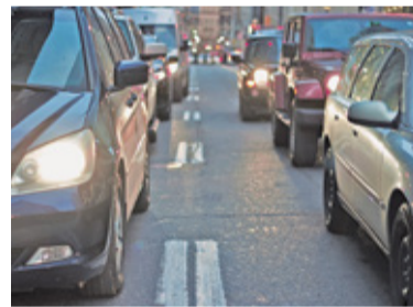
Gmina chciałaby wyprowadzić część ruchu z centrum miasta na jego obrzeża

W projekcie przewidziano dwa możliwe warianty poprowadzenia nowej drogi. Różnice między zaprezentowanymi opcjami są niewielkie i dotyczą odcinka od ul. Nadarzyńskiej do ul. Kijowskiej. Następnie łącznik przetnie ulice Lazurówką, Akwarelową i Osowie-