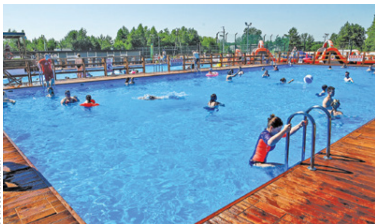
W upalny weekend basen cieszył się ogromnym powodzeniem

Od początku inwestycja realizowana przez gminę Nadarzyn budziła zainteresowanie. W styczniu samorząd wyłonił wykonawcę zadania. Koszt inwestycji opiewał na blisko 5 milionów złotych. Po kilku miesiącach prac można podziwiać efekty. W leśnej otulinie przy ul. Działkowej powstał kompleks rekreacyjny z basenami zewnętrznymi, wodnym placem zabaw, zjeżdżalniami, jacuzzi oraz boiskami. – Nasze baseny letnie są pierwszymi tego typu