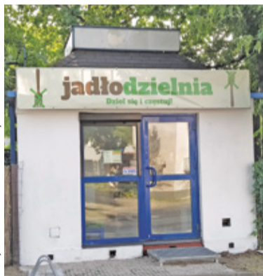
Jadłodzielnia będzie czynna przez 7 dni w tygodniu

Utworzenie punktu, gdzie można podzielić się nadwyżkami jedzenia, było możliwe dzięki pracy wolontariuszy i wsparciu finansowemu mieszkańców.