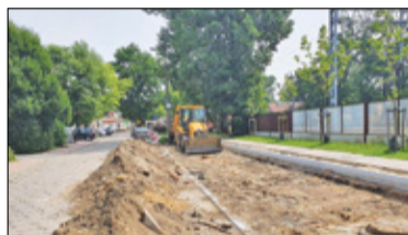
||| Milanówek - Powrót do remontu s. 3