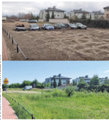
Przed i po

W ostatnich miesiącach Działkowej poświęciliśmy wiele miejsca. Wszystko przez stan nawierzchni, na który mieszkańcy i kierowcy narzekali od lat. Sprawa ciągnęła się, występowały liczne trudności, ale nadszedł