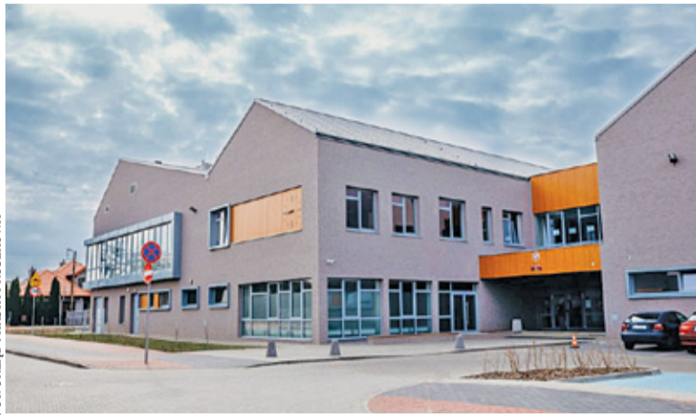
Szkoła Podstawowa nr 5 im. Ignacego Jana Paderewskiego

Pruszków złożył wniosek w ramach projektu „Mazowiecki program przygotowania szkół, nauczycieli i uczniów