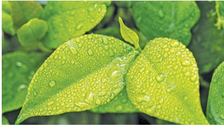
Michałowice, Brwinów, Grodzisk i Piastów z dofinansowaniem

Konkursy cieszyły się zainteresowaniem. – Złożono 173 wnioski o dofinansowanie na łączną kwotę 169,6 mln euro. Warto podkreślić, że 87 wnio-