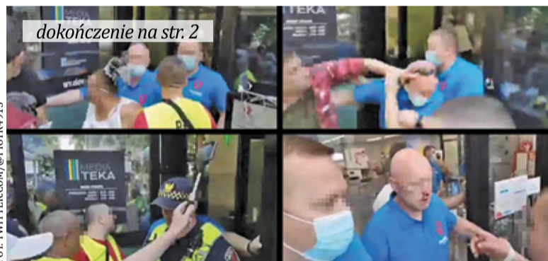
dokończenie na str. 2