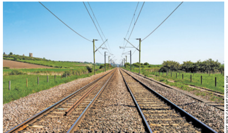
Budowa linii kolejowej nr 85 ma ruszyć za dwa lata. Czy do tego czasu uda się porozumieć i wypracować kompromis?

Na początku czerwca informowaliśmy o planach budowy nitki Kolei Dużych Prędkości. Projekt jest realizowany w ramach budowy infrastruktury towarzyszącej powstaniu Centralnego Portu Komunikacyjnego w Baranowie. Na projektowanej linii nr 85 pociągi mają rozwijać prędkość do 250 km/h. Jak zapowiadał w ubiegłym miesiącu premier Mateusz Morawiecki, budowa KDP pozwoli na skrócenie podróży z Łodzi do Warszawy z półtorej godziny do 45 minut.