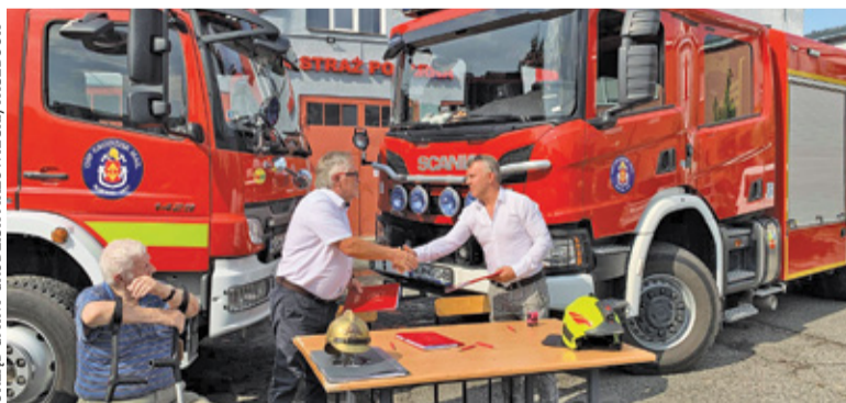
Wykonawca ma teraz 15 miesięcy na realizację zadania

Projekt przewiduje także przebudowę. Po modernizacji w budynku będzie się znajdować zajmująca dwie kondygnacje część socjalno-administracyjna. Z kolei parter zajmą garaże, pomieszczenia techniczne oraz szatnie,