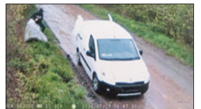
||| Nadarzyn - Koniec z zaśmiecaniem s. 6