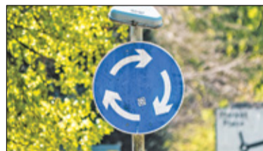
||| Brwinów - Będzie rondo s. 4