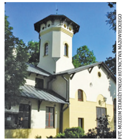
3 sierpnia zbiórka przed Muzeum Starożytnego Hutnictwa Mazowieckiego

Jak widać, różnorodność tematyczna pozwala poznać miasto w wielu aspektach. Brzmi zachęcająco? Sierpniowy terminarz również jest różnorodny. Zerknijmy zatem, co organizatorzy wakacyjnych spacerów proponują uczestnikom. 3 sierpnia temat wydarze-