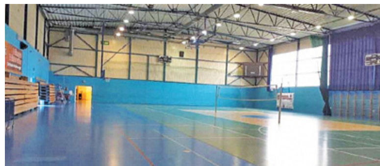
Jedyna złożona oferta przekraczała budżet o ponad pół miliona złotych

Na początku czerwca gmina ogłosiła przetarg na tę inwestycję. Zakres planowanych prac obejmował m.in. wymianę posadzek w hali głównej, sali niebieskiej oraz na widowni. Nowe podłogi