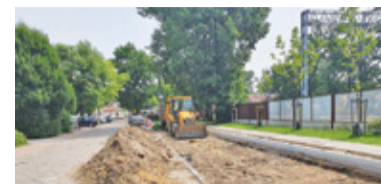
Konserwator sprawdził, czy drzewa są należycie zabezpieczone

Po przerwie wymuszonej działaniami konserwatora wykonawca może kontynuować przebudowę ul. Krakowskiej w Milanówku.