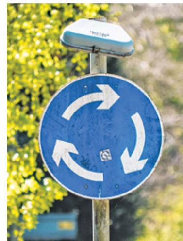
Nowe rondo powinno być gotowe wiosną przyszłego roku

Pomysł budowy ronda jednak budzi sprzeczne opinie wśród mieszkańców. Część kierowców widziałaby tu raczej