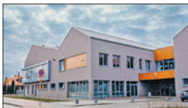
||| Pruszków - 80 tysięcy na sprzęt dla szkoły s. 2

GRODZISK MAZOWIECKI ||| BARANÓW ||| JAKTORÓW ||| PODKOWA LEŚNA ||| MILANÓWEK ||| ŻABIA WOLA PRUSZKÓW ||| PIASTÓW ||| BRWINÓW ||| MICHAŁOWICE ||| NADARZYN ||| RASZYN