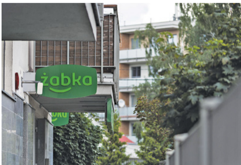
O otwarciu sklepu w niedzielę niehandlową decyduje sam franczyzobiorca

Biuro prasowe Żabki w swoim oświadczeniu wskazuje, że większość sklepów umowę z operatorami pocztowymi miała podpisaną już od 2012