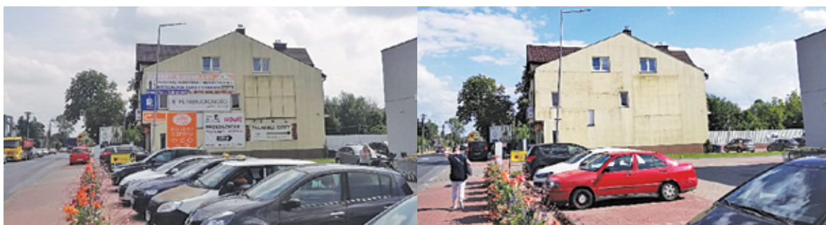
Przed i po usunięciu reklam

Grodziski magistrat rozpoczął prace nad projektem uchwały krajobrazowej. Dokument ma uporządkować kwestie związane z reklamami znajdującymi się w przestrzeni publicznej.