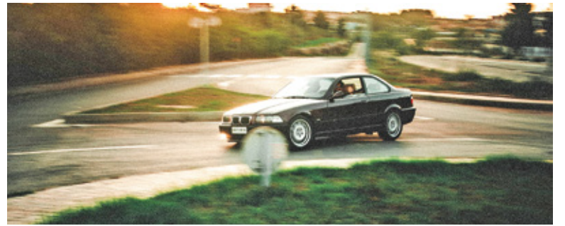
Są odpowiednie miejsca, aby wyszaleć się i rozwinąć prędkość. Na pewno nie są to drogi publiczne

w rejonie Paszkowianki i na ul. Bryły w Pruszkowie. Działania miały miejsce w przedostatni weekend lipca. Policja przeprowadziła osiem kontroli. Czterech kierowców otrzymało mandaty za przekroczenie prędkości. Jeden z nich stracił prawo jazdy wskutek przekroczenia prędkości o ponad 50 km/h w terenie zabudowanym. Policjanci za-