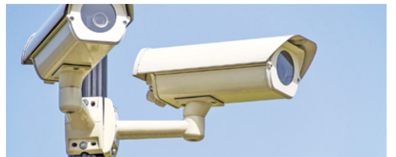
Raszyńska sieć monitoringu powiększy się o 18 kamer

Zadanie podzielono na dwa etapy. W pierwszym z nich wyłoniony w przetargu wykonawca zamontuje część kamer, a także zainstaluje rejestrator obrazu w Urzędzie Gminy i stację oglądową na komisariacie policji. Ta część zadania ma zostać zrealizowana w ciągu 4 mie-