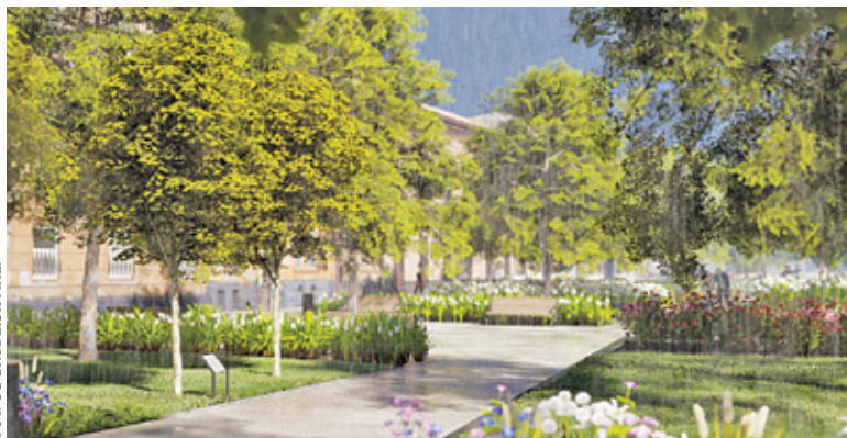
Tak, według wizualizacji, ma prezentować się zrewitalizowany Plac Wolności

Przebudowa placu ma być tzw. inwestycją zielono-niebieską. Mówiąc najprościej oznacza to, że główny nacisk będzie spoczywał na rozwoju zieleni miejskiej oraz retencji wód. Gmina planuje maksymalnie zwiększyć powierzchnię biologicznie czynną placu, rezygnując