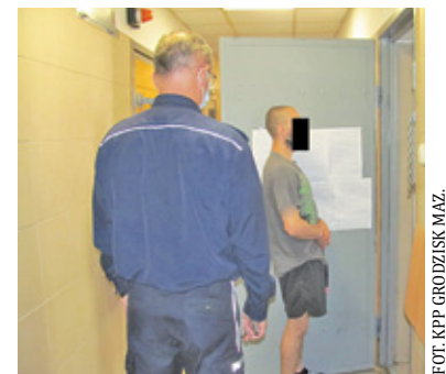
Mężczyzna przyznał się do stawianych mu zarzutów

Podczas przesłuchania mężczyzna przyznał się, że oprócz odzyskanego podczas zatrzymania roweru dopuścił się kradzieży 15 innych jednośladów. Usłyszał już zarzuty. Jak informuje rzeczniczka grodziskiej komendy asp.