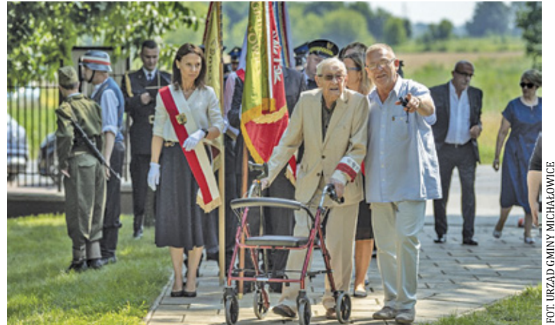
Mieszkańcy uczcili pamięć powstańców

31 lipca mieszkańcy Piastowa mogli wziąć udział w uroczystej mszy św. w intencji powstańców w parafii Chrystusa Króla Wszechświata. Z kolei 1 sierpnia śpiewano powstańcze piosenki, pod po-