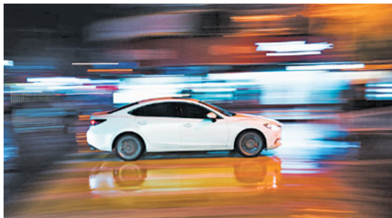
Nutkę adrenaliny można poczuć na torze wyścigowym

W wakacje zanotowano już ponad 200 wypadków na polskich drogach. Funkcjonariusze wielokrotnie apelują o rozsądek podczas jazdy i stosowanie się do przepisów. W lipcu w Regulach doszło do kolejnego w tym roku śmiertelnego wypadku na terenie powiatu pruszkowskiego. - Apelujemy