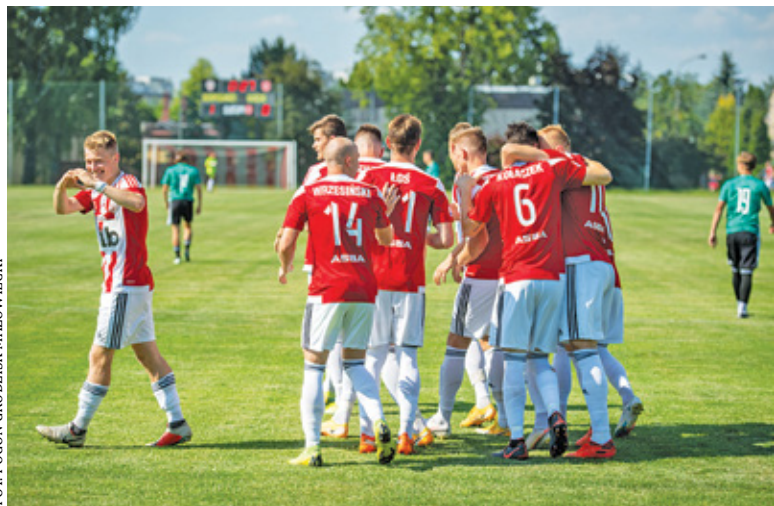
Sokół – Pogoń 0:2