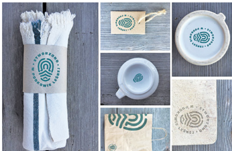
Logo jest proste, a jednocześnie estetyczne