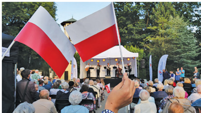
Koncert „niezakazanych” piosenek